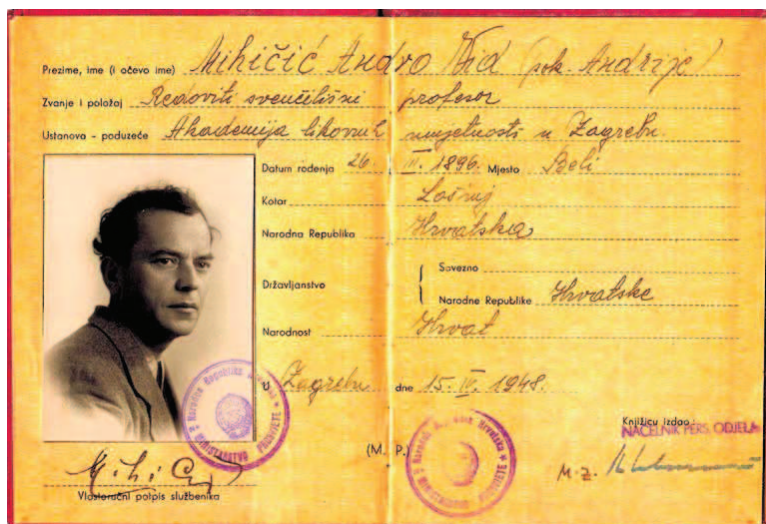
Slika 2. Osobna iskaznica

umjetnosti, na kojoj je, kao sljednik Ljube Babića, predavao povijest umjetnosti do umirovljenja 1966. godine.