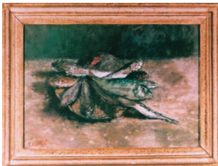
Slika 4. Slika iz zbirke Mihičić, Emanuel Vidović

se putem multimedije, posebno digitalizirane žive riječi interpretatora probranih pjesama i ulomaka tekstova, oživio mu-