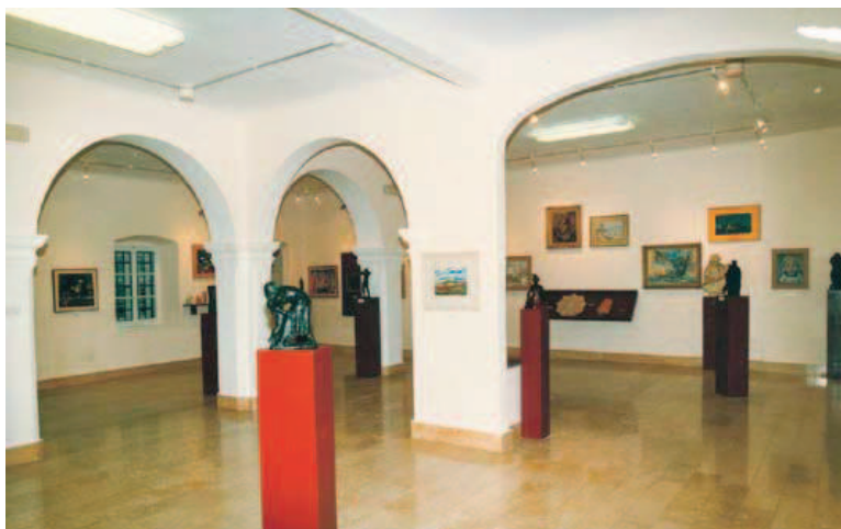
Slika 3. Stalni postav zbirke hrvatskih majstora u Palači Fritzy