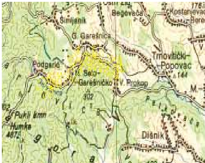
Slika 2. Smještaj posjeda i naselja Garyguasarhel

Budući da je bilo uobičajeno da na pojedinom posjedu nastaje istoimeno naselje, postojala su i naselja imena Garić. Takav je primjer Garyguasarhel (Trg Garić, posjed i naselje).