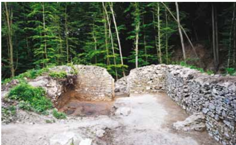
Slika 3. Pogled iz svetišta prema lađi samostanske crkve nakon arheoloških istraživanja 2010.