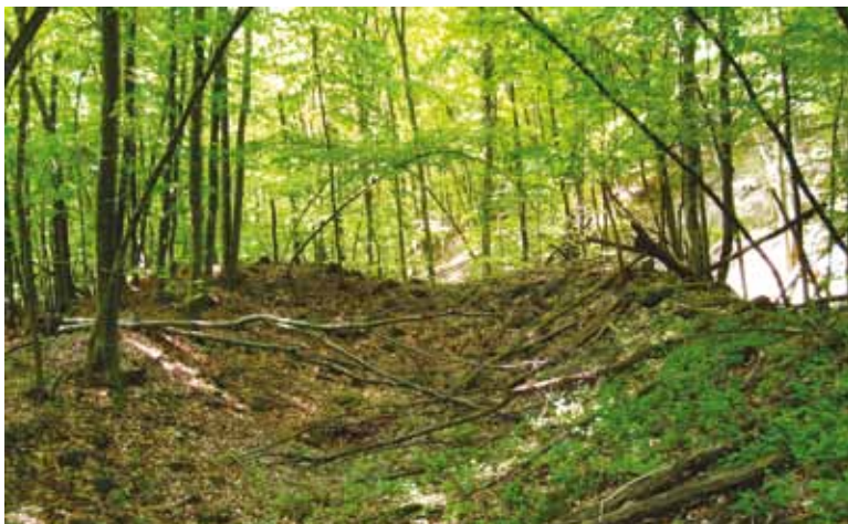
Slika 2. Pogled iz svetišta prema lađi samostanske crkve prije početka arheoloških istraživanja

Tijekom dvije sezone arheoloških radova istražena je crkva po cijeloj dužini (od zapadnog pročelja do tjemena poligonalne apside) unutar sjevernog dijela longitudinalne simetrale. Time je postalo moguće rekonstruirati njene vanjske (dužina 3.155 cm, širina 1.050 cm) i unutarnje (lađa: 1.665 x 860 cm; svetište: 1.275 x 650 cm) dimenzije. Lađa je od svetišta bila odijeljena trijumfalnim lukom, čije dimenzije svijetlog otvora za sada nije moguće sa sigurnošću odrediti (slika 2., slika 3.).