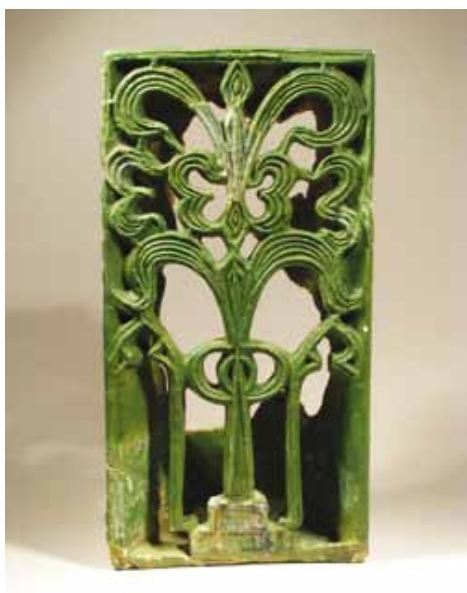
Slika 25. Pećnjak, (14. - 16. st.), glina