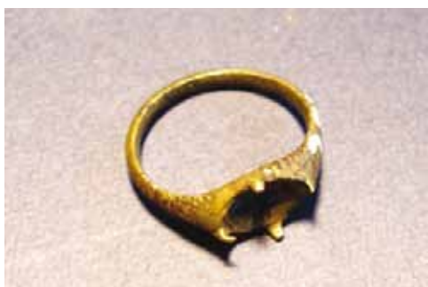
Slika 9. Prsten (14. - 16. st.), mesing

Prstenje bakrenih legura sa staklenim umecima, sitni predmeti, bočice, ukrasi dokumentiraju onu intimniju atmosferu ljudskih odnosa, navika i običaja.