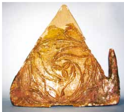
Slika 24. Pećnjak, (14. - 16. st.), glina