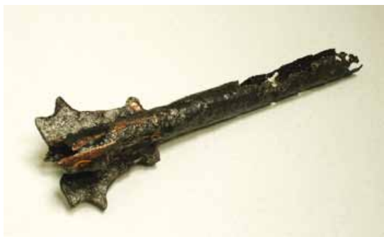
Slika 7. Buzdovan (14. - 16. st.), bakar, željezo (čelik)