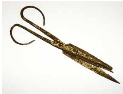
Slika 14. Škare (14. - 16. st.), željezo