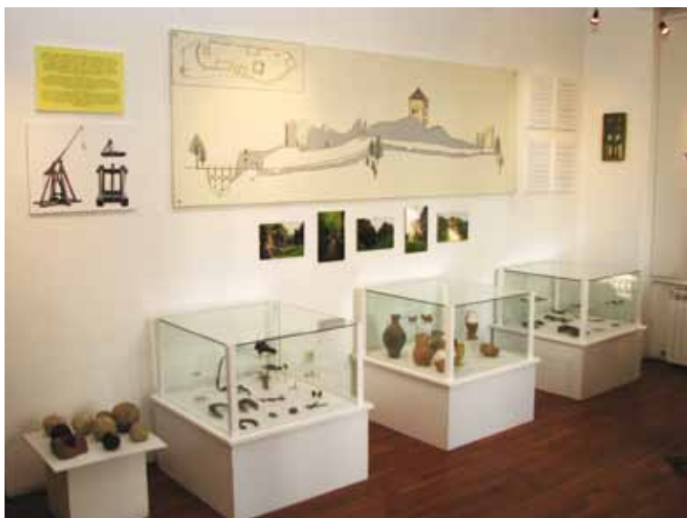
Slika 27. Većina inventara izložena je u stalnom postavu Muzeja Moslavine