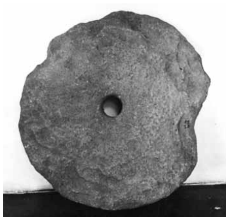
Slika 4. Mlinski kamen (14. - 16. st.)

Potkove, žvale, ostruge, praporci, konjske orme pa i gotički buzdovan šestoperac crtavaju nam lik njegova gospodara-ratnika, viteza-konjanika.