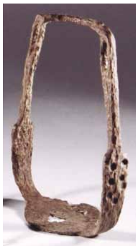
Slika 5. Stremen (14. - 16. st.), željezo

Potkove, žvale, ostruge, praporci, konjske orme pa i gotički buzdovan šestoperac crtavaju nam lik njegova gospodara-ratnika, viteza-konjanika.