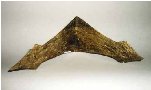
Slika 13. Ukrasni okovi (14. - 16. st.), željezni lim

Okovi, čavli, škare, klinovi, šila, svrdla, strugala svjedoče o vrsti i opsegu obrtničkih poslova.