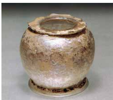
Slika 11. Dio staklene posude (14. - 16. st.)