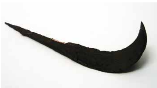
Slika 16. Strugač (14. - 16. st.), željezo