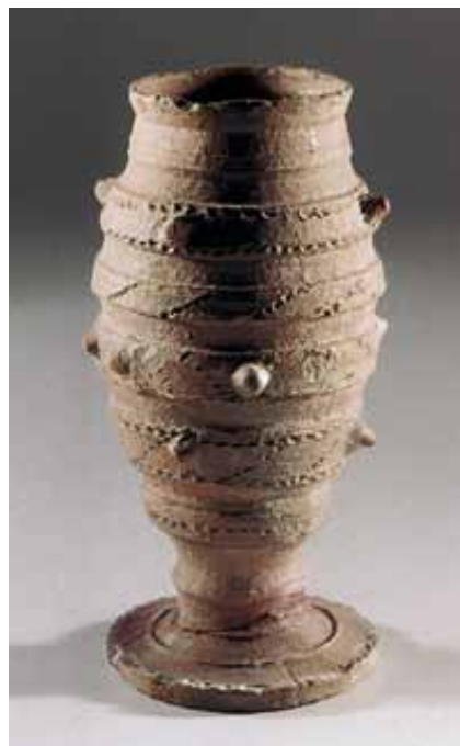
Slika 22. Čaša (14. - 16. st.), keramika

I nakraju, garićgradski su pećnjaci ukrašeni bogatom gotičkom ornamentikom i ocakljeni žutom ili zelenom olovnom glazurom. Iznimno su vrijedan kulturno-povijesni inventar grada Garića. Kvalitetom svoje izrade dokazuju ne samo tehničku spretnost lončara graditelja garićkih peći već i nesumnjive veze i utjecaje drugih keramičkih centara u Austriji i Mađarskoj. Mašta srednjovjekovnog čovjeka u kreiranju ove dekoracije, ispunjena čudnovatim predodžbama i shvaćanjima vidljivog svijeta i straha od svega nepoznatog, stvarala je fantastične likove životinjskog svijeta te izražavala scene viteškog života i biblijskog sadržaja. 6