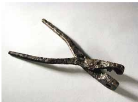
Slika 19. Kliješta za lijevanje projektila, (14. - 16. st.), željezo