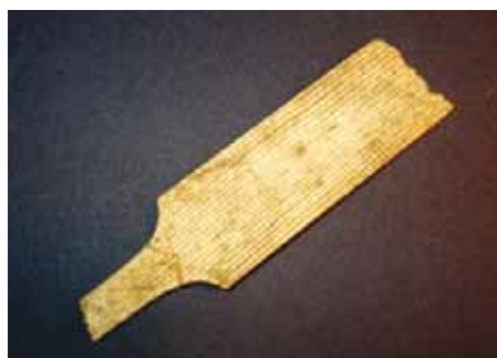
Slika 10. Kozmetička turpija (14. - 16. st.), kost