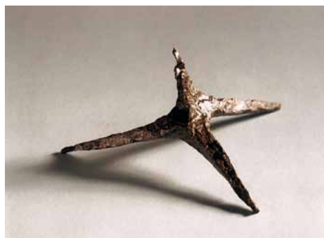
Slika 20. Trn "Vranina noga" (14. - 16. st.), željezo