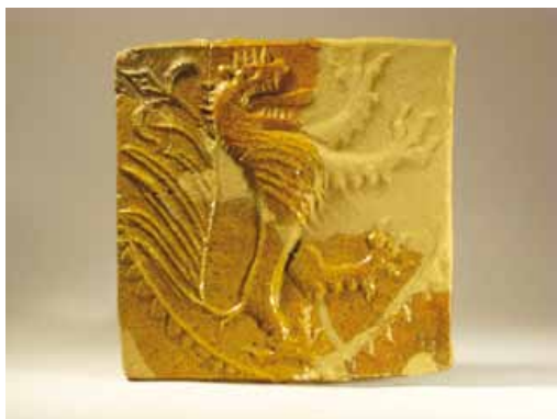
Slika 23. Pećnjak, (14. - 16. st.), glina