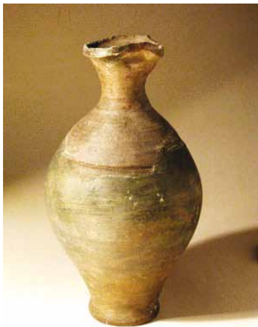
Slika 21. Posuda s izljevom (14. - 16. st.), glina

Pronađeno je i mnoštvo keramike: vrčevi i posude, dijelovi lonaca, čaše.