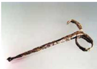
Slika 15. Svrdlo (14. - 16. st.), željezo