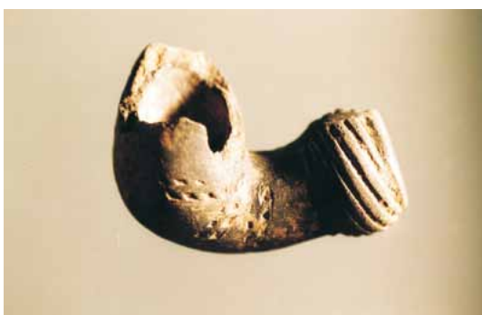
Slika 12. Lula (14. - 16. st.), glina