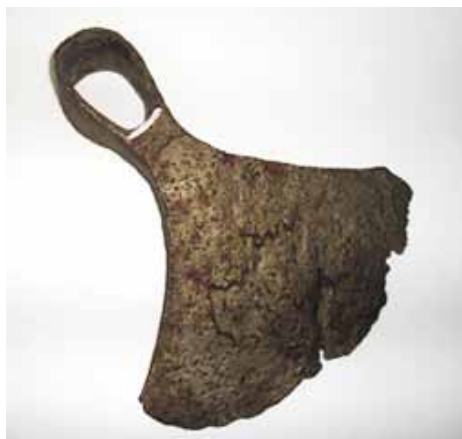
Slika 3. Motika (14. - 16. st.), željezo

Primjerci poljoprivrednog alata – srpovi, motike, sječiva, sjekire, žrvanj – govore o poljoprivrednoj djelatnosti i gospodarskoj ulozi grada.