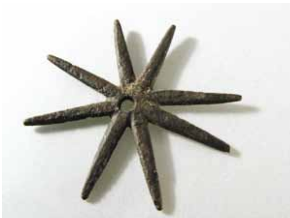
Slika 6. Zvijezda (ukras za ostrugu) (14. - 16. st.), željezo