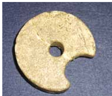
Slika 8. "Orah" samostrijela (14. - 16. st.), kost

Prstenje bakrenih legura sa staklenim umecima, sitni predmeti, bočice, ukrasi dokumentiraju onu intimniju atmosferu ljudskih odnosa, navika i običaja.