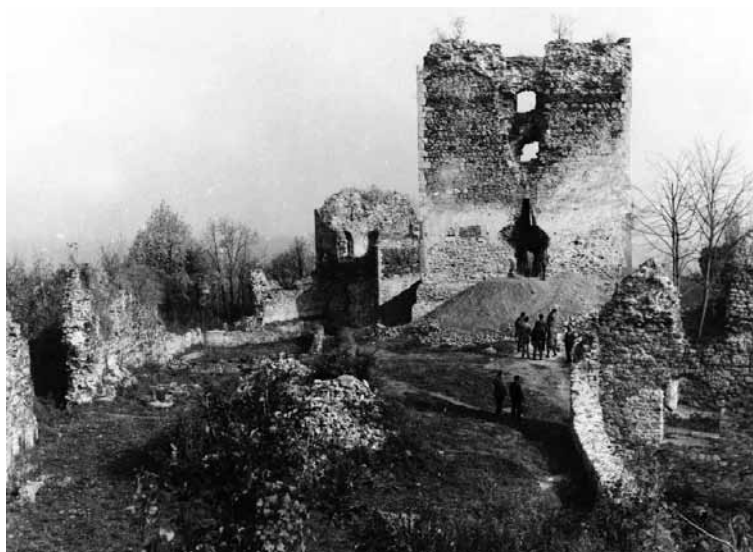
Slika 1. Garić-grad, 1968.

Od tada pa do 1968. godine pokušavao je Muzej Moslavine pokrenuti veću akciju arheoloških i konzervatorskih radova. Ta su uporna nastojanja Muzeja konačno urodila plodom navedene godine, kad su moslavačke komune, u ravnomjernoj participaciji finansijskih sredstava s Republičkim fondom za unapređenje kulturnih djelatnosti Socijalističke Republike Hrvatske i svojim razumijevanjem za spašavanje toga važnog kulturno-povijesnog spomenika te sa željom i htijenjem da se konzervirani i možda restaurirani Garić-grad u skoroj budućnosti uklopi u već poznati rekreacijski centar Moslavine – Podgarić 1 , omogućili početak istraživačkih radova, radova čišćenja i priprema za konzervaciju i namjensku restauraciju, koja će etapno u fazama dovesti do njegove konačne prezentacije javnosti. 2