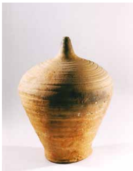
Slika 26. Pećnjak, (14. - 16. st.), glina