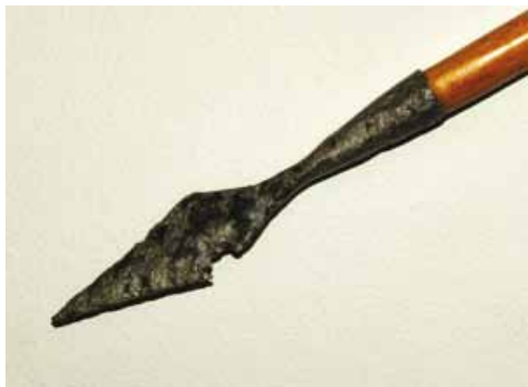
Slika 17. Vrh strijele (14. - 16. st.), željezo

Željezne strelice, njihova brojnost i raznovrsnost, primitivno kovanje i velik komad amorfnog željeza potvrđuju da su se garićgradski branitelji sami naoružavali tom vrstom oružja.