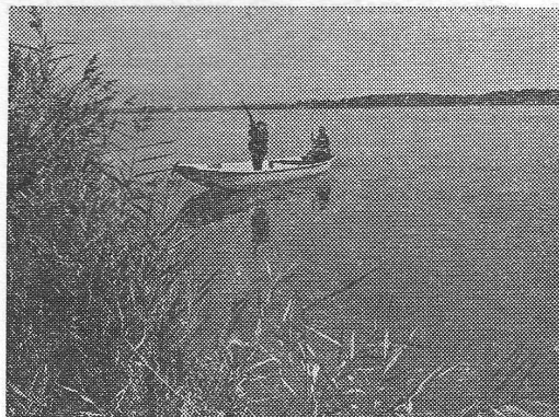
Sl. 1. Panorama saničanskih ribnjaka s talijanskim lovcima u lovu na patke

Uz pomenuto, kupljene su tri teške mašine (bager i dva buldožera) kojima je mnogo urađeno na rekonstrukciji samih objekata za uzgoj ribe. Dva