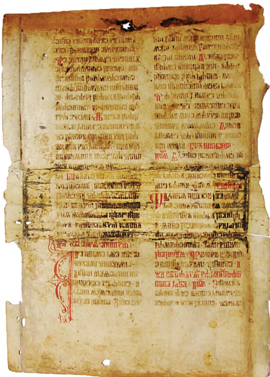
Slika 2. Varaždinski list hrvatskoglagoljskoga misala 1c–d, kraj 14. ili poč. 15. st. Figure 2. The Varaždin leaf from a Croatian Glagolitic Missal 1c–d, the late 14 th or the beginning of the 15 th c.