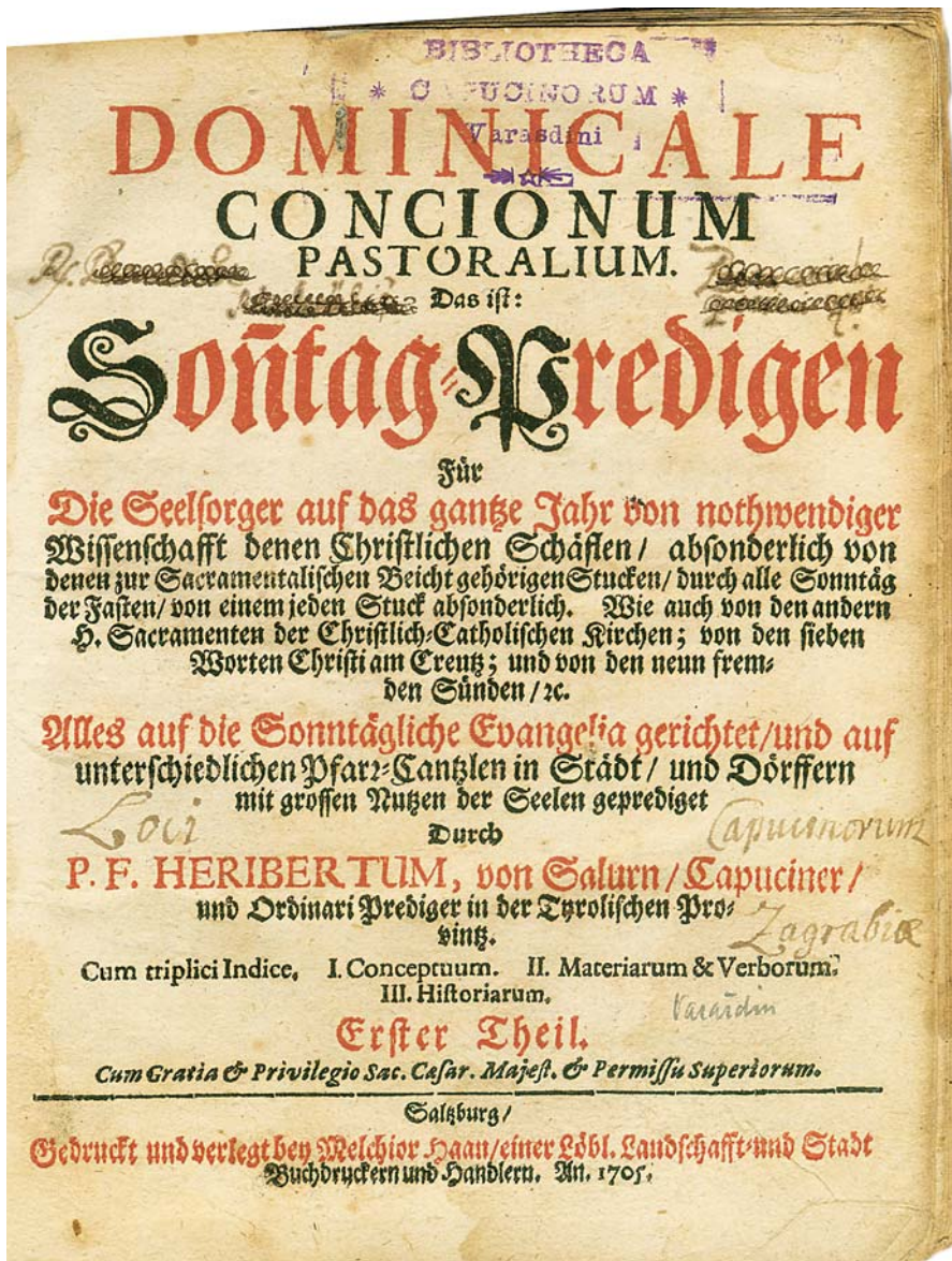
Slika 3. Naslovna stranica knjige pod signaturom IX c. 6.

Dominicale concionum pastoralium (Salzburg 1705.)