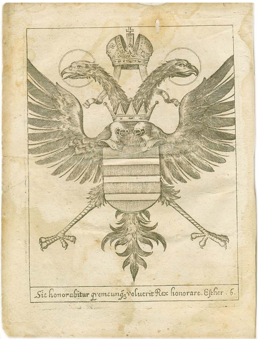
Slika 5. Drugi list knjige Dominicale concionum pastoralium – verso Figure 5. The 2 nd leaf of the book Dominicale concionum pastoralium – verso