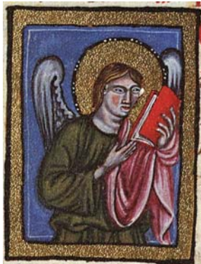
Sl. 38. Andeo – simbol sv. Mateja Evanđelista (Hrvojev misal, f. 181c) Fig. 38. Angelo – simbolo di S. Matteo Vangelista (Messale del Duca Hrvoje, f. 181c)