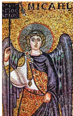
Sl. 34. Sv. Mihovil Arkandeo, 6. st., mozaik (Ravenna, S. Apollinare in Classe) Fig. 34. S. Michele Archangelo, 6. sec., mosaico (Ravenna, S. Apollinare in Classe)