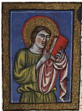
Sl. 6. Sv. Matej Apostol (Hrvojev misal, f. 167b) Fig. 6. S. Matteo Apostolo (Messale del Duca Hrvoje, f. 167b)