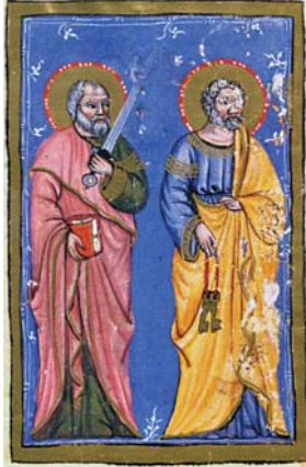
Sl. 27. Sv. Pavao i sv. Petar apostoli (Hvalov zbornik, f. 2v) Fig. 27. SS. Paolo e Pietro Apostoli (Codex »Christiani« nomine Hval, f. 2v)