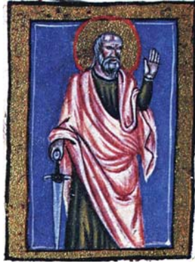
Sl. 26. Sv. Pavao Apostol (Hrvojev misal, f. 151 c) Fig. 26. S. Paolo Apostolo (Messale del Duca Hrvoje, f. 151c)