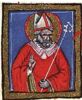
Sl. 55. Sv. Augustin biskup (Hrvojev misal, f. 177b) Fig. 55. S. Agostino vescovo (Messale del Duca Hrvoje, f. 177b)