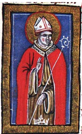
Sl. 54. Sveti Ludovik, franjevac i biskup (Sv. Ljudevit, lat. Ludovicus Tolosanus ), Hrvojev misal, f. 176a Fig. 54. S. Lodovico francescano e vescovo (S. Lodovico di Tolosa), Messale del Duca Hrvoje, f. 176a