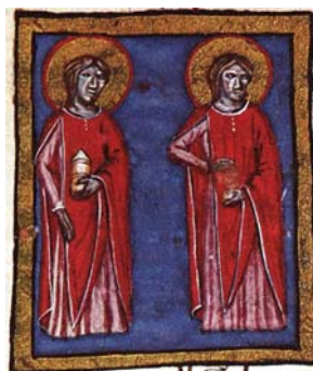
Sl. 46. Sv. Kuzma i Damjan (Hrvojev misal, f. 182b) Fig. 46. SS. Cosma e Damiano (Messale del Duca Hrvoje, f. 182b)