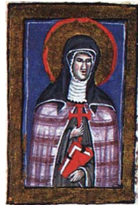
Sl. 53. Sv. Klara Asiška (Hrvojev misal, f. 174a)

Fig. 51. S. Giacomo Apostolo (Messale del Duca Hrvoje, f. 171a)