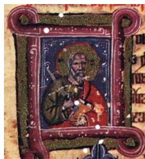
Sl. 23. Sv. Pavao Apostol, ilustrirani inicijal B (Hrvojev misal, f. 1b) Fig. 23. S. Paolo Apostolo, l'iniziale illustrata B (Messale del Duca Hrvoje, f. 1b)