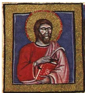
Sl. 7. Sv. Luka Evanđelist (Hrvojev misal, f. 41c) Fig. 7. S. Luca Vangelista (Messale del Duca Hrvoje, f. 41c)