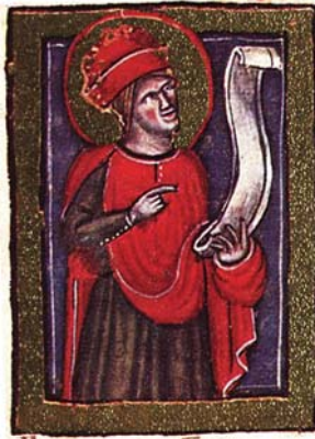
Sl. 3. Prorok Danijel (Hrvojev misal, f. 49a) Fig. 3. Il profeta Daniele (Messale del Duca Hrvoje, f. 49a)