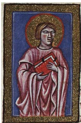
Sl. 19. Sv. Barnaba Apostol (Hrvojev misal, f. 162b) Fig. 19. S. Barnaba Apostolo (Messale del Duca Hrvoje, f. 162b)