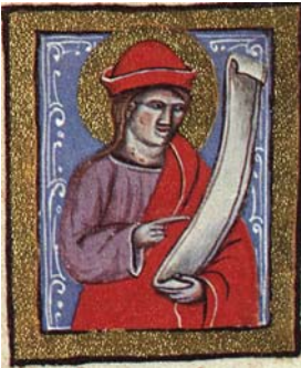
Sl. 2. Prorok Elizej (Hrvojev misal, f. 43c) Fig. 2. Il profeta Eliseo (Messale del Duca Hrvoje, f. 43c)