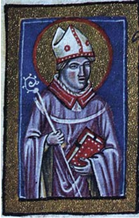
Sl. 48. Sv. Kirijak (Cirijak) biskup i mučenik (Hrvojev misal, f. 160b)

Fig. 48. S. Ciriaco vescovo e martire (Messale del Duca Hrvoje, f. 160b)