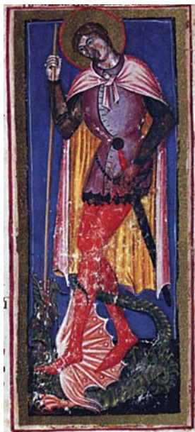
Sl. 36. Sv. Mihovil Arkandeo (Hrvojev misal, f. 242b) Fig. 36. S. Michele Archangelo (Messale del Duca Hrvoje, f. 242b)