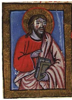
Sl. 10. Sv. Luka Evanđelist (Hrvojev misal, f. 184d) Fig. 10. S. Luca Vangelista (Messale del Duca Hrvoje, f. 184d)