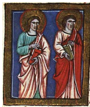
Sl. 22. Sv. Petar i Pavao apostoli (Hrvojev misal, f. 166d) Fig. 22. SS. Pietro e Paolo apostoli (Messale del Duca Hrvoje, f. 166d)