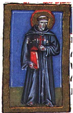
Sl. 57. Sv. Franjo Asiški (Hrvojev misal, f. 183d) Fig. 57. S. Francesco di Assisi (Messale del Duca Hrvoje, f. 183d)