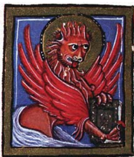
Sl. 39. Lav – simbol sv. Marka Evanđelista (Hrvojev misal, f. 73d) Fig. 39. Leone – simbolo di S. Marco Vangelista (Messale del Duca Hrvoje, f. 73d)