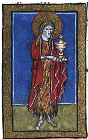
Sl. 31. Sv. Marija Magdalena (Hrvojev misal, f. 170b) Fig. 31. S. Maria Maddalena (Messale del Duca Hrvoje, f. 170b)