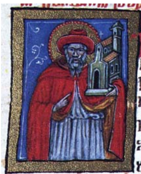
Sl. 56. Sv. Jeronim (Hrvojev misal, f. 183c) Fig. 56. S. Geronimo (Messale del Duca Hrvoje, f. 183c)