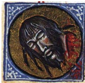
Sl. 32. Glavosijek sv. Ivana Krstitelja (Hrvojev misal, f. 177d) Fig. 32. Martirio di S. Giovanni Battista (Messale del Duca Hrvoje, f. 177d)