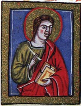
Sl. 12. Sv. Ivan Evāndelist (Hrvojev misal, f. 100c) Fig. 12. S. Giovanni Vangelista (Messale del Duca Hrvoje, f. 100c)