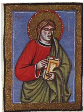
Sl. 9. Sv. Luka Evanđelist (Hrvojev misal, f. 114a) Fig. 9. S. Luca Vangelista (Messale del Duca Hrvoje, f. 114a)