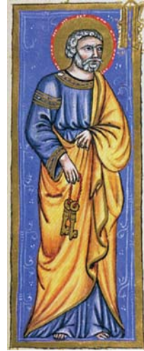
Sl. 28. Sv. Petar Apostol (Hvalov zbornik, f. 202r) Fig. 28. S. Pietro Apostolo (Codex »Christiani« nomine Hval, f. 202r)