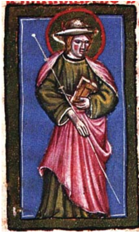
Sl. 51. Sv. Jakov Apostol (Hrvojev misal, f. 171a)

Fig. 49. S. Antonio di Padova (Messale del Duca Hrvoje, f. 162c)