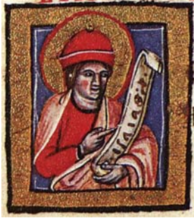
Sl. 1. Prorok Izaija (Hrvojev misal, f. 15c) Fig. 1. Il profeta Isaiah (Messale del Duca Hrvoje, f. 15c)