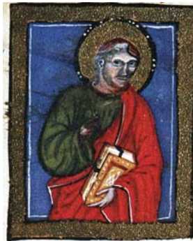
Sl. 15. Sv. Ivan Evāndelist (Hrvojev misal, f. 180b) Fig. 15. S. Giovanni Vangelista (Messale del Duca Hrvoje, f. 180b)