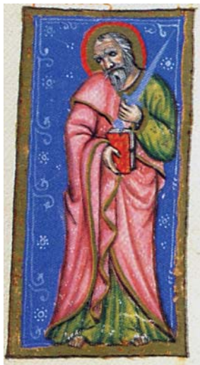
Sl. 30. Sv. Pavao Apostol (Hvalov zbornik, f. 225r) Fig. 30. S. Paolo Apostolo (Codex »Christiani« nomine Hval, f. 225r)