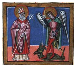
Sl. 35. Sv. Dujam i sv. Mihovil Arkandeo (Hrvojev misal, f. 160d) Fig. 35. SS. Domnio e Michele Archangelo (Messale del Duca Hrvoje, f. 160d)