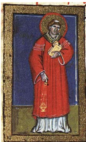
Sl. 45. Sv. Lovro mučenik (Hrvojev misal, f. 173c) Fig. 45. S. Lorenzo martire (Messale del Duca Hrvoje, f. 173c)