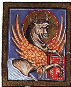
Sl. 40. Vol – simbol sv. Luke Evanđelista (Hrvojev misal, f. 77d) Fig. 40. Bue – simbolo di S. Luca Vangelista (Messale del Duca Hrvoje, f. 77d)