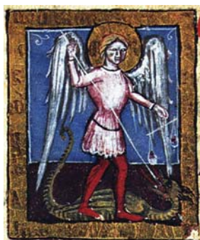
Sl. 33. Sv. Mihovil Arkandeo (Hrvojev misal, f. 183a) Fig. 33. S. Michele Archangelo (Messale del Duca Hrvoje, f. 183a)