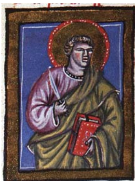
Sl. 20. Sv. Bartolomej Apostol (Hrvojev misal, f. 176d) Fig. 20. S. Bartolommeo Apostolo (Messale del Duca Hrvoje, f. 176d)