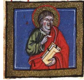
Sl. 16. Sv. Ivan Evāndelist (Hrvojev misal, f. 186b) Fig. 16. S. Giovanni Vangelista (Messale del Duca Hrvoje, f. 186b)