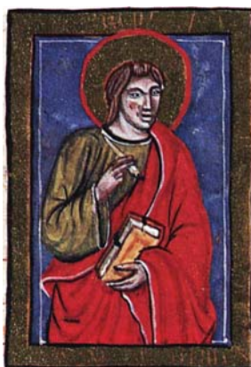
Sl. 11. Sv. Ivan Evanđelist (Hrvojev misal, f. 99d) Fig. 11. S. Giovanni Vangelista (Messale del Duca Hrvoje, f. 99d)