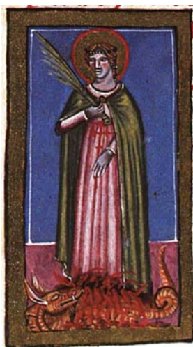
Sl. 44. Sv. Margareta mučeni- nica (Hrvojev misal, f. 169d) Sl. 44. S. Margherita martire (Messale del Duca Hrvoje, f. 169c)