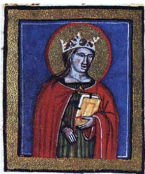
Sl. 42. Sv. Jelena Križarica (Hrvojev misal, f. 159c) Fig. 42. S. Elena di Santa Croce (Messale del Duca Hrvoje, f. 159c)