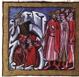
Sl. 4. Prorok Danijel u lavljoj jami (Hrvojev misal, f. 61c) Fig. 4. Il profeta Daniele ne- lla buca di leoni (Messale del Duca Hrvoje, f. 61c)