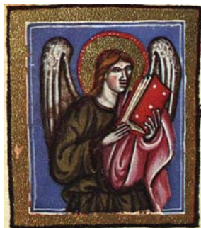
Sl. 37. Andeo – simbol sv. Mateja Evanđelista (Hrvojev misal, f. 69c) Fig. 37. Angelo – simbolo di S. Matteo Vangelista (Messale del Duca Hrvoje, f. 69c)