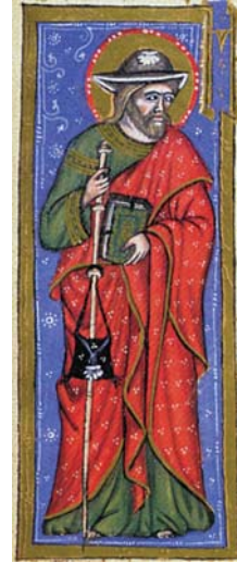
Sl. 52. Sv. Jakob Apostol (Hvalov zbornik, 1404., f. 198r)

Fig. 50. S. Apollinare vescovo (Messale del Duca Hrvoje, f. 170c)