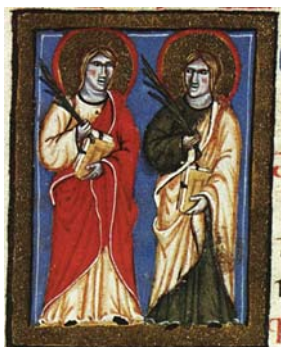
Sl. 18. Sv. Filip i Jakov apostoli (Hrvojev misal, f. 159a) Fig. 18. SS. Filippo e Giacomo apostoli (Messale del Duca Hrvoje, f. 159a)