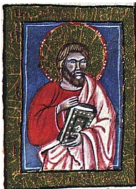
Sl. 8. Sv. Luka Evanđelist (Hrvojev misal, f. 64a) Fig. 8. S. Luca Vangelista (Messale del Duca Hrvoje, f. 64a)