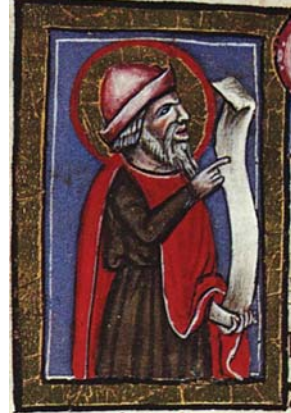
Sl. 5. Prorok Ilija (Hrvojev misal, f. 56d) Fig. 5. Il profeta Elia (Messale del Duca Hrvoje, f. 56d)