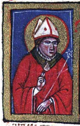
Sl. 50. Sv. Apolinar biskup (Hrvojev misal, f. 170c)

Fig. 48. S. Ciriaco vescovo e martire (Messale del Duca Hrvoje, f. 160b)