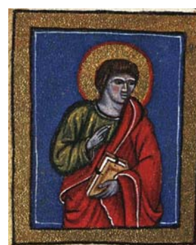
Sl. 17. Sv. Ivan Evāndelist (Hrvojev misal, f. 160c) Fig. 17. S. Giovanni Vangelista (Messale del Duca Hrvoje, f. 160c)