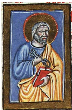
Sl. 21. Sv. Petar Apostol (Hrvojev misal, f. 166a) Fig. 21. S. Pietro Apostolo (Messale del Duca Hrvoje, f. 166a)