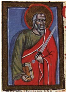
Sl. 25. Sv. Pavao Apostol (Hrvojev misal, f. 202d) Fig. 25. S. Paolo Apostolo (Messale del Duca Hrvoje, f. 202d)