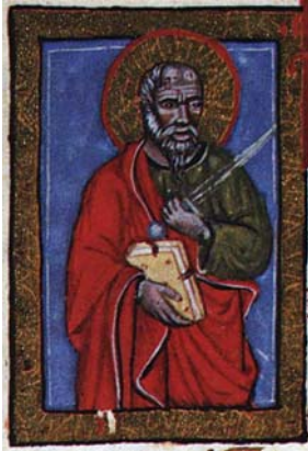
Sl. 24. Sv. Pavao Apostol (Hrvojev misal, f. 167d) Fig. 24. S. Paolo Apostolo (Messale del Duca Hrvoje, f. 167d)