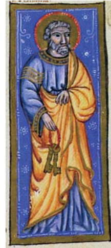
Sl. 29. Sv. Petar Apostol (Hvalov zbornik, f. 205v) Fig. 29. S. Pietro Apostolo (Codex »Christiani« nomine Hval, f. 205v)