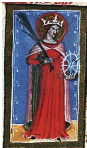
Sl. 47. Sv. Katarina Aleksandrijska (Hrvojev mi- sal, f. 189a) Fig. 47. S. Caterina di Alessandria (Messale del Duca Hrvoje, f. 189a)