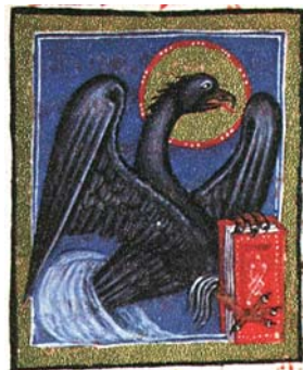
Sl. 41. Orao – simbol sv. Ivana Evanđelista (Hrvojev misal, f. 84b) Fig. 41. Aquila – simbolo di S. Giovanni Vangelista (Messale del Duca Hrvoje, f. 84b)