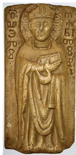
Sl. 59. Reljef s likom sv. Martina biskupa i glagoljskim natpisom iz Senja, oko 1330. Fig. 59. Rilievo di S. Martino vescovo con la scrittura croato-glagolitica di Segna, c. 1330.