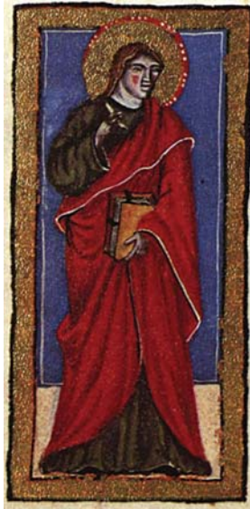
Sl. 14. Sv. Ivan Evāndelist (Hrvojev misal, f. 117c) Fig. 14. S. Giovanni Vangelista (Messale del Duca Hrvoje, f. 117c)