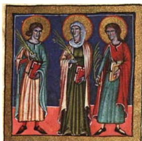
Sl. 43. Sv. Vid, Modest i Krescencija (Hrvojev misal, f. 163b) Fig. 43. SS. Vito, Modesto e Crescencija (Messale del Duca Hrvoje, f. 163b)