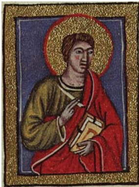
Sl. 13. Sv. Ivan Evāndelist (Hrvojev misal, f. 101b) Fig. 13. S. Giovanni Vangelista (Messale del Duca Hrvoje, f. 101b)