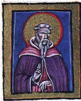
Sl. 49. Sv. Antun Padovanski (Hrvojev misal, f. 162c)

Fig. 52. S. Giacomo Apostolo (Codex »Christiani« nomine Hval, 1404., f. 198r)