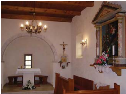
Slika 1. Crkva sv. Andrije, Žgombići Picture 1. Church of St. Andrew, Žgombići