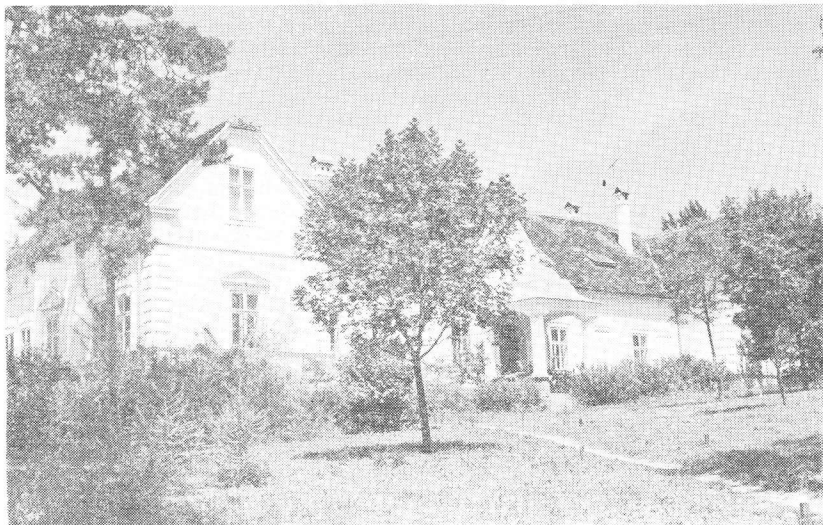
Zgrada Muzeja Moslavine u Kutini

Rad na etnologiji odvijao se u prvoj fazi, osim stalne postave, na prikupljanju i evidenciji pokretnog etno-materijala i obrađivani su podaci za »Etnografske karakteristike Moslavine«. Posljednjih godina pred naletima izgradnje, u selima Moslavine počela je nestajati tradicionalna drevna arhitektura. U prvo vrijeme zaštićeno je nekoliko izrazitih primjeraka kuća »čardaka« a jedan je i otkupljen za onda planirano etno-selo. Nažalost nedostatak materijalnih sredstava prisilio nas je da prolongiramo ostvarenje plana. Sada radimo ubrzano na evidenciji, snimanju i opisu drevne arhitekture. 1973. godine u Voloderu, poznatom vinarskom središtu, u staroj klijeti otvorena je vinogradarska zbirka. Za tu priliku obrađivana je tema o vinogradarstvu i vinogradarskim potrepštinama i klijetima. U radu se etnolozi susreću sa nizom teškoća, i to prvenstveno s pomanjkanjem sredstava za otkup etno-predmeta. Od 1963. godine do tada arheološki sasvim nepoznato područje, počelo se sistematski istraživati. Registrirano je niz arheoloških lokaliteta čime je dobivena slika povijesti Moslavine. Sistematski je iskopavano nekoliko lokaliteta; prethistorijsko naselje Marić-gradina, antička vila rustica u Okešincu, te kasno srednjovjekovni Garić-grad. Slučajni nalazi, sondaža i zaštitna iskopavanja upotpunila su arheološku topografiju, i 1970. godine postavljena je arheološka zbirka. Od materijala treba istaći