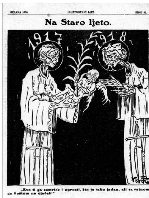
Verešova karikatura sve jače gladi na prijelazu iz 1917. u 1918. godinu ( Ilustrovani list , 52, 29. XII. 1917.)

Slaba obrada zemlje s podbačajem prinosa dovodi do nestašice hrane, osobito masti, brašna, mesa i šećera i u Podravini, pri čemu dakako Zemaljska vlada nije ni pomišljala da pomogne ovom kraju boljom kontrolom proizvodnje i raspodjele, pa je izbijanje afere oko vođenja ekonomije taborišta zaintrigiralo vlasti tek u 1918. godini kada su na vlast došli javni ili tajni simpatizeri Hrvatsko-srpske koalicije. Cijene počinju rasti a novac devalvira i kovnica novca počinje tiskati krune koje svakodnevno gube na vrijednosti. Zbog naglo rastućih cijena industrijske robe zavladao je po selima panika i poljoprivredni proizvodi se više uopće ne nude na slobodnom tržištu, već postaju predmet špekulacije trgovaca i to onih koji su se povezali s ljudima na vlasti.