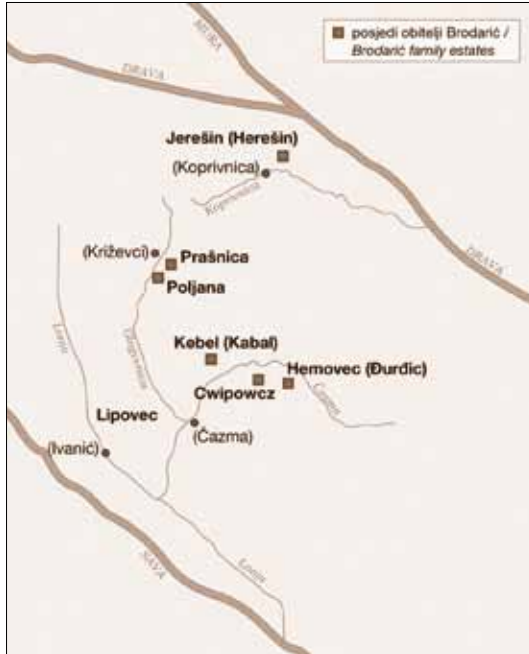
Posjedi obitelji Brodarić Brodarić family estates

identičan današnjem Herešinu. 1 Selo Herešin stanovnici susjednog Peteranca i danas zovu Jerešin.