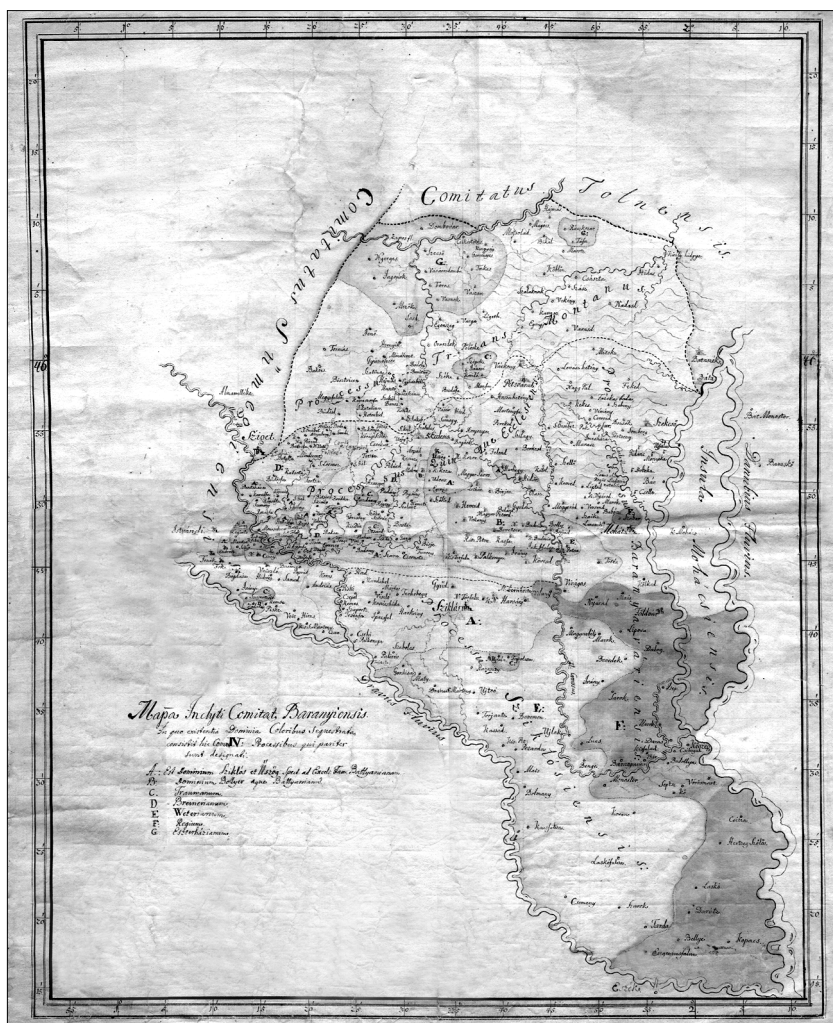
Slika 2: Mappa Incliti Comitatus Baraniensis, rad S. Mikovinyja, oko 1740.

cima koji su sudjelovali u oslobodilačkom ratu. Tako je vojskovođa Eugen Savojski u znak priznanja svojih zasluga dobio imanje od 26 sela u Baranji, koje je nakon njegove smrti 1736. pripalo državnoj riznici i postalo kraljevsko dobro. To imanje karta označuje slovom F i prikazuje kao kraljevsko dobro, što znači da svakako prikazuje stanje poslije 1736. godine. Na karti je, pak, slovom D označeno vlastelinstvo Breinerianum , tj. imanje Siegfrieda Preinera, predsjednika Dvorske komore, koje je nasljednik po ženskoj lozi u siječnju 1743. prodao obitelji Vécsey. 6 Uspoređujući navedene podatke, vrijeme izrade karte možemo datirati u razdoblje od 1736. do 1742. godine; stoga novootkrivenu kartu možemo smatrati najranijom detaljnom i točnom kartom Baranjske županije.