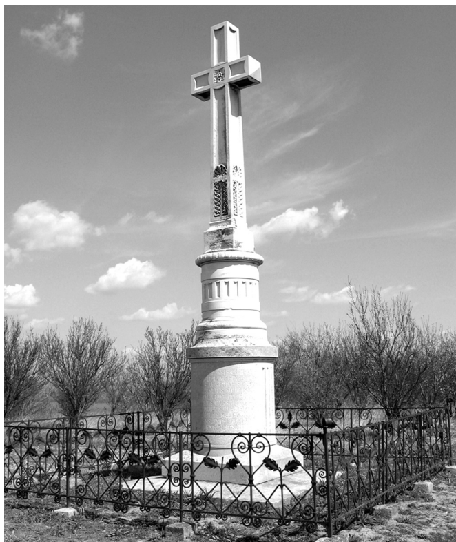
6. Herman Bollé, Spomenik na Vezircu, 1902.