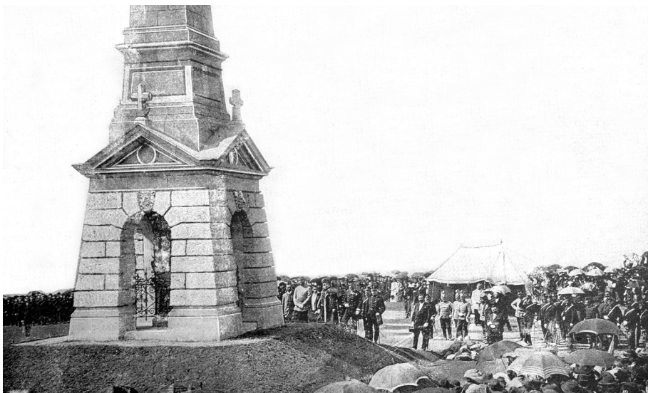
5. Posveta spomenika kod Novog Slankamena, 18. 8. 1892.