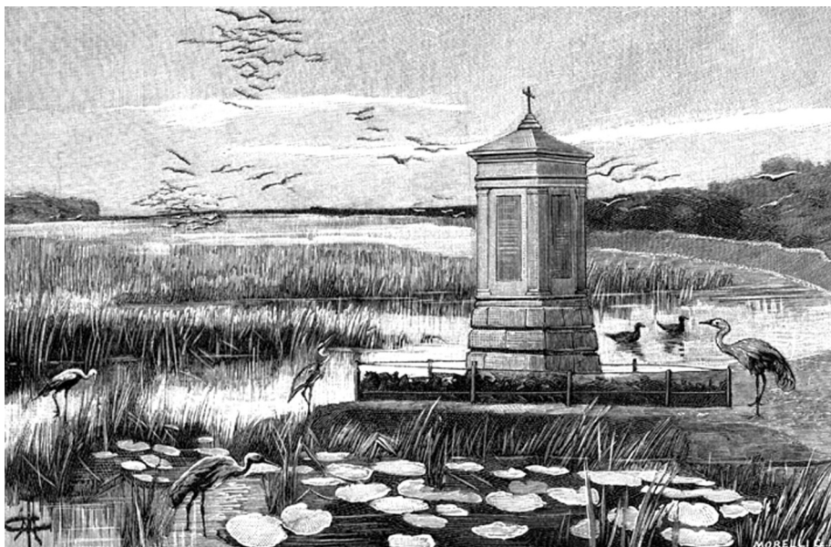
3. Celestin Medović, Spomenik prestolonasljedniku Rudolfu kod Kupinova, 1889-90. Projektiran od strane arhitekta Martina Pilara. Die Österreichisch-ungarische Monarchie in Wort und Bild, Kroatien u. Slavonien (Siebenter Band der Länder der St.-Stephans Krone), Wien, 1902., str. 585.