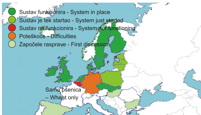
Figure 1 Royalty collection on farm-saved seed in the EU member states