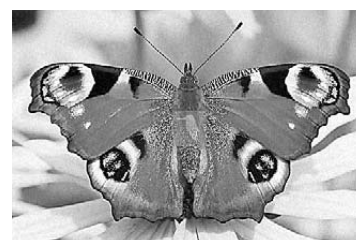
Danje pauče ( Inachis io )