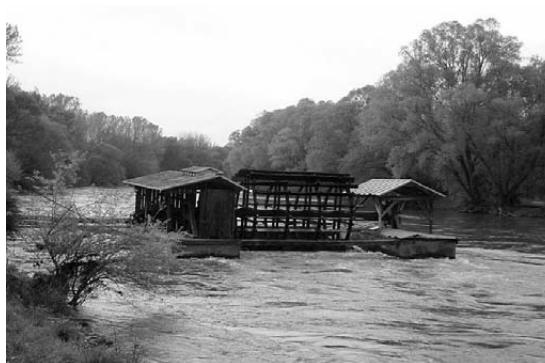
Babičev plivajući mlin na Muri pokraj Veržeja