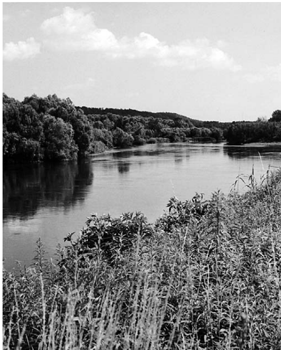
Prizor s Drave kod Legrada

Uz koristi, Drava je činila i velike štete. Gotovo svake godine uzrokovala je zajedno s Murom poplave. Velika poplava uvjetovala je 1710. godine pomicanje korita Drave, tako da je naselje Legrad s njezine lijeve obale »premješteno« na desnu obalu, tj. iz Međimurja u Podravinu.