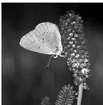
Zagasiti livadni plavac ( Maculinea nausithos )