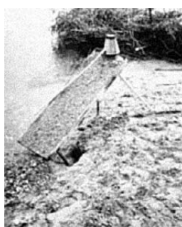
Zlatarska daska sa žajtarom

Obrada zemlje zahtijevala je upotrebu raznih alata, a izrađivali su ih seoski majstori. Iako je poljodjelstvo bilo osnovno zanimanje, relativno rano se javljaju i ostali seoski zanati: lončarski, tesarski, bačvarski, kolarski, kovački, mlinarski, čizmarski, tkalački i mnogi drugi. U životu sela važna je bila prisutnost tkalačkog zanata. Sav posao - od sisanja do tkanja - odvijao se u tradicionalnom autarkičnom gospodarstvu. Za tkanje je služio tkalački stan ili krosna .