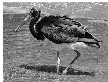
Crna roda ( Ciconia nigra )