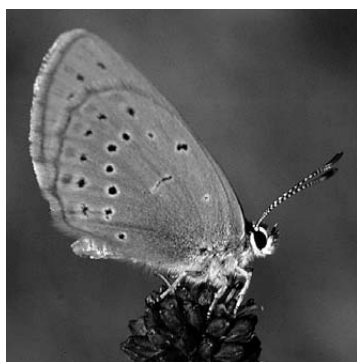
Veliki livadni plavac ( Maculinea teleius )

Obalčar je vrsta kukca koji se u Europi smatra izumrlim, ali na području Mure još obitava, i to u velikim kolonijama. Stanovnik je samo brzih vodenih tokova kao što je Mura u Međimurju. Odrasli kukci izlijeću iz vode u jatima te nakon parenja i odlaganja jaja u vodu ugibaju.