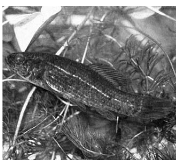
Crnka ( Umbra krameri )

Crnka je jedna od najugroženijih riba u Hrvatskoj i jedna od četiri najugroženije ribe u Europi. Najveći uzrok male populacije te ribe je veliko onečišćenje voda. Živi u stajaćim i sporo tekućim vodama u kojima su uvjeti za život drugih vrsta nepovoljni. Dobro podnosi nedostatak kisika u vodi, pa se za disanje koristi ribljim mjehurom uzimajući atmosferski zrak s površine vode. Može izdržati na vlažnome mjestu i do deset sati bez vode. Pri opasnosti od isušavanja zakopava se u podlogu. Mrijesti se od ožujka do travnja. Ikru polaže na poplavnim terenima među vodenim biljkama, i to u gnijezda koja čuvaju. Spolnu zrelost