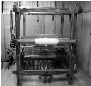
Tkalački stan (nared)

Malo se koji tako mali kraj kao što je Međimurje može pohvaliti tolikim bogatstvom kulturnih institucija, događanja i naslijeđa. Kultura u najširem smislu te riječi, a posebno umjetnost nastala na međimurskom tlu, stoljećima zrcali život stanovništva ovog podneblja i pruža nam, s obzirom na svoju slojevitost, nepresušno vrelo umjetničkih svjedočenja o nama, o vjekovnoj prisutnosti Međimuraca na ovom djeliću zemlje omeđenom dvjema rijekama.