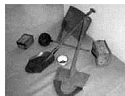
Alat za ispiranje zlata