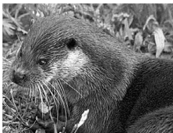
Vidra ( Lutra lutra )

Drava izvire u Italiji i nakon kratkog toka prelazi u Austriju, a zatim u Sloveniju. U Međimurju dotječe kod sela Trnovca i nakon 60-ak kilometara, kod Donje Dubrave, prelazi u Podravinu. Drava je u gornjem toku, uzvodno od Međumurja, planinska rijeka koja obiluje ljetnim vodama. U Međimurju poprima obilježja nizinske rijeke. Bogata je šljunkom i pijeskom (cijenjeni dravski