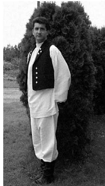
Muška narodna nošnja