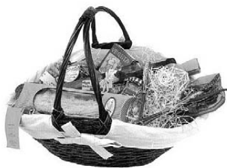
Košara iz Kotoribe

je najveća Muršćak između mjesta Domašinec i Donji Hrašćan.