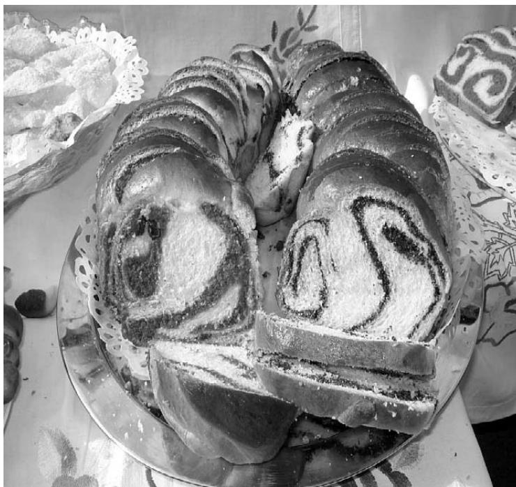
Izložba Dani kruha u Maloj Subotici