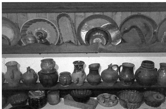
Police za posude (zdelnjaki)

Nužan inventar seoskog domaćinstva je zemljano posuđe koje su izrađivali lončari na nožnom lončarskom kolu. Po obliku i namjeni razlikujemo: štuble - lonce za mlijeko, zdele , rajngle , vajdline za razne domaćinske potrebe, tenjere , tepsije , bidre i vrčeve raznih oblika, putre za vodu itd. Po načinu ukrašavanja razlikujemo keramiku koja je oslikana cvjetnim i geometrijskim motivima te onu bez ukrasa, samo glaziranu. Posebnu vrstu čini keramika samo poškropljena raznim bojama.