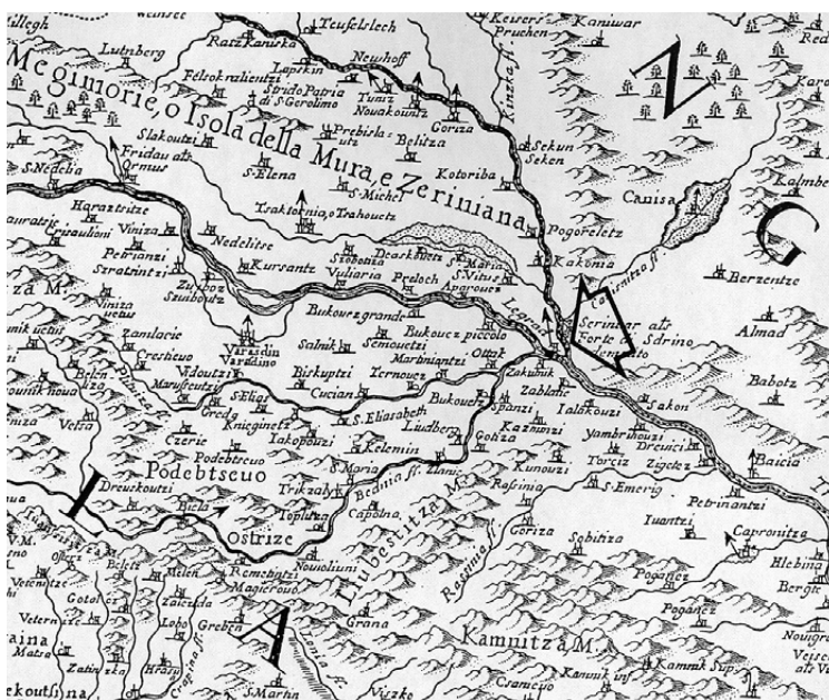
Međimurje i Podravina na karti G. Cantellija iz 1690. godine

Iako izložena velikim demografskim i gospodarskim pritiscima, priroda Međimurja vrlo je dobro očuvana. Pitomi brežuljci Gornjeg Međimurja prošarani su brojnim šumarcima i ekstenzivnim poljoprivrednim površinama (vinogradi, voćnjaci, livade). Ravnicom Donjeg Međimurja dominira kultivirani krajolik koji, pak, obiluje živicama, šumarcima i potocima. Prirodni biser Međimurja