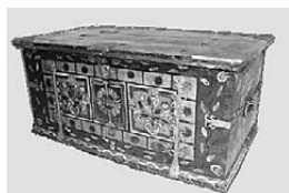
Škrinja za mladence