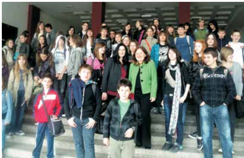
Pupils from Dubovac Primary School visiting the Faculty of Geodesy and the Bošković exhibition

Učenici iz Osnovne škole Dubovac u posjetu Geodetskom fakultetu i izložbi o R. Boškoviću