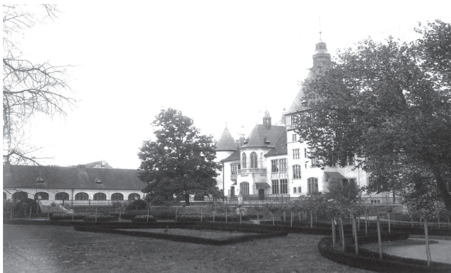
Slika 10. Grof Ladislav Mailath osuvremenio je vrtlariju, sagradio novi dvorac i park preoblikovao u historicističkom slogu 1910. g.

Nasljednik baruna Gustava Hillepranda von Prandaua bio je sin njegove kćerki Štefanije grof Ladislav Mailath (1862. - 1936.). Grof Mailath bio je praktičar i inovator. U vrtlariju i cijeli perivoj uveo je električnu struju, osuvremenio alate i poboljšao kvalitetu rada. Bio je veliki prijatelj s carem Franjom Josipom I. i prestolonasljednikom Ferdinandom. 22 Nastavio je kontinuitet održavanja izložbi cvijeća, a njegova žena Ilona najviše je voljela ljubice. Vrtlarija je tijekom cijele godine uzgajala mirisavo cvijeće, a glavni vrtlar Buzashy donosio je grofici stručkove ljubica svaki dan. Grof Mailath i njegova supruga pobjegli su pred zelenim kadrom 1918. i tada formalno prestaje i rad vrtlarije. 23 (Sl. 10)