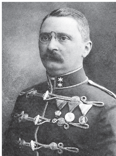
Slika 2. Grof Ladislav Mailath