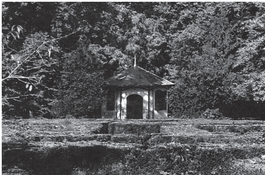
Slika 6. Paviljon koji je nekada imao drvenu verandu i na koji se naslanjala kuglana; 2003.

đen veliki staklenik. 12 (sl. 3, 4, 5) Iako se zbog loše očuvanosti dokumenta ne može točno ustvrditi da je tip staklenika koji se i danas nalazi u perivoju u Miholjcu tada naručen od Stolberger Glasshutzen - Akt. Ges. iz Stolberga, 13 evidentna je njihova ponuda. No, u to su vrijeme bili najviše u upotrebi modlinški staklenici i prema pisanju časopisa Školski vrt i njegovoj fotodokumentaciji, staklenik u Miholjcu svojim izgledom odgovara modlinškom tipu staklenika. Napredak vrtlarija postiže u vrijeme kada je njezin glavni vrtlar Ivan Hübsch, 14 "gosposkijski umjetni vrtlar u Donjem Miholjcu", a od 1886. i ovlaštenu nadzornik školskih vrtova. 15 Godine 1885. iz Nürnberga u pomoć g. Hübschu dolazi poznati vrtlarski majstor Ernest Flemminger, a 1889. u radu vrtlarije spominje se i vrtlar Rudolf Gratze. 16 U to vrijeme održavale su se česte izložbe cvijeća, i to u samom stakleniku i velikom perivoju tj. matičnjaku, u Osijeku, Beču i drugim gradovima Monarhije. Ivan Hübsch spominje mnoge nove kultivare te možemo zaključiti da su u vrtlariji radili vrhunski kalemari i vrtlari.