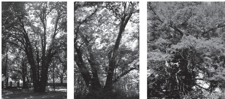
Slika 11, 12, 13. Detalji sačuvanih biljnih vrsta vrtlarije danas