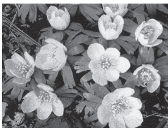
Sl. 16. Relikt iz doba tercijsara, Eranthis hyemalis , 2003. g.

Kao povijesna gospodarska grana koja je Donji Miholjac i njegovo vlastelinstvo proslavila diljem Monarhije, vrtlarija obitelji Prandau-Mailath ima iznimnu važnost te bi je trebalo obnoviti. Povijesnih predložaka ima dovoljno, a danas u okolici D. Miholjca ima obitelji koje su tradiciju uzgoja ukrašnjog drveća, grmlja i cvijeća sačuvale i njeguju je još i danas. Grad Donji Miholjac ulaže velike napore i sredstva u zaštitu i obnovu perivoja i dvorca, te je obnovu staklenika i rasadnika moguće očekivati u sljedećih šest godina. Kao najveća zanimljivost ostaje istražiti kako je titra ozimica ostala sačuvana u travnjacima perivoja i vrtlarije, a do danas se nije proširila na okolna staništa. (sl. 16)