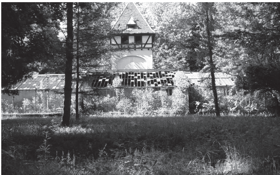
Slika 3, 4, 5 - Staklenik građen 1872. g. u vrtlariji u Donjem Miholjcu, snimljen oko 1900. g. i danas

“cultifrisisa” Matiju Šokca, 9 a 1841. ima i svog “sodalis hortulani dominantis” gospodina Ignaciusa Mansina. 10 Godine 1849. nalazimo podatak da je u vrtlariji zaposleno sedam školovanih vrtlara. 11 No uzgoj ukrasnog cvijeća, drveća i grmlja u većem opsegu počinje tek 1872. g. kada je u perivoju izgra-