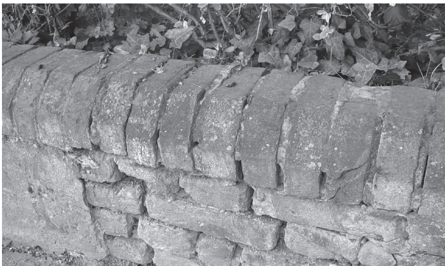
Slika 7. Ostaci osmerokutnih šupljih opeka u zidiću ograde vrtlarije i perivoja

Uz paviljon se nalazi natkrita kuglana. Nadalje autor piše: ”Park krasi brojne statue i ima posebno četiri bunara koji djelomično služe za njegu parka, a djelomično pitku vodu u domaćinstvo vode. Cijeli park je ograđen i to 580 m zidanim stupovima i letvama, 374 m drvenim stupovima s prečkama i ‘tarabama’ te 476 m živicom.” Ističe i da je osim toplih staklenika i kljajališta perivoj imao i grijane travnjake. Sustav grijanja travnjaka bio je moguć radi nekoliko bunara u kojima je izvirala vruća, termalna voda. Ostaci osmerokutnih šupljih opeka još su i danas prisutni u perivoju i sustav grijanja mogao bi se rekonstruirati. (sl. 7)