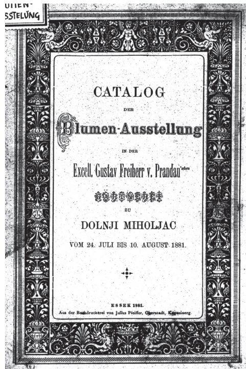
Slika 9. Katalog izložbe održane u vrtlariji u D. Miholjcu 1881.

i školskih uputa za vrtlarske radionice. Pisane stručne članke I. Hübscha često nalazimo u stručnim časopisima kao što je Školski vrt . Ovaj je katalog iznimno važan i zato jer je pisan kao predložak izložbe, te je jedini dokument popisa biljnog materijala u vrtlariji u Miholjcu iz spomenute godine. Radi iznimnog broja vrijednih biljnih vrsta želja nam je u sljedećem radu vezanom uz vrtlariju Prandau-Mailath potanko ga i stručno obraditi, te ga objaviti u cjelini. Vezano uz to, želja nam je i proširiti povijesno istraživanje poznatih vrtlarija u tadašnjem austrougarskom carstvu s ciljem dokazivanja da je miholjačka vrtlarija obitelji Prandau-Mailath bila jedna od vodećih i najcijenjenijih čak čitava dva stoljeća. Veliki opus stručne literature koja se mahom odnosi na uzgoj i oplemenjivanje bilja sačuvano je do danas u biblioteci Prandau koju je naslijedila obitelj Norman, te se u Muzeju Slavonije i Baranje, gdje se danas čuva, vodi pod imenom “Normanova”. Na žalost, ona nije bibliografski i arhivski do kraja obrađena i još nije moguć pristup spomenutoj građi, koji bi omogućio njezino detaljno istraživanje. No, vrijednim radom Marine Vinaj, ona će ubrzo biti istražena.