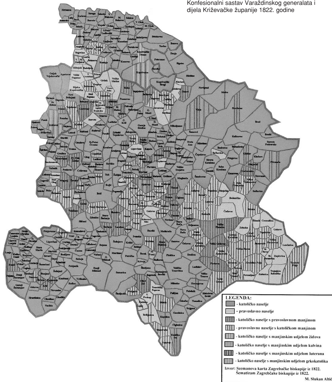
Konfesionalni sastav Varaždinskog generalata i dijela Križevačke županije 1822. godine