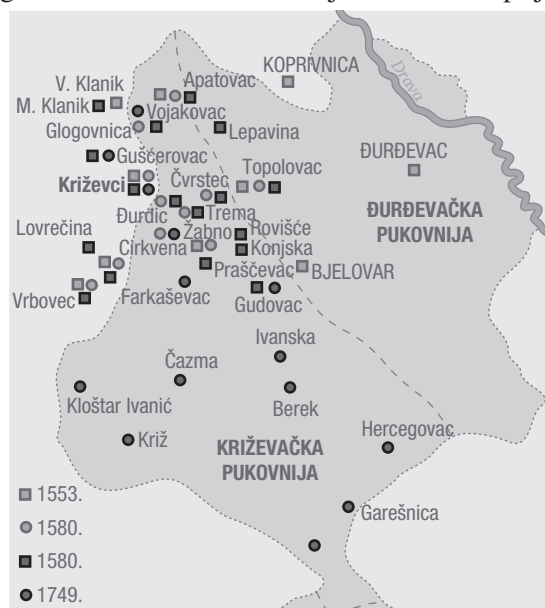
Slika 1: Slika pokazuje razvoj Križevačke pukovnije 1553. - 1749. godine