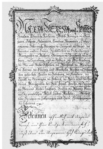
Slika 2: Cehovska povelja Bjelovara iz 1770. godine

Početak bjelovarskog školstva vidimo netom poslije osnivanja 1756. godine i izgradnje grada jer se već u njemu nastanjuju časnici s obiteljima te se javlja potreba školovanja djece. Ubrzo iz Austrije dolaze braća Ignjat i Hubert Diviš, iz pijarističkog reda, 24 sve u znaku devize carice Ma-