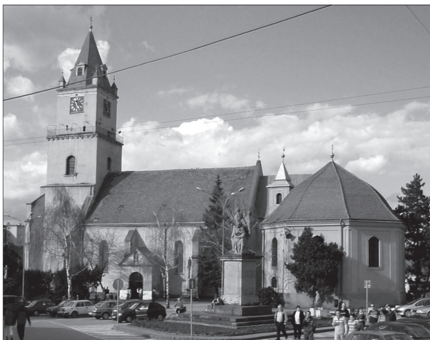
4. Hlohovec, župna crkva sv. Mihaela.