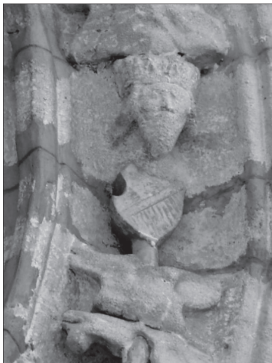
7-8. Hlohovec, župna crkva sv. Mihaela, detalji portala.