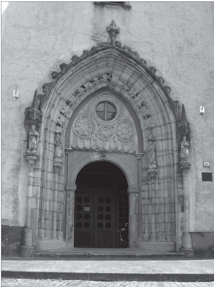
6. Hlohovec, župna crkva sv. Mihaela, portal.