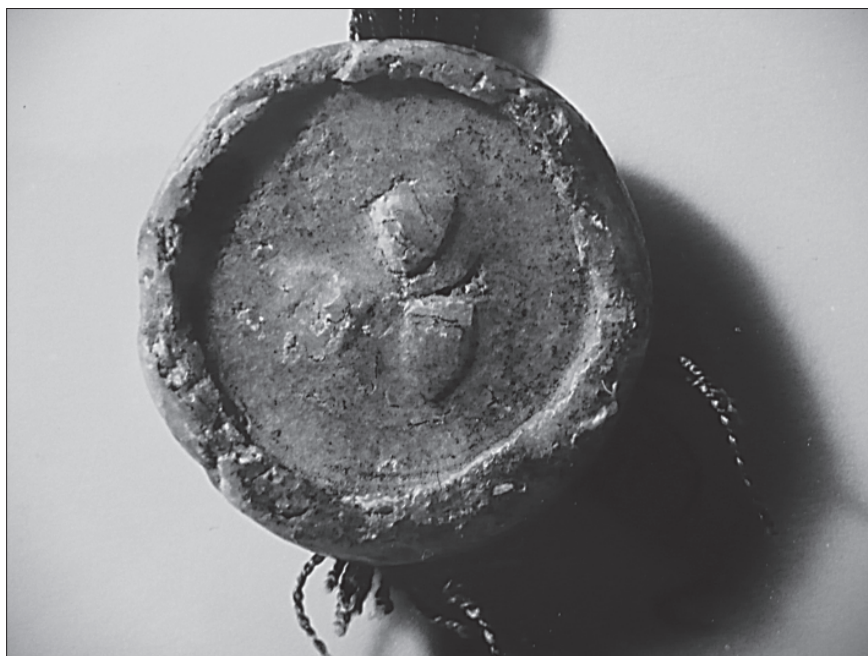
10. Pečat uz listinu palatina Nikole Konta od 15. svibnja 1364.