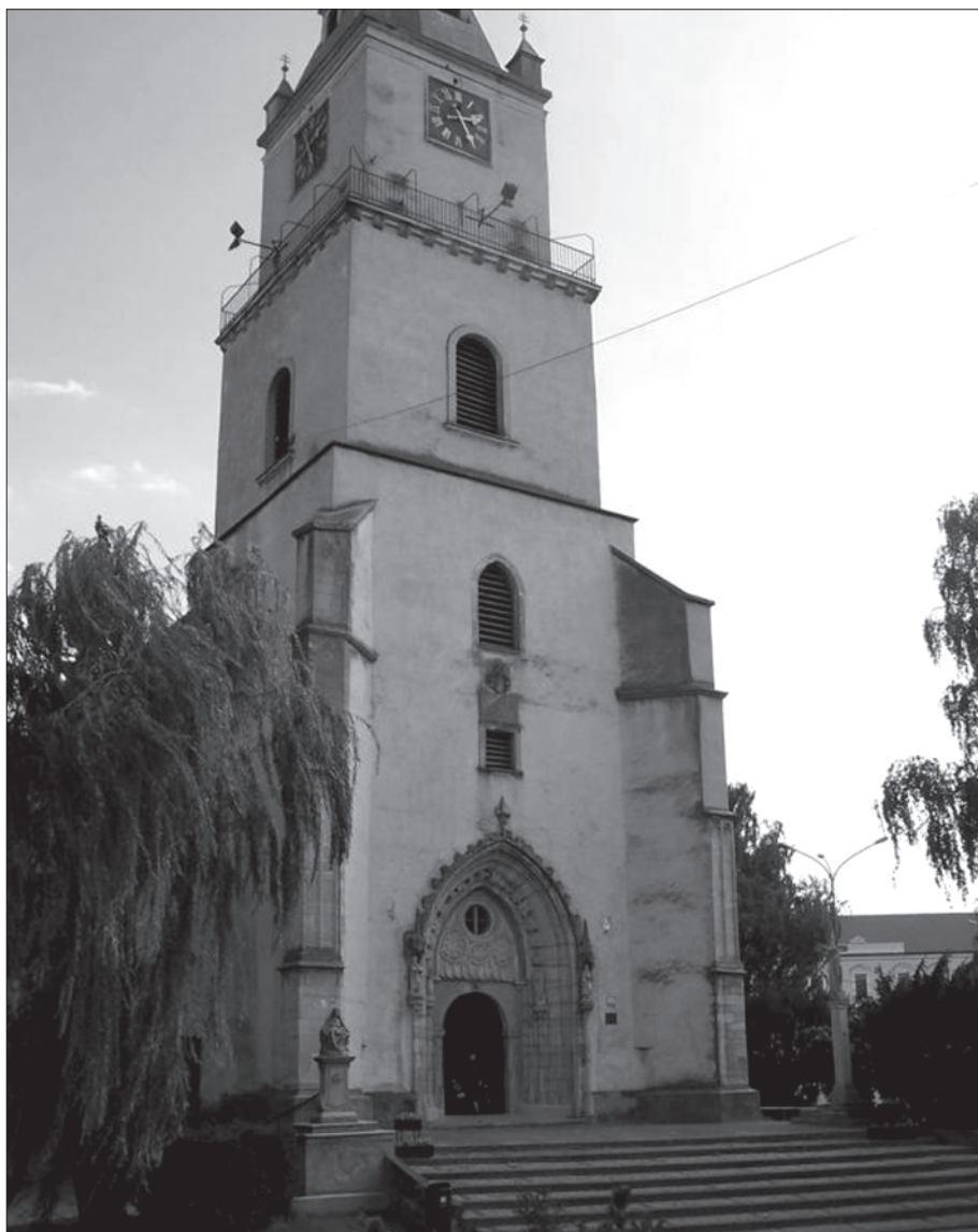
5. Hlohovec, župna crkva sv. Mihaela, pročelje.