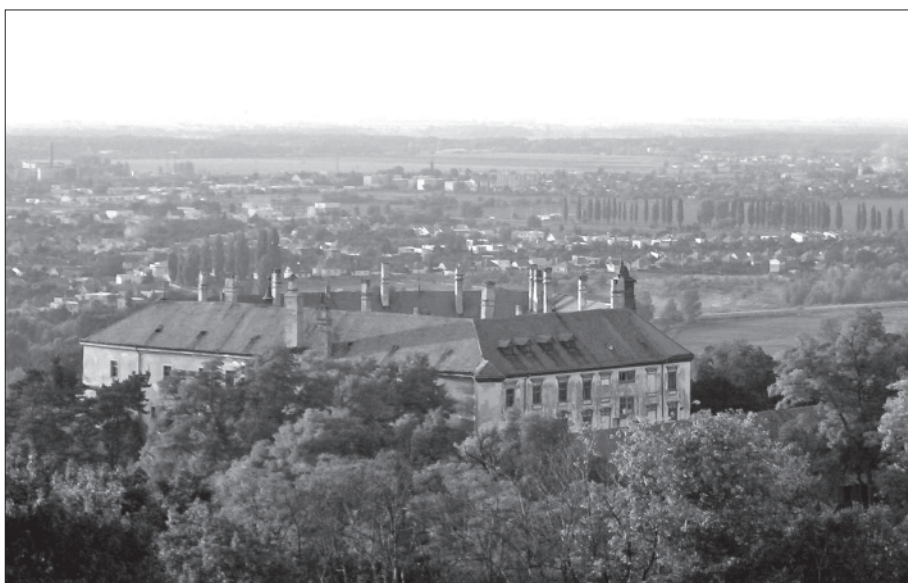
2. Hlohovec, utvrda i dvorac (obnovljeni u 18. stoljeću).