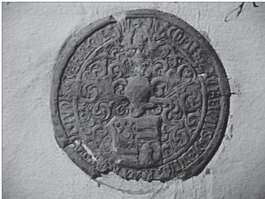
11. Pečat uz listinu Lovre Iločkog od 17. lipnja 1520.