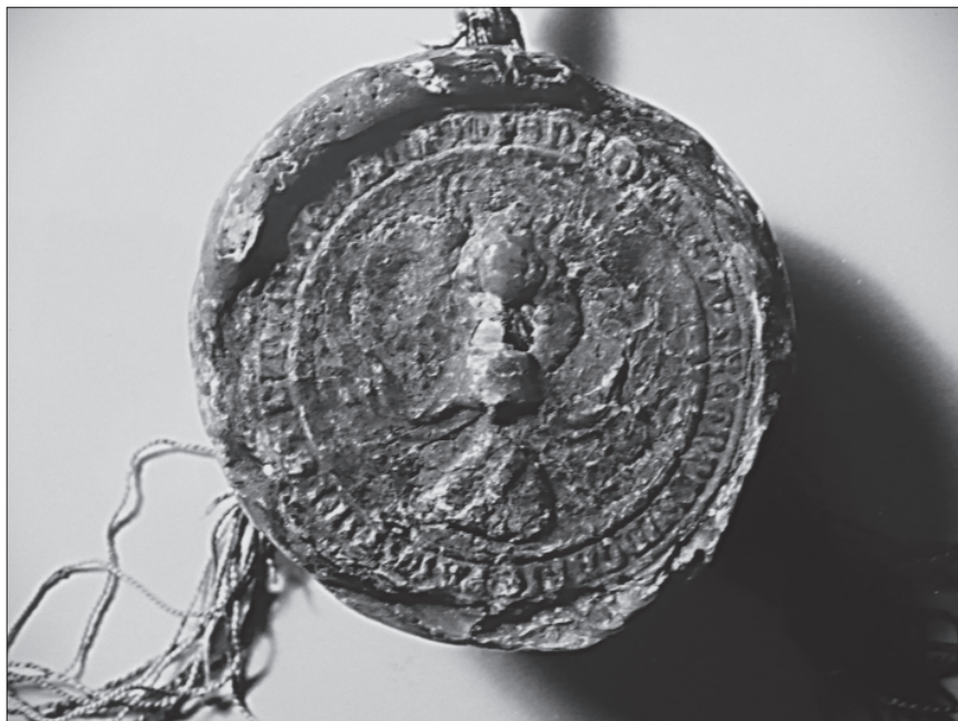
9. Pečat uz listinu palatina Nikole Konta od 27. svibnja 1359.