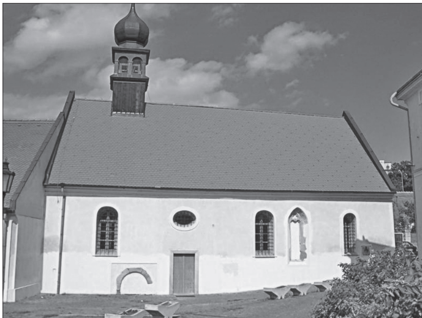
3. Hlohovec, kapela hospitala Sv. Duha.