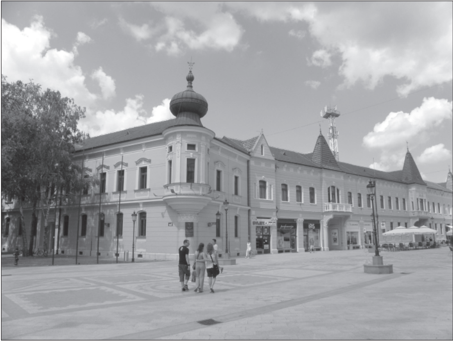
7. Stambeno-poslovna zgrada Brodske imovne općine, današnje stanje, Ulica kralja Zvonimira br. 1-3