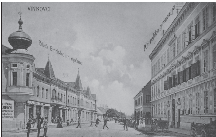
2. Uredovnica i stambeno-poslovna zgrada Brodske imovne općine nedugo nakon dovršetka restauracije i gradnje, danas Trg bana J. Šokčevića br. 20