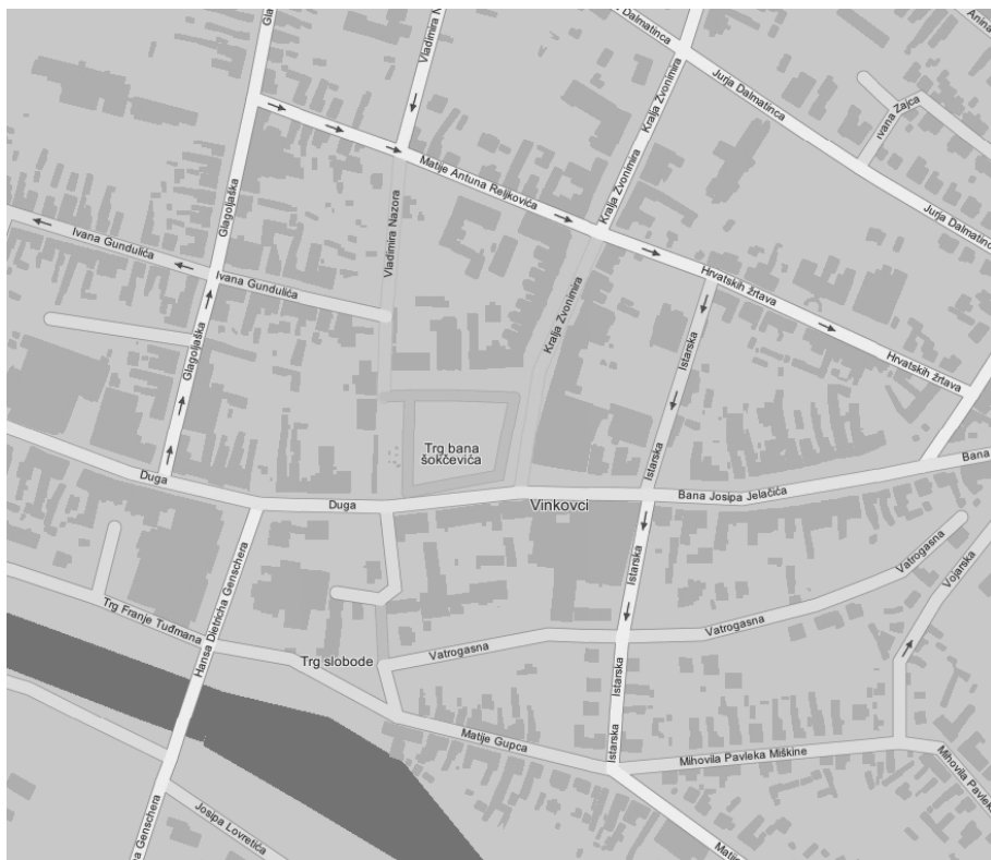
8. Plan središta Vinkovaca. Na uglu Trga bana Šokčevića i Zvonimirove ulice nalaze se zgrade nekadašnje Brodske imovne općine; ilustracija prema: www.t-portal.hr