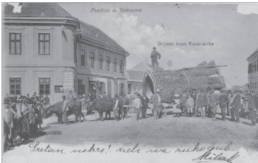
1. Uredovnica Brodske imovne općine prije Bolléove restauracije, oko 1900. godine, danas Trg bana J. Šokčevića br. 20