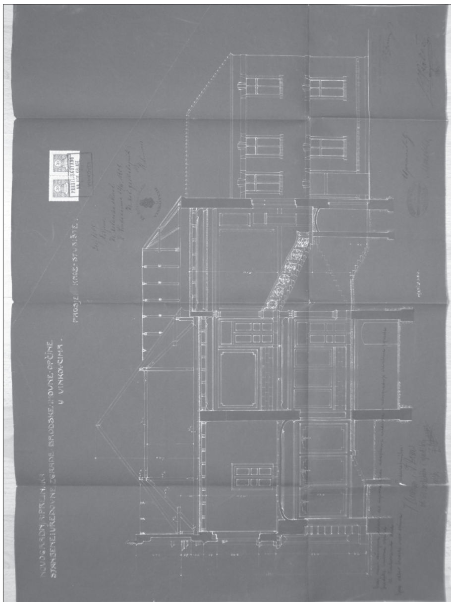
3. Herman Bollé, Presjek uredovnice Brodske imovne općine, 1907.; DAV (Državni arhiv u Vukovaru), ASCV (Arhivski sabirni centar Vinkovci), fond br. 1204, BIO, kutija br. 97., građevinski spisi