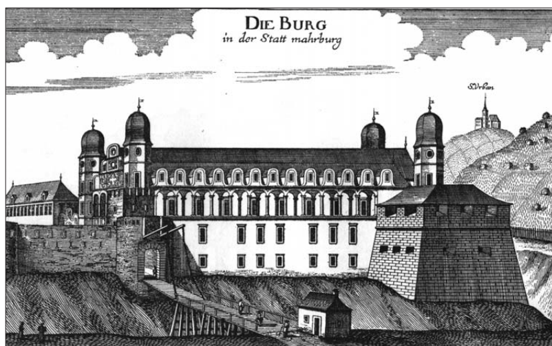
Mariborski mestni grad leta 1681, G. M. Vischer: Topographia Ducatus Stiriae, Gradec 1681