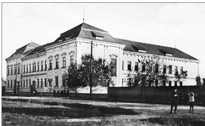
Nova školska zgrada Više pučke škole u Virovitici