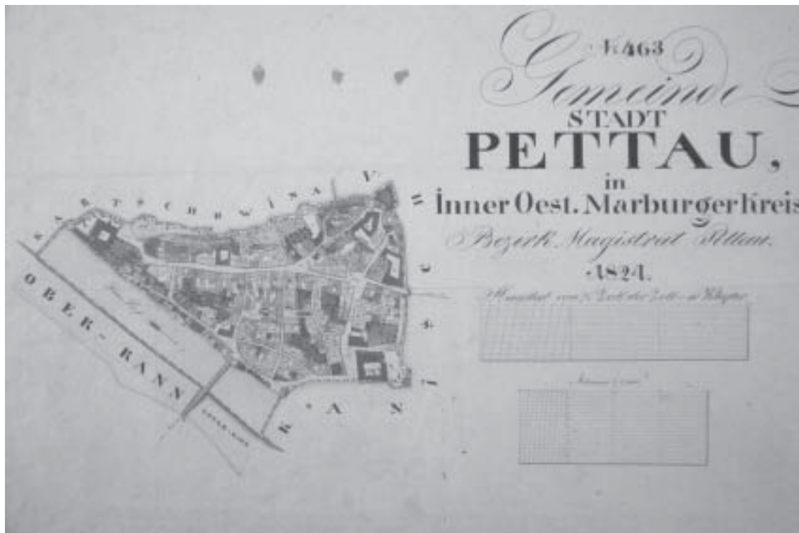
Franciscejski kataster Ptuja iz leta 1824, na katerem vidimo potek mestnega obzidja

njegove izdelke. V 16. stoletju so omejili zaradi turških vdorov trgovino z Ogrsko, kljub temu je Ptuj obdržal svoje mesto pri trgovini z velikimi razdaljami. Drave niso uporabljali za prometno pot samo v mirnodobnem času, temveč tudi v obdobju vojn s Turki. Namesto z običajnim prevozom po cestah, so po Dravi prevažali s šajkami 3 vojsko, proviant, orožje in strelivo. Šajke so rabile za prevoz vojske ter tudi za zvezo med poveljstvom in vojsko. Bile so zelo hitre po reki navzdol. Med letoma 1684 in 1687 so prepeljali po Muri in Dravi na leto 300 splavov in šajk s približno 3000 do 4000 ton provianta in vojnega materiala na operacijska območja vzhodno od Virovitice in Siklosa. 4