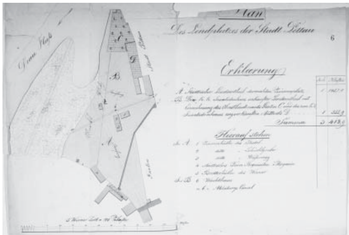
Načrt ptujskega mestnega pristana iz leta 1841 (ZAP, AMP, šk. 15)