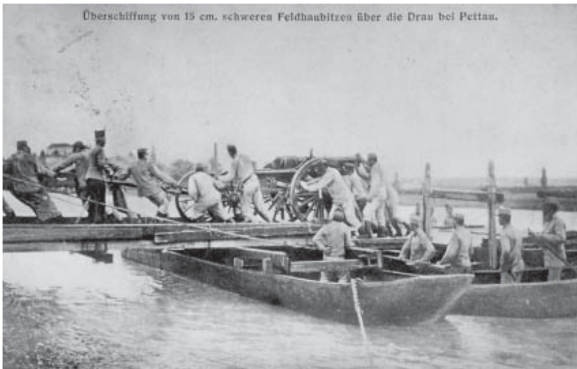
Ptuj, spravljanje težkega orožja prek pontonskega mostu, razglednica poslana 1913

monarhiji. 3. poljski topniški polk iz Radgone je imel od 15. julija do 3. septembra 1879 strelske vaje z dvanajstimi topovi uhatzius. Tabor so imeli na Hajdini. Vsak teden je prišla na vaje tudi druga baterija 12. in 16. topniškega polka iz Ljubljane, Gorice, Trsta, Zagreba, Karlstadta, Radgone, Straža in Gradca. Septembra 1896 je bil veliki cesarski manever v Čakovcu. Od 9. septembra dalje so se na Ptuju zbirale vojaške enote, ki so odpotovale od tu na manevre 14. in 15. septembra. V ozkem prostoru od Hajdine do Krčevine - Spuhlje je bilo nastanjenih 16 bataljonov, 6 eskadronov, 32 topov, 9960 mož in 1425 konj. S Ptuja je odšel na manevre 4. pionirski bataljon.