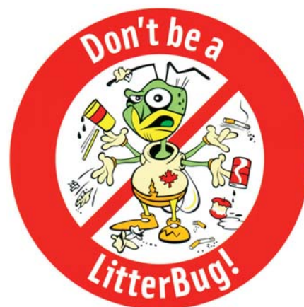
SLIKA 1 – Bacanje smeća u okoliš društveno je neprihvatljivo ponašanje 4

je životinje, omotava se oko grana stabala, gomila se na tlu i ne raspada se. Bacanje smeća u okoliš društveno je neprihvatljivo ponašanje (slika 1) koje nema veze s vrstom materijala i ne smije biti poticano propagandom kako će takve vrećice u okolišu jednostavno nestati . Proizvođači i potrošači plastičnih proizvoda s oksododatcima 1 koriste se tim argumentima i time griješe u svojim pokušajima širenja tržišta u Europi. Trgovački lanac Tesco oksorazgradljive vrećice povukao je iz svojih trgovina (nakon što su kupcima podijeljene dvije milijarde komada) zbog njihovih negativnih utjecaja na okoliš. 3