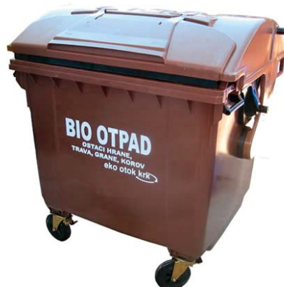
SLIKA 2 – Antimikrobni PE-HD spremnik za biootpad 6

Biorazgradljive plastične vrećice nisu rješenje za problem otpada, ali su važan proizvod za or-