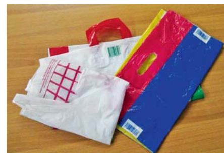
SLIKA 3 – Koje je mjerilo koje odvaja jednokratne od višekратно vrećica?

gansku obradu otpada. Polietilenske vrećice na bioosnovi odlično su rješenje za uspostavljanje programa recikliranja plastike. U svim pravilnicima definicija vrećica velik je izazov: koje su to jednokratne plastične vrećice, koje su ponovno upotrebljive, koje su to cjeloživotne vrećice? U talijanskoj i španjolskoj pravnoj regulativi jednokratne plastične vrećice nisu jasno definirane. Poznato je da se vrlo tanke vrećice s ručkama kao integralnim dijelom vrećice rabe samo jedanput prije nego što se iskoriste kao vrećice za smeće, dok se vrećice s ručkama ili s izrezanim rupama za nošenje (deblje vrećice) primjenjuju više puta (slika 3). Koje je mjerilo koje odvaja jednokratne od višekратно vrećica?