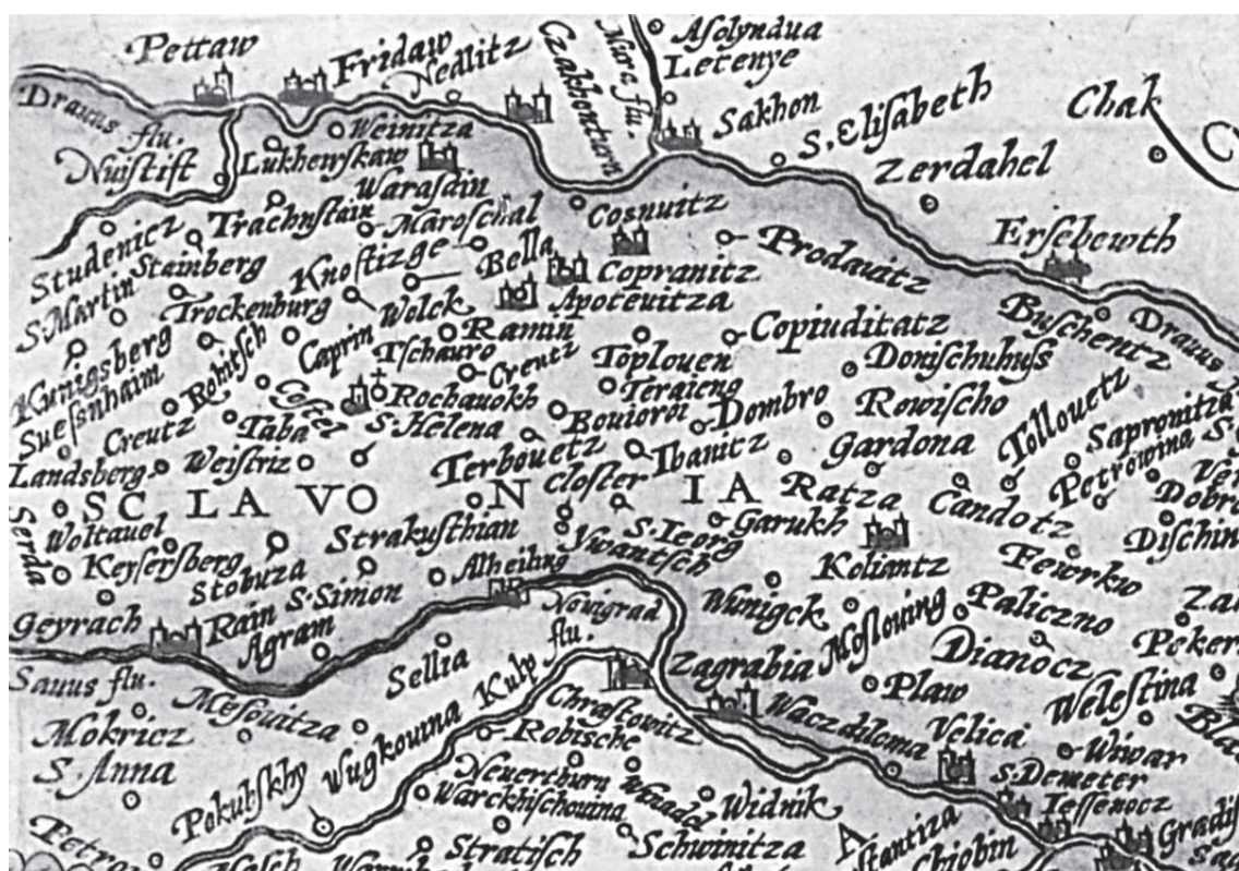
Dio zemljovida sjeverozapadne Hrvatske s kraja 16. stoljeća