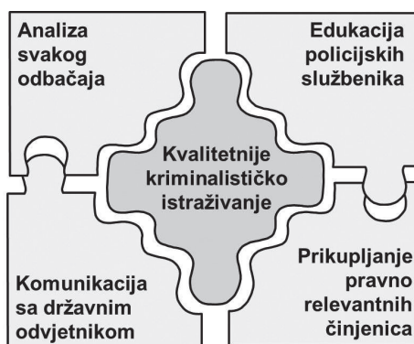
Slika 2: Čimbenici kvalitete kriminalističkog istraživanja

Broj odbačaja u svezi sa spomenutim razlogom potrebno je analizirati i uspoređivati u odnosu na ukupan broj prijavljenih kaznenih djela. Podsjećamo da prema prikupljenim podacima iz tablice 7 ovaj razlog po redosljedju zauzima treće mjesto sa 11 520 odbačenih prijava ili 13,41% od ukupno odbačenih prijava. Radi se o visokoj zastupljenosti odbačaja iz razloga što prijavljeno djelo nije kazneno djelo. Ti podaci ukazuju kako bi bilo potrebno razmotriti opravdanost podnošenja tih prijava, odnosno utvrditi koji su razlozi krivim procjenama kako je počinjeno kazneno djelo iako državni odvjetnik kroz odbačaj kaznene prijave ima drugi stav (Krapac, Novosel, 2010:164).