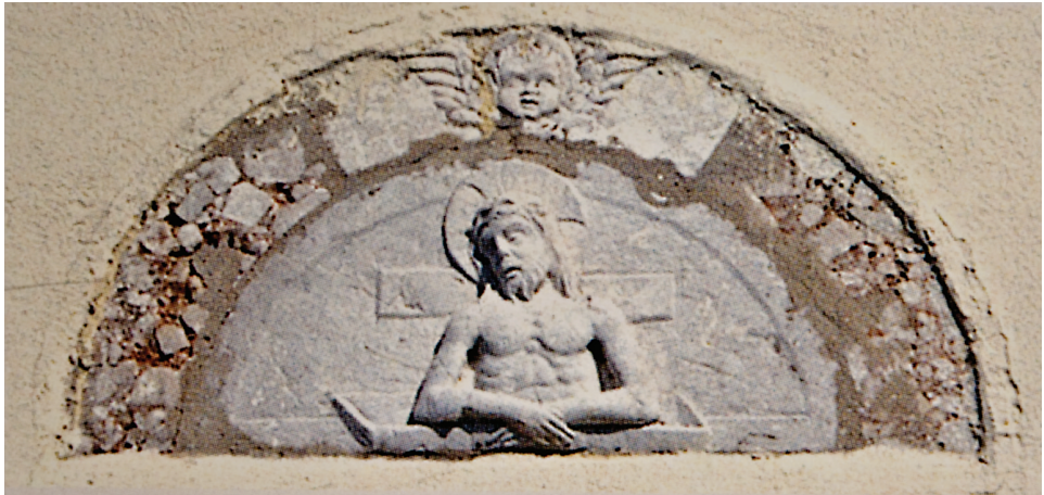
9. Reljef Krista »imago pietatis«, početak 16. stoljeća, svetište crkve Uznesenja B. D. Marije u Crikvenici, presnimak iz vodiča Župnog ureda spomenute crkve iz 2005. godine.