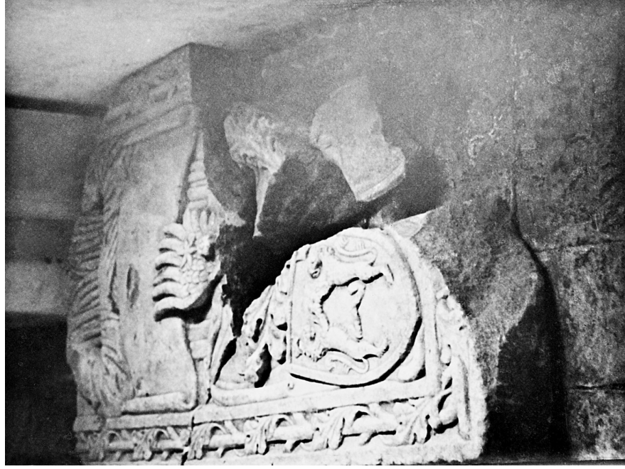
2. Ulomak nadgrobne ploče s frankopanskim grbom, prvo ili drugo desetljeće 16. stoljeća, snimio dr. Zorislav Horvat, presnimak.