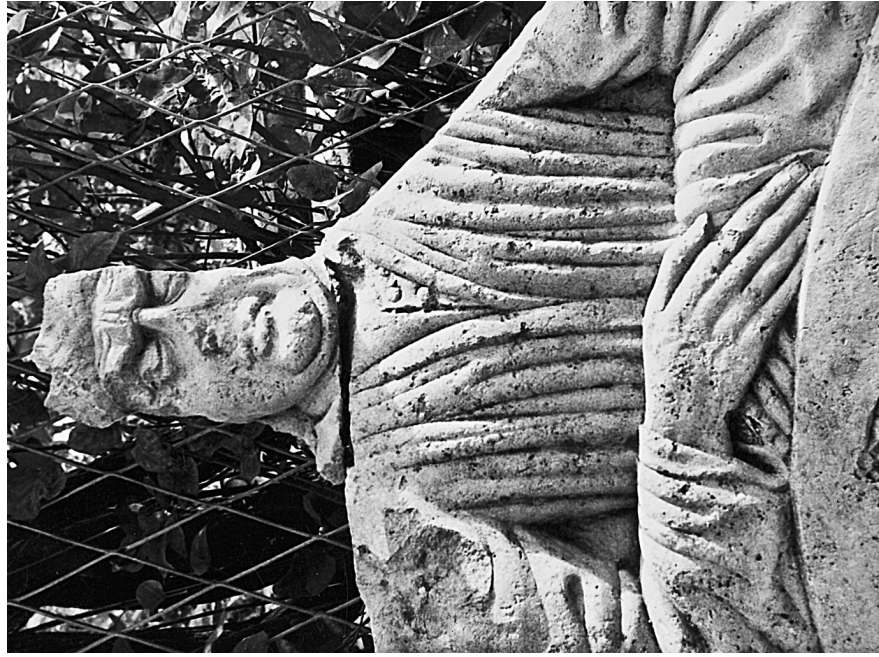
1. Ulomak nadgrobne ploče Stjepana II. Frankopana /1416.— 1481./, prvo ili drugo desetljeće 16. stoljeća, Zavičajni muzej Ogulin, snimio dr. Milan Kruhek. Presnimak.