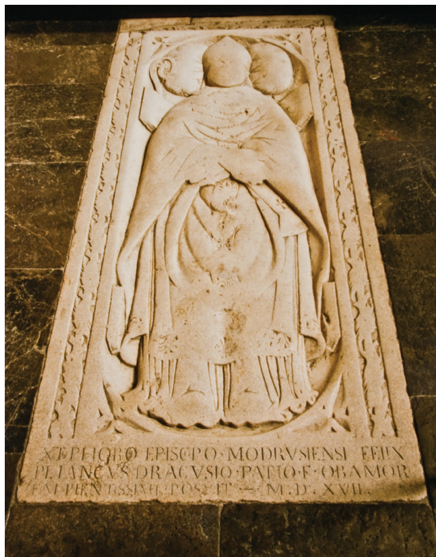
3. Nadgrobna ploča modruškog biskupa Krištofora /† 1499./, ploča iz 1517. godine, župna crkva ss. Filipa i Jakova, Novi Vinodolski, snimio Zoran Bogdanović, Ministarstvo kulture, Konzervatorski odjel u Zagrebu, presnimak.