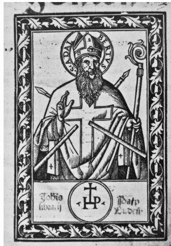
11. Sv. Adalbert, drvorez, iz Missale Strigonense tiskan u Veneciji 1511. godine, Katalog des Niederösterreichischen Landesmuseums, Neue Folge Nr. 118, Wien, 1982., »Matthias Corvinus und die Renaissance in Ungarn 1458–1541.«, Schallaburg, 1982., 556, sl. 619., presnimak.