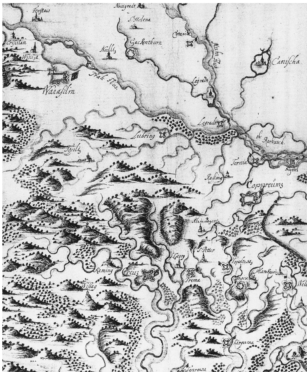
Karta dijela Podravine, istočnog Međimurja i jugozapadne Mađarske na karti Martina Stiera iz polovice 17. stoljeća

Preko Koprivnice su stizale obavijesti iz okupiranih hrvatskih krajeva u Osmanlijskom Carstvu, 94 ali i otud stižu vijesti o pripremama nove vojne, o novačenju u Bosni 1680. godine. 95 Iste je godine iz Koprivnice došla i vijest o pojavi kuge, ali i o upadima osmanlijskih pljačkaških jedinica u Križevačku krajinu i o mogućim skorim vojnim pohodima. 96 Preko Koprivnice je Ibrišimović putovao u Beč, 97 a