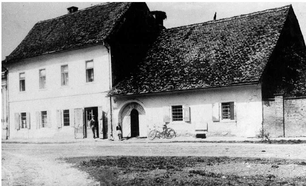
Kuća poznate trgovačke obitelji Tottar u Virju (gore) i zdanje poznatog Peršičevog mlina u Virju (dolje)

TVORNICA STROJEVA I PODUZEĆE ZA GRADNJU MLINOVA G. LUTHER A.-G. BRAUNSCHWEIG