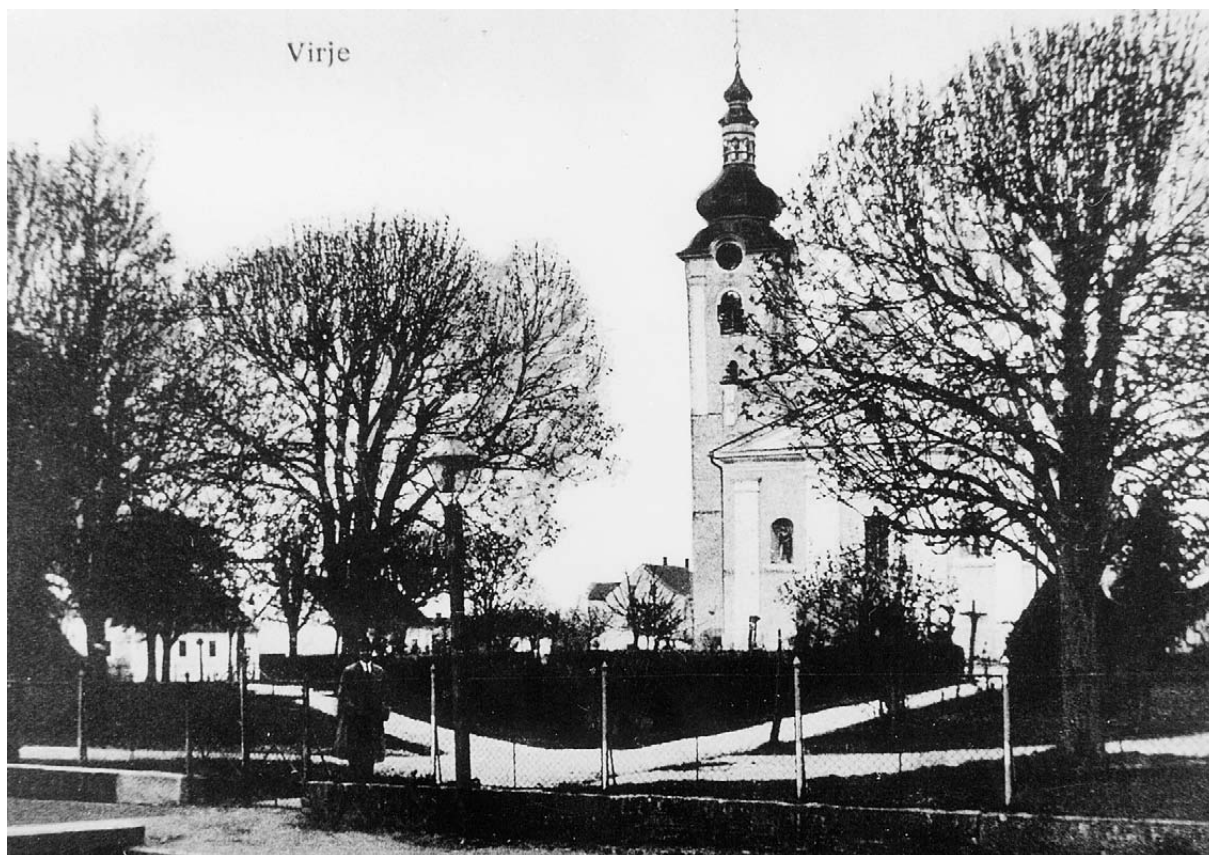
Župna crkva Sv. Martina u Virju nalazi se u parku u središtu mjesta (snimljeno između dvaju svjetskih ratova, gore), te jedna od tipičnih virovskih ulica (Mitrovica) iz prve polovice 20. stoljeća (dolje)