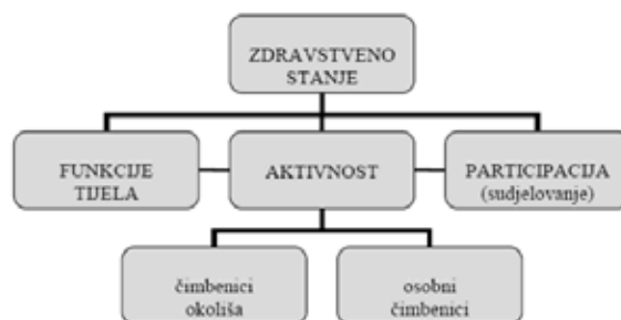
Slika 1. Model invaliditeta zasnovan na ICF klasifikaciji

ICF klasifikacija omogućuje ekonomsku analizu i planiranje za učinkovitu prevenciju ograničenja u aktivnostima i smetnjama u ravnopravnom sudjelovanju osoba s poteškoćama. Invaliditet treba promatrati biološki s obzirom na poznati tijek bolesti ili posljedice ozljede, ali i sa socijalnog aspekta kojim se prilagođava okolina i daje pomoć invalidnoj osobi kako bi mogla ravnopravno sudjelovati u svim aspektima života.