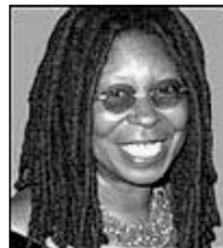
Slika 2. Primjeri slavni i uspješni ljudi koji su premostili svoj invaliditet (Ludvig van Beethoven, Albert Einstein, Stephen Hawking, Franklin Roosevelt, John Forbes Nash, Woopi Goldberg)