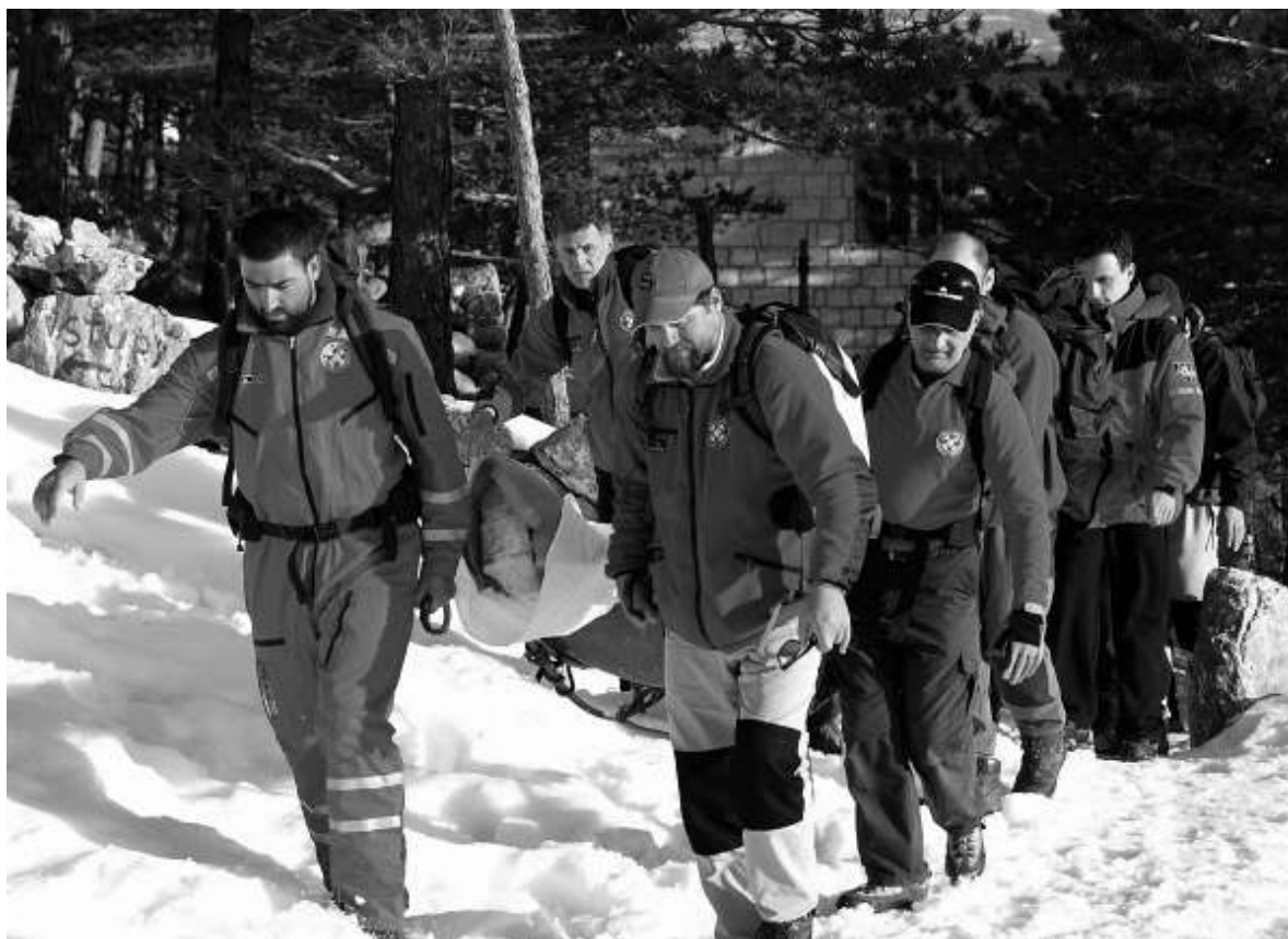
Slika 2: Akcija spašavanja članova HGSS-a unesrećenog planinara u zimskim uvjetima

Podatke iz tablice 3 i 4 treba promatrati i razumijevati na način da oni prikazuju vrijeme/ mjesec i dane, u kojima je započeto izvođenje pojedine vrste akcija. Svakako da najviše ljudskog potencijala i materijalnih resursa zahtijevaju potražne akcije. Među dugotrajnim potragama je i ona organizirana za nestalim planinarom 2004. godine na Mosoru, koji je, kako se kasnije ispostavilo, počinio samoubojstvo. Potraga je trajala 44 dana, a gotovo svakog dana netko od članova HGSS-a bio je na terenu, pored policijskih službenika, vojnika, vatrogasaca, planinara, rodbine te helikoptera i potražnih pasa koji su bili angažirani u pretraživanju prostora. Statistički gledano, u 2004. godini, u prosjeku po skijaškoj akciji sudjelovalo je 3,4 spasitelja; u akcijama spašavanja 5 spasitelja; a u potražnim akcijama bilo je angažirano preko 10 spasitelja HGSS-a po jednoj akciji traganja . (Dujmić, 2004:3)