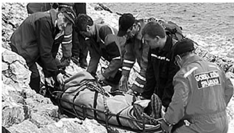
Slika 3: Spašavanje nestale osobe

U tablici 7 analiziramo državljanstvo, odnosno zemlju prebivališta zbrinute osobe u neskijaškim akcijama (NSA). Izvor statističkih podataka nije nam omogućio detaljnu analizu za potražne akcije (PA), ali analizom slučajeva uočeno je kako rastom broja turista, posebno onog u svezi tzv. avanturističkog turizma , sve više raste udio stranih državljana u neskijaškim akcijama HGSS-a. Tako je udio zbrinutih stranih državljana u 2003. godini bio 24,85% od ukupnog broja zbrinutih osoba u neskijaškim akcijama, a 2004. godini taj broj se povećao na gotovo jednu trećinu od ukupnog broja zbrinutih osoba.