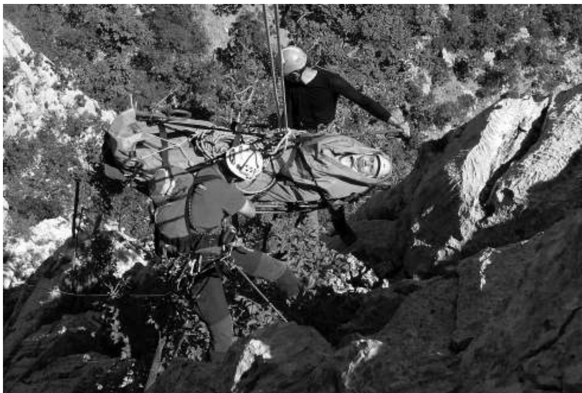
Slika 4: Vježba članova HGSS-a glede spašavanja u planinama

Zaključno, smatramo kako smo čitatelju uspješno prikazali sve one kvalitete, načine i postupke stjecanja znanja i vještine te izvrsnu kompetentnost u spašavanju i traganju za nestalom osobom u planinama, stijenama, speleološkim objektima, vodenim površinama, na nepristupačnim građevinama ili dijelovima takvih objekata, ruševinama, u lošim