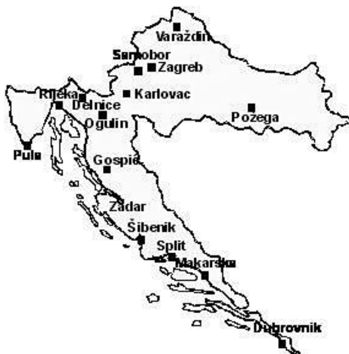
Slika 5: Stanice Hrvatske gorske službe spašavanja u Republici Hrvatskoj do kraja 2006. godine

vremenskim uvjetima i elementarnim nepogodama; koje gorski spasitelji Hrvatske gorske službe spašavanja posjeduju. HGSS je specifična javna udruga građana kojoj je cilj biti nacionalnim nositeljem gorskog spašavanja u Republici Hrvatskoj. Pored te univerzalnosti i specijalnosti , HGSS odlikuje posebna ekskluzivnost jer su njeni članovi u mogućnosti izvesti najzahtjevnija i najsloženija spašavanja i traganja koja provode i druge gorske službe spašavanja u svijetu; kao i elitizam članova što jamče postupci i načini školovanja, uvježbavanja i relativno kratki rokovi obnavljanja njihovih licenci. Opremljenost novijom tehnologijom i stalno praćenje najnovije tehnologije i standarda postupanja u području spašavanja i traganja daljnja je njihova karakteristika. Posebno treba istaknuti dostupnost i operativnost članova stanica HGSS-a, gdje se organiziraju stalna i/ili povremena dežurstva, a stalnim provođenjem vježbi provjerava se spremnost i nastoji što više skratiti potrebno vrijeme od dojava do intervencije, odnosno započinjanja izvođenja akcije. Važna značajka službe na koju zaključno treba ukazati je njena teritorijalna rasprostranjenost (15 stanica HGSS-a) gdje stanice HGSS-a međusobno ne konkuriraju nego djeluju usklađeno, nerijetko više njih zajedno, što čini posebno jedinstvo službe . HGSS od 1992. je punopravna članica svjetske međunarodne organizacije gorskog spašavanja IKAR - CISA.