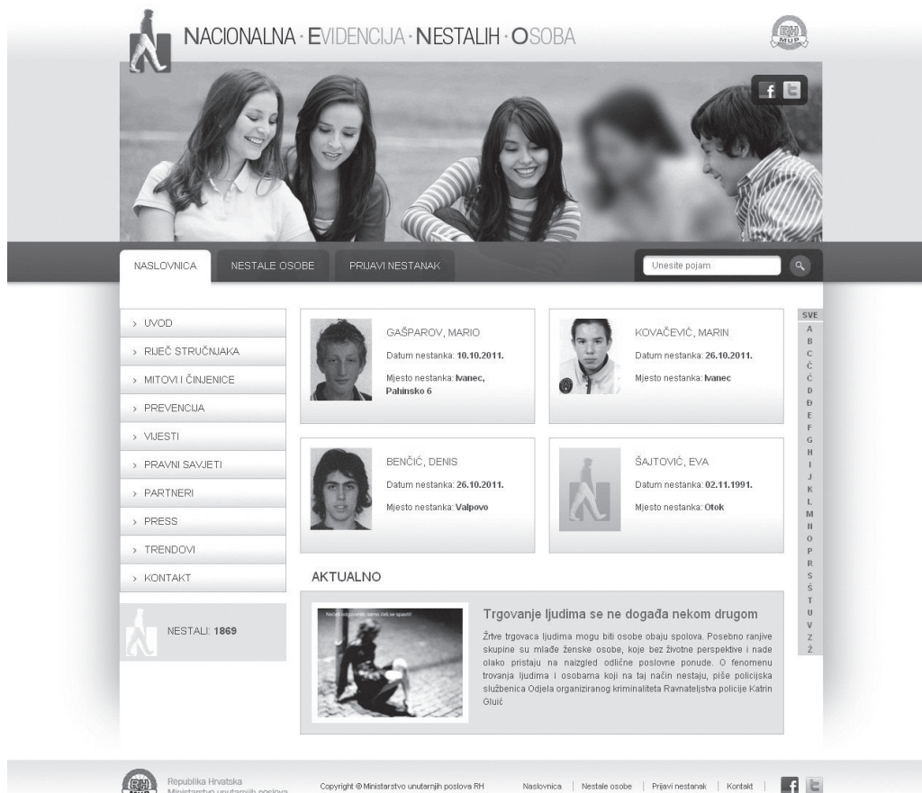
Slika 2: Prva www stranica portala nestali.hr

osoba. Internetskim obrascem omogućen je izravan kontakt s onima koji imaju korisne informacije o određenoj nestaloj osobi, bez odlaska u najbližu policijsku postaju. U obrascu su navedena pitanja koja građane usmjeravaju na to koji su podaci policiji korisni. Projekt se realizira u tri stadija koji će biti završeni do kraja 2011. godine. U drugom stadiju izrade web-stranice nestali.hr omogućit će se jednostavno generiranje PDF-letka s fotografijom i podacima o nestaloj osobi. Letak je namijenjen obitelji, prijateljima i zajednici da mogu letak ispisati, dijeliti i postavljati ga na javnim mjestima. Profili nestalih osoba bit će nadopunjeni galerijom fotografija, a putem foruma obitelji nestalih osoba moći će komunicirati i tražiti savjet direktno od stručnjaka iz različitih područja. U zadnjem stadiju projekta, svaki profil nestale osobe imat će i QR-kod, a bit će ponuđena i mogućnost objavljivanja videoisječaka. Automatizirat će se slanje novih podataka o nestalim osobama medijima. Stranica je prilagođena svim najpopularnijim internetskim preglednicima, te preglednicima na modernijim smart phone uređajima.