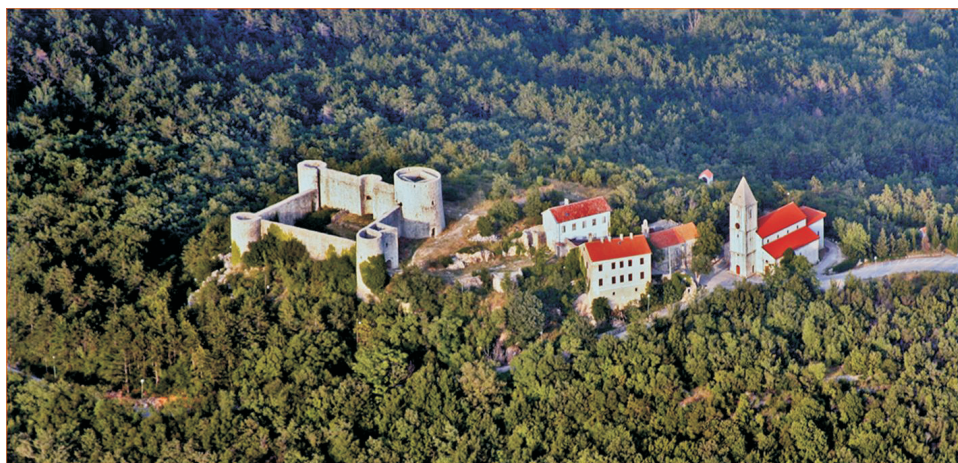
10. Drivenik, kaštel Bernardina Frakopana i župna crkva

uhvatiti njegove poslanike koji su trebali na Cetin doći do 21. prosinca i tu još prije Božića izabrati Ferdinanda za hrvatskoga kralja. Zbog teških zimskih puteva i straža koja je na tim putevima postavio Bernardin, njegovi su poslanici stigli na Cetin nekim drugim putevima tek poslije Božića pa je Cetinski sabor zakasnio, a zato su se izbor i proglašenje Ferdinanda hrvatskim kraljem dogodili baš na sam prvi dan 1527. godine. Ferdinandovi poslanici javljaju se na povratku pismom iz Metlike i opisuju da su jedva izbjegli zasjede koje su im na putevima preko svojih posjeda od Modruša do Ozlja postavili Bernardin i Krsto. 50