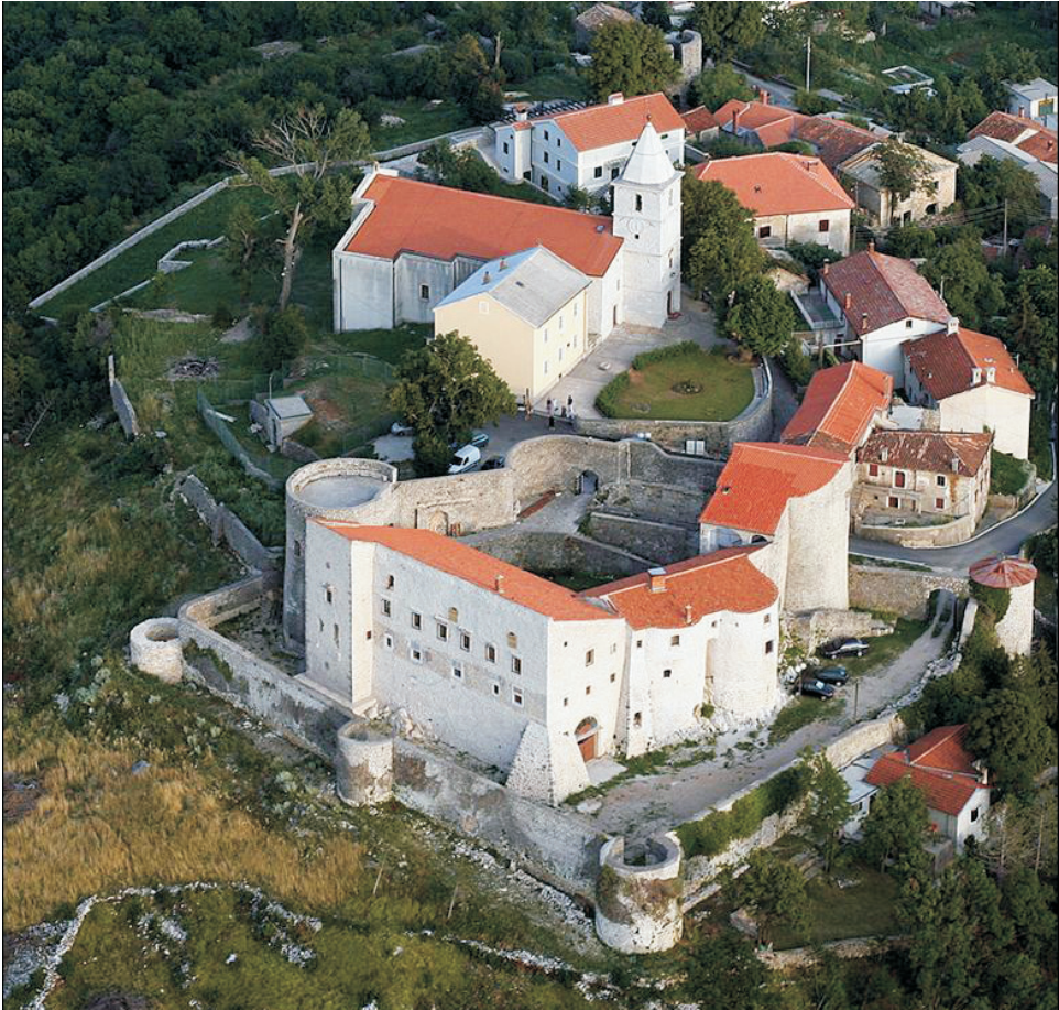
9. Grobnik, kaštel i ž. crkva, pogled iz zraka

sabor u Dubravi. 49 Očito je nadvojvoda I. Zapolja pridobio Krstu većim obećanjima i konkretnijim odlukama, podjelom visokih položaja i službi, pa i obećanjem da će mu vratiti stare posjede Frankopana, poglavito grad Senj. Takva obećanja Krsto od Ferdinanda nije dobio i vjerojatno je to bio razlog njegova konačnoga pristanka uz nadvojvodu I. Zapolju. Bernardin je, čini se, u toj stvari slijedio odluku Krste. Poznat je otvoreni Bernardinov neprijateljski odnos prema izboru Ferdinanda na Cetinu. Na tom ga saboru nije bilo, dapače, pokušao je