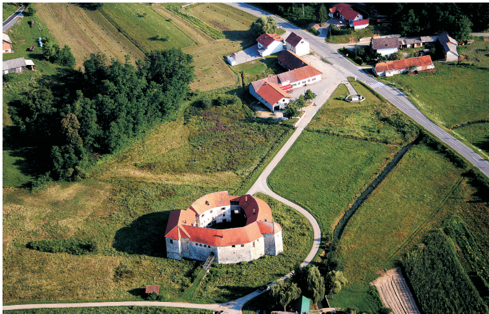
3. Ribnik, nizinski utvrđeni grad, pogled iz zraka (Snimio i obradio: Zvonimir Gerber).