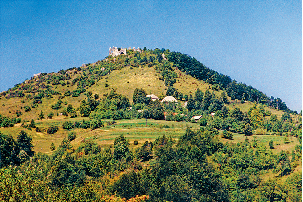
1. Modruš, pogled na položaj i mjesto grada Modruša.

s pripadajućim posjedom i to s privolom i potvrdom njegove supruge Lujze od Aragonije »de Marzano«. 3