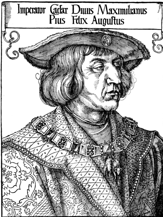
6. Car Maksimilijan I., crtež A. Durera. (Snimio i obradio: Zvonimir Gerber)

Dok su se sukobi zbog krajevske krune i vlasti smirivali, turski napadi na hrvatske zemlje postali su sve teži. Godina 1491. obilježena je jednom većom turskom provalom koja je na kraju završila sretnom pobjedom hrvatske vojske u Vrpilama, u klancu kojim se prolazilo iz Korenice prema Buniću. Ne znamo je li u toj bitci sudjelovao Bernardin Frankopan, ali je sigurno da su Frankopani, iako je na čelu vojske bio hrvatski ban Ladislav od Egervara, bili glavni tvorci te velike pobjede. Kroničar Tomašić spominje da su u boju prednjačili Frankopani Ivan Cetinski i Mihajlo Slunjski i da su se sa svojim ljudima borili ne kao ljudi već kao lavovi. Bernardina ne spominje. Međutim, turski ljetopisac govori da je sukobu kod