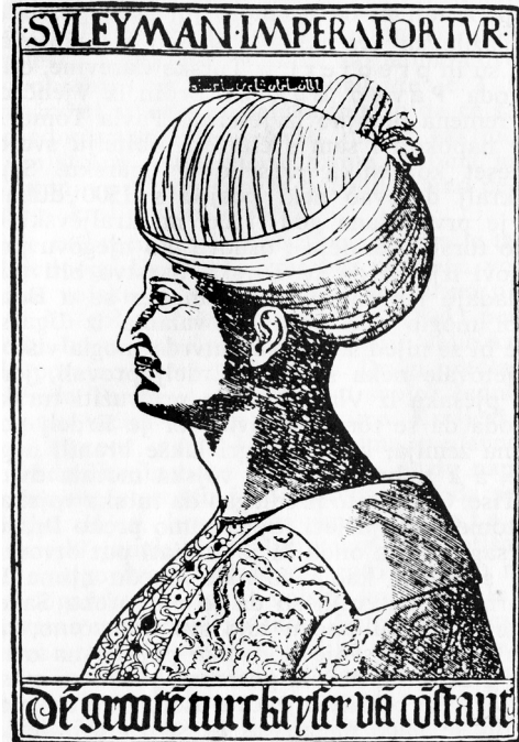
8. Turski car, sultan Sulejman II.

kolovoza. To se i dogodilo i ugarska je vojska bila u tom boju posve potučena, a kralj je na bijegu iz bitke poginuo. Turci su bez ikakvoga otpora ušli u Peštu i kraljevski dvor u Budimu. Ugarsko Kraljevstvo izgubilo je sudbonosnu bitku, kralja, pola svojega teritorija i svoju prijestolnicu. Silna uništavanja i pljačku vršila je ta pobjedonosna turska vojska u svojem povratku od Budima do Beograda. Krsto je još 5. rujna u Zagrebu, i tu je doznao prve vijesti o porazu na Mohačkom polju. Javlja to u pismu senjskomu biskupu Franji Jožefiću. Nije još znao da je kralj poginuo pa se tomu raduje, sebe opravdava što nije mogao prije stići na Mohač, a kudi nerazboritost Mađara i izražava osudu njihove oholosti. Otvoreno je to izrekao ovako: »gdo bi mogal pod njima ostati« da su pobijedili, a da je i prispio u boj, u tom bi neredu i nerazboru on bio »najprvi, ki bi moral ubijen biti«. 47