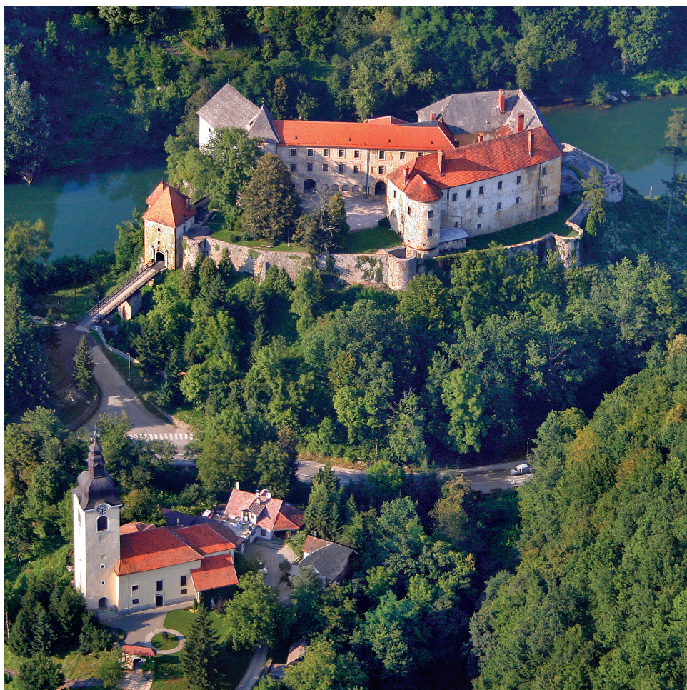
11. Stari grad Ozalj, grad Frankopana i Zrinskih knezova

posljednje sate Krstina života, poslije čega ga odvezoše u Modruš gdje ga pokopaše u frankopanskoj grobnici. 52