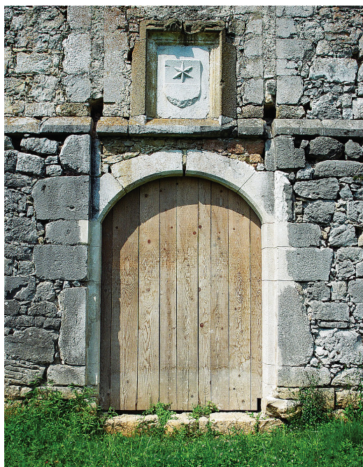
2. Ribnik, »Zvijezda« u grb knezova Krčkih, istočni ulaz (Snimio i obradio: Zvonimir Gerber).