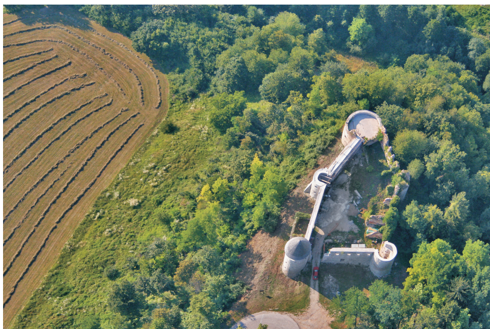
12. Novigrad na Dobri, kaštel Bernardina Frankopana

dogodilo da Mlečani iskoriste Brenardinoviu smrt, pa da ugrabe što od njegovih posjeda, posebno u Vinodolu, »kao što to i čine kad god mogu«... . Čini to i kao zakoniti kralj, ali i kao vrhovni zaštitnik i čuvar po snazi testamenta kojim mu je knez Bernardin to povjerio....« Dakle ne čini to u svoje ime ili za svoju privatnu korist, nego »zbog dobrobiti i u korist malodobnih nasljednika ....«. 56