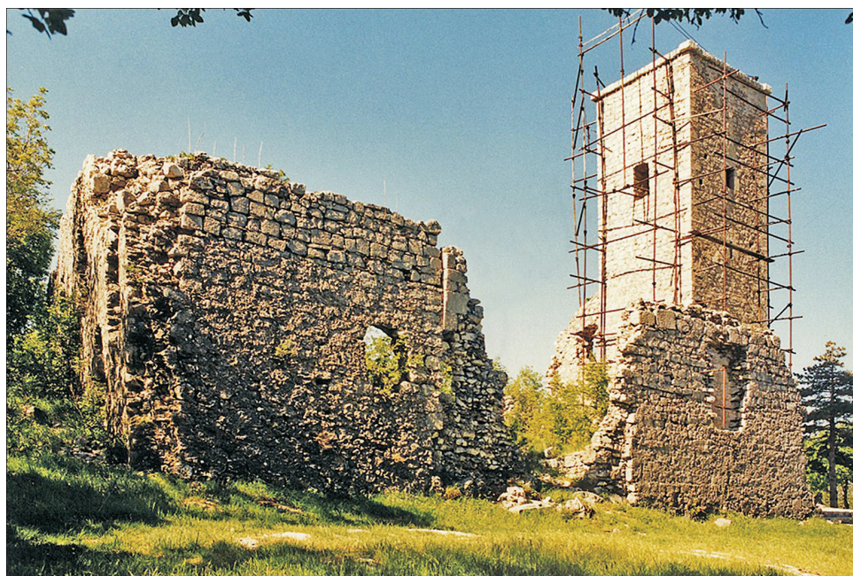
5. Hreljin, ruševni ostaci stare crkve sv. Jurja