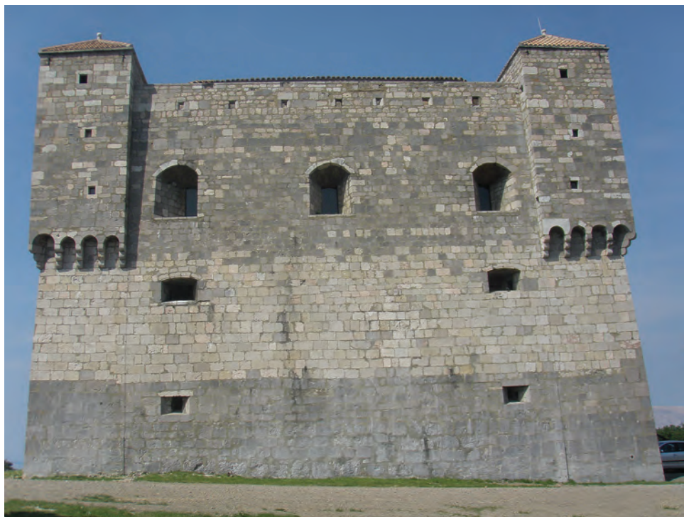
Sl. 37 Senj, Nehaj

Grižana, Drivenika, Bakra, Hreljina, Trsata i Grobnika, u prezentaciju treba uključiti i iznimno zanimljiv te arheološki vrlo dobro sačuvan grad Badanj. 44