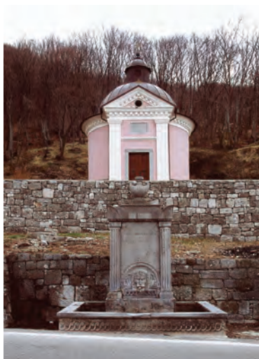
Sl. 15 Majorija, pogled na Carsko vrilu i kapelu sv. Mihovila