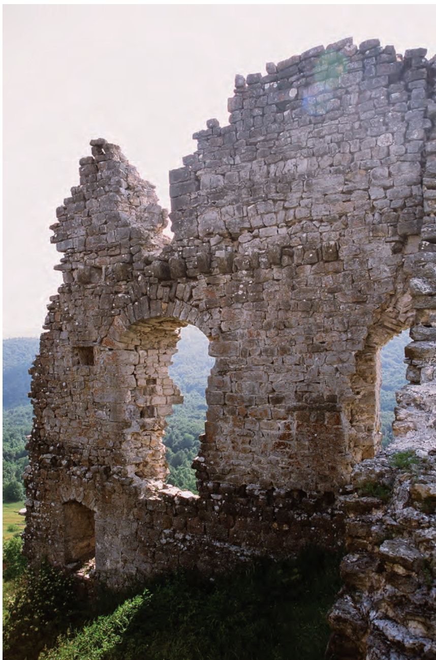
Sl. 1 Modruš, pogled na jugozapadni zid palasa