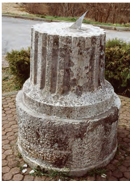
Sl. 3 Generalski Stol, Sunčani sat