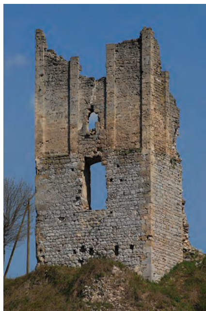
Sl. 24 Brinje, Sokolac, zapadno pročelje ulazne kule