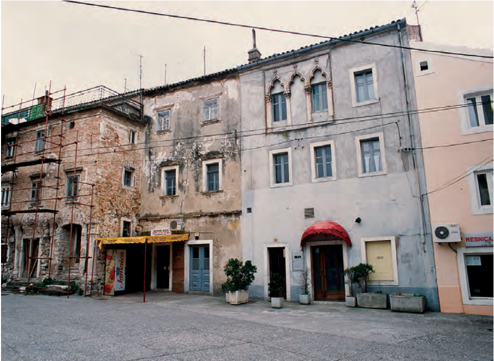
Sl. 36 Senj, Gradska loža i kuća Daničić s velikom djelomično zazidanom triforom.

mnoštvo uzidanih rimskih spolija, srednjovjekovnih i novovjekovnih glagoljskih natpisa i uklesanih godina, svakom će prolazniku ukazati na bogatu i dinamičnu prošlost grada. Neka od najmarkantnijih senjskih zdanja, kao što je to kaštel, čije početke razvoja moramo tražiti u razdoblju u kojem su templari posjedovali Senj, a koji potom dograđuju knezovi Krčki i kralj Matijaš Korvin, ne ćemo moći prepoznati nakon radikalne pregradnje i dogradnje krajem 19. stoljeća. No, zato će svaki putnik, prilazeći Senju iz bilo kojega od četiri pravca, već izdaleka ugledati iznimno dobro očuvan i odgovarajuće prezentiran novovjekli kaštel Nehaj (sl. 37), što ga je kapetan Ivan Lenković sagradio 1558. godine, da s povišenja s istočne strane gradskih zidina bdije nad sigurnošću Senja.