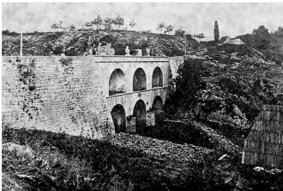
Sl. 6 Tounjski most oko 1900. godine