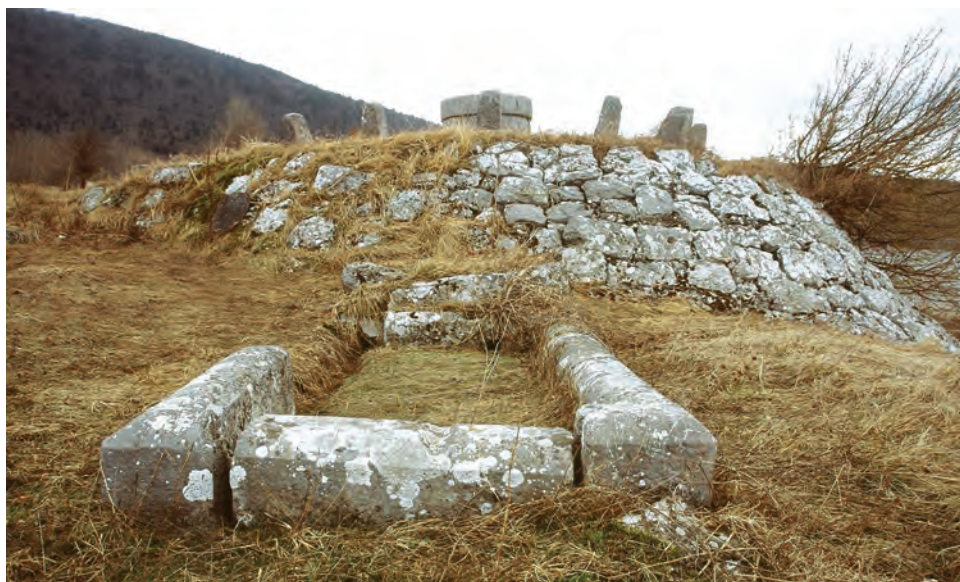
Sl. 12 Razvala, bunar s pojilom