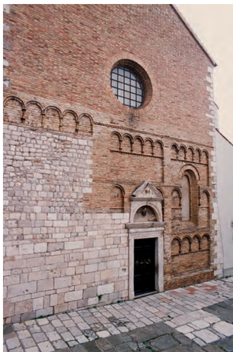
Sl. 34 Senj, katedrala, glavno pročelje s predstavjenim romaničkim slojem