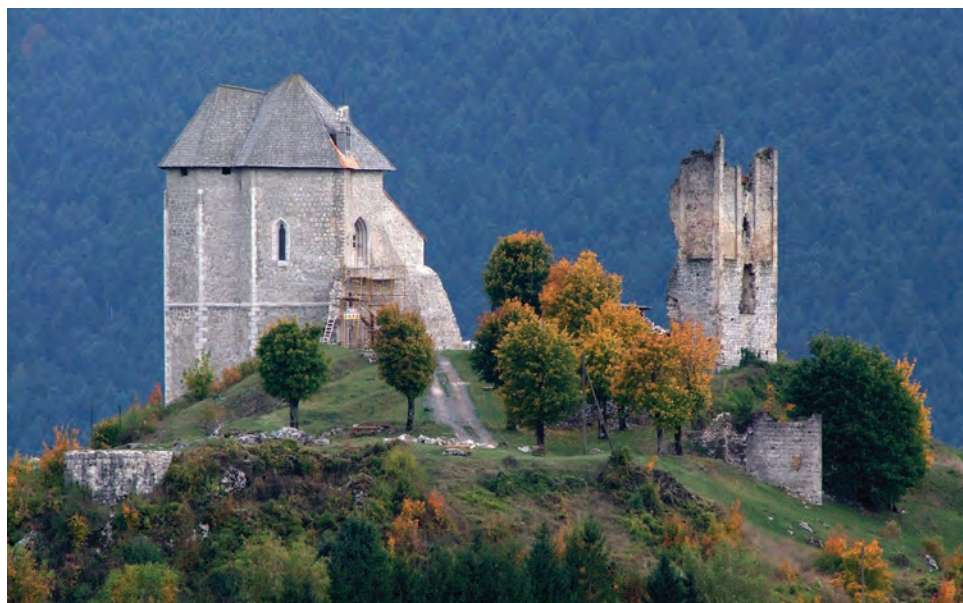
sl. 23 Brinje, pogled na Sokolac s kapelom sv. Trojstva i ruševinom ulazne kule