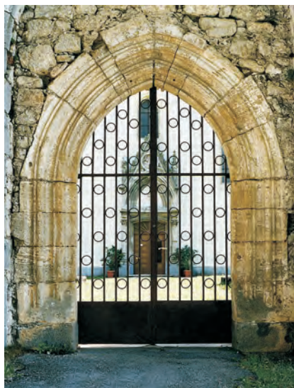
Sl. 19 Oštarije, crkva sv. Marije, zapadni gotički portal