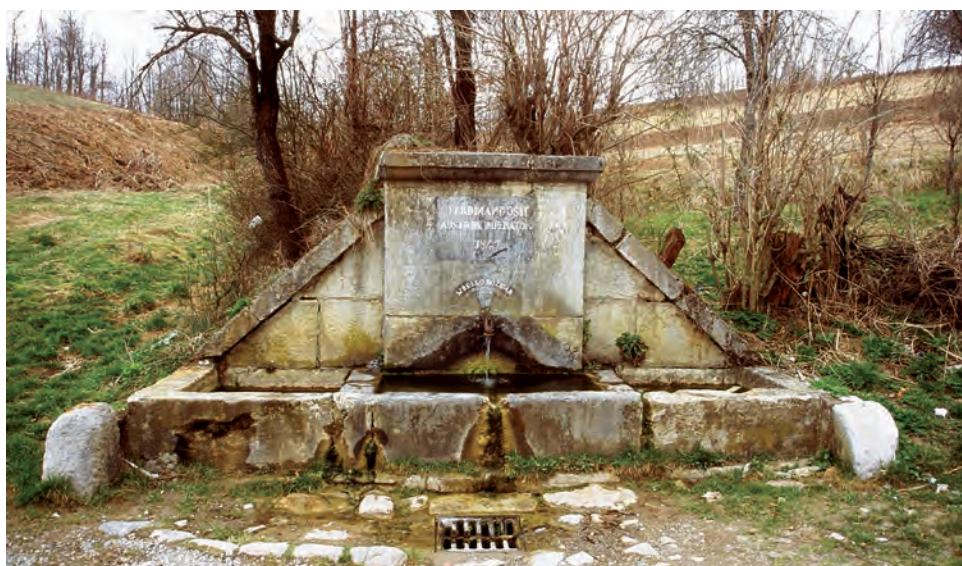
Sl. 4 Tounjski potok, Vrelo Božidar