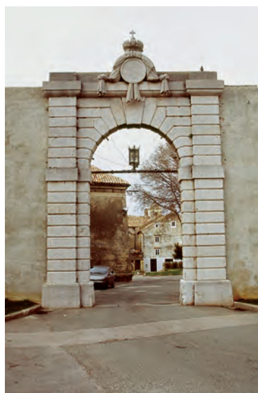
Sl. 17 Senj, Velika vrata