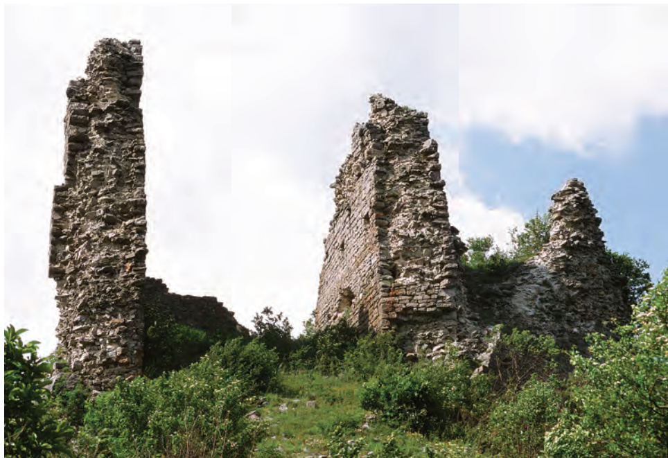
Sl. 21 Modruš, pogled na južni dio grada