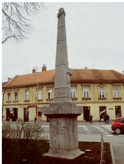
Sl. 2 Karlovac, Obelisk kojim je označen početak Jozefinske ceste