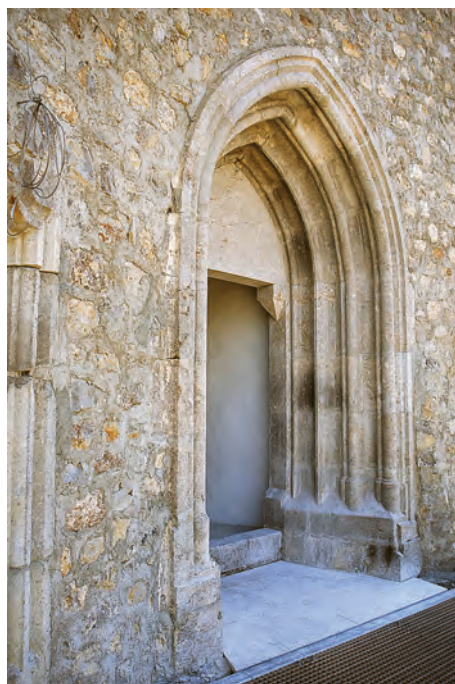
Sl. 30 Brinje, Sokolac, kapela Sv. Trojstva, portal empore