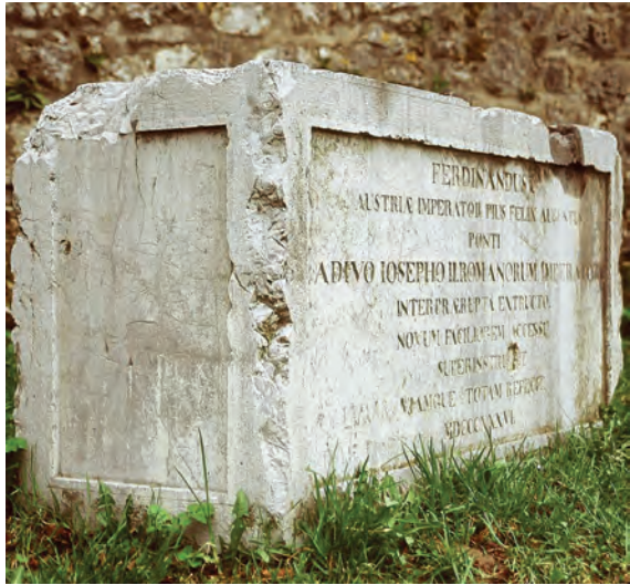
Sl. 8 Ogulin, Gradski muzej, natpis s Tounjskog mosta

Drugoga svjetskoga rata, most je obnovio 1972. godine naš najveći mostograditelj Kruno Tonković. 15 Nažalost, tada nisu vraćeni na parapete mosta natpisi i skulpture (sl. 6–8). 16