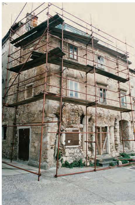
Sl. 35 Senj, Gradska loža

povećati prometna izolacija Senja. Stoga je neophodno da se brojnim turistima, koji samo autocestom projure Lijepom našom na putu do odredišta njihova ljetovanja, ponude atraktivni sadržaji koji će ih motivirati da siđu s autoceste i neposrednije se upoznaju s prirodnim ljepotama i kulturom zemlje u kojoj su odlučili provesti godišnji odmor.