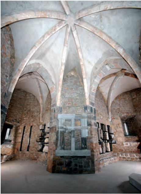
Sl. 28 Brinje, Sokolac, unutrašnjost substrukcije kapele Sv. Trojstva