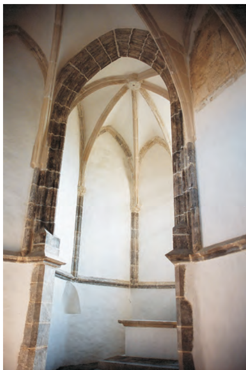
sl. 32 Brinje, Sokolac, unutrašnjost, pogled na svetište kapele Sv. Trojstva nakon obnove, a prije postavljanja oltara