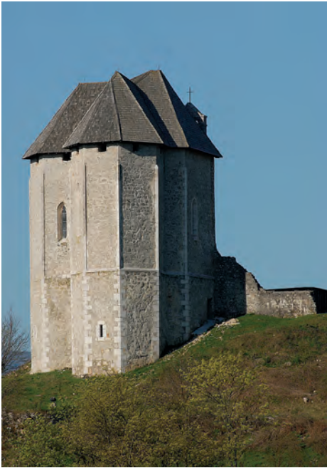
Sl. 26 Brinje, Sokolac, pogled na kapelu Sv. Trojstva sa sjeveroistoka