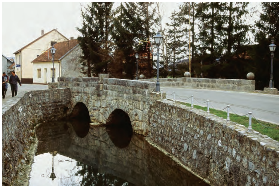
Sl. 14 Brinje, Strupijev most

prometa u Hrvatskoj. Naime, nakon što je sagrađena prvo željeznička pruga od Zagreba do Rijeke, u etapama se započelo graditi prugu od Karlovca do Splita. Nakon što je puštena u promet i dionica pruge od Gospića do Gračaca, kojom je Lika spojena sa Splitom, najbrža veza između Zagreba i Splita, odnosno Zagreba i Like bila je vlakom do Ogulina i dalje dilažanskom do Gospića. 20 Stoga je 1892. godine otvorena redovita linija dilažansama između Ogulina i Gospića, a konji i putnici na tom su se bunaru okrjepljivali vodom prije prelaska Kapele, o čem svjedoče duboke užljebljine nastale povlačenjem užeta s kablčićem (sl. 13).