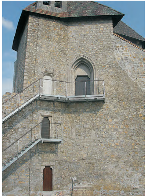
Sl. 29 Brinje, Sokolac, glavno pročelje kapele Sv. Trojstva nakon obnove

prvi počinje posve pogrješno svrstavati brinjsku kapelu u obrambene crkve, čak njezin tlocrtni oblik objašnjava obrambenom zadaćom: « Sam teren, na kojem je kapela sazdana, ne opravdava toga načina gradnje, ali nema sumnje, da je baš obrambena zadaća kapele učinila, da je nastao ovakav oblik ... Tako je ova kapela bila gotovo najvažniji dio grada za obranu ». 36 U prvom pregledu Hrvatske umjetnosti, Željko Jiroušek zaključuje da je « Jedna od najljepših i najosebujnijih dvokatna kapela na brdu Sokolcu kod Brinja ». 37 On ispravlja Szabovu tvrdnju da je brinjska kapela trokatna građevina, no unatoč tomu i idući će istraživači i dalje ponavljati to mišljenje. 38 Ljubo Karaman, u pregledu Umjetnosti srednjega vijeka u Hrvatskoj i Slavoniji, ne spominje Brinje, a jednako tako Brinje ne spominje ni Radovan Ivančević u prvom suvremenom pregledu umjetnosti u Hrvatskoj. 39 U posljednjem