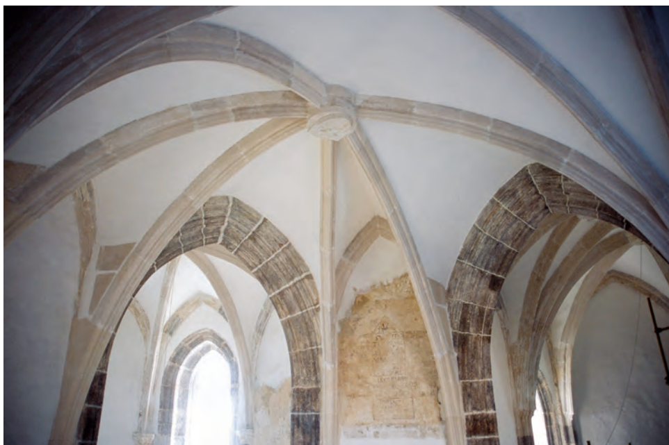
Sl. 31 Brinje, Sokolac, pogled na svodove kapele Sv. Trojstva nakon obnove