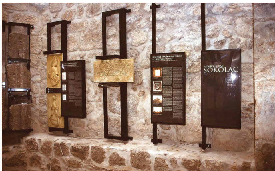
Sl. 33 Brinje, Sokolac, detalj izložbe u substrukciji kapele Sv. Trojstva