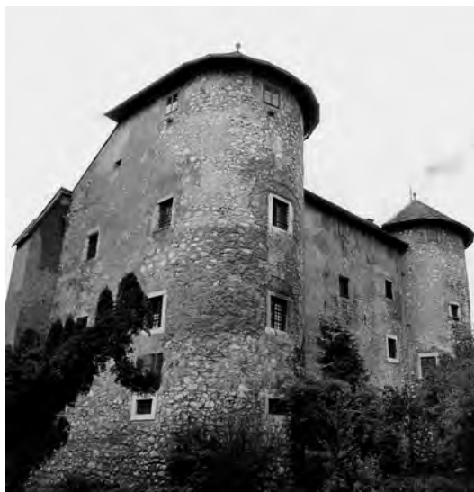
Sl. 20. Ogulin, Frankopanski kaštel