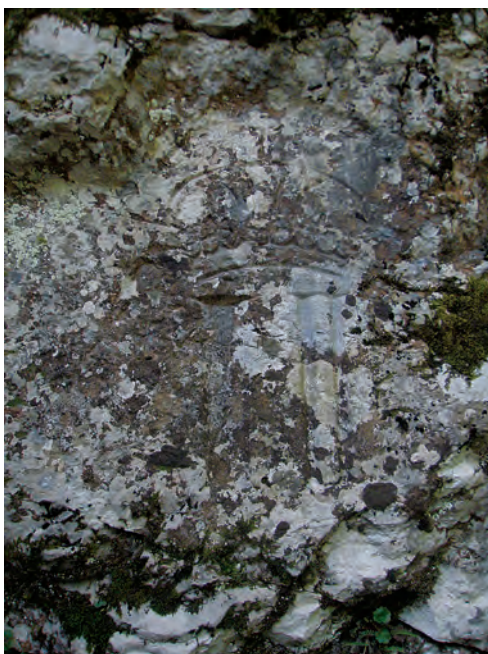
Sl. 10 Natpis uklesan u živu stijenu na mjestu pada s konja cara Josipa I. tijekom prelaska preko Kapele uz trasu Struppijeve ceste