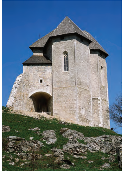
Sl. 27 Brinje, Sokolac, pogled na kapelu Sv. Trojstva s juga

druša. Činjenica jest da je modruških zidova svakim danom sve manje, posljednje veliko urušavanje dogodilo se u siječnju 2008. godine, kada se urušio veći dio istočnoga obrambenog zida, na što Ministarstvo kulture uopće nije reagiralo, usprkos pravodobnom upozorenju. Modruš mora biti istražen i predstavljen javnosti, tu svaki posjetitelj mora dobiti točnu informaciju o važnosti mjesta na kojem se nalazi. Jednako tako, Modruš mora biti dio cjelovito osmišljenoga projekta prezentacije » in situ » frankopanske kulturne baštine.