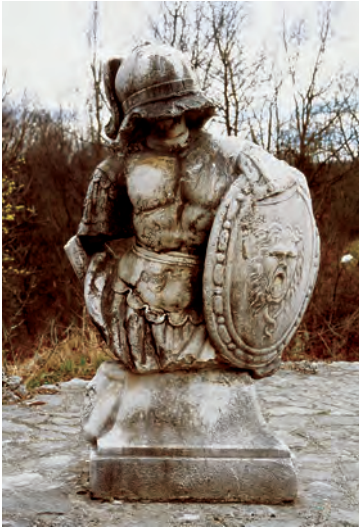
Sl. 7 Tounjski most, skulptura Trijumfa postavljena na vidikovac pokraj mosta