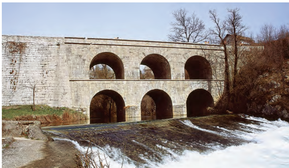
Sl. 5 Tounjski most na Jozefinskoj cesti, sadašnje stanje