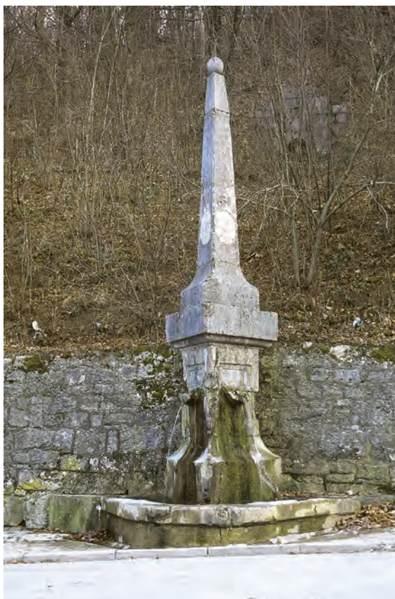
Sl. 11 Modruš, Fontana Rožić