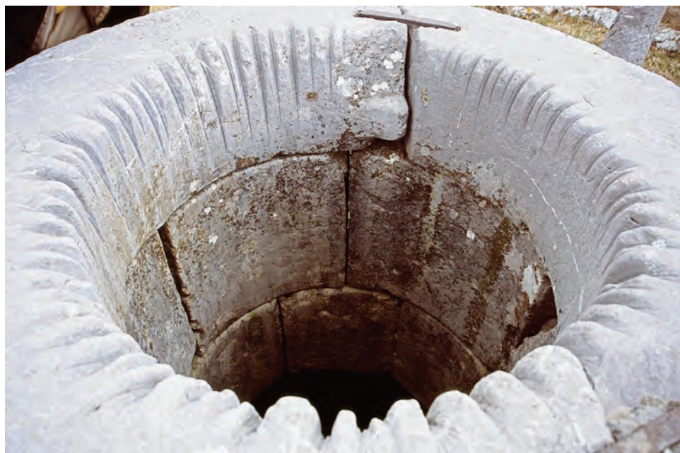
Sl. 13 Razvala, kamena kruna bunara