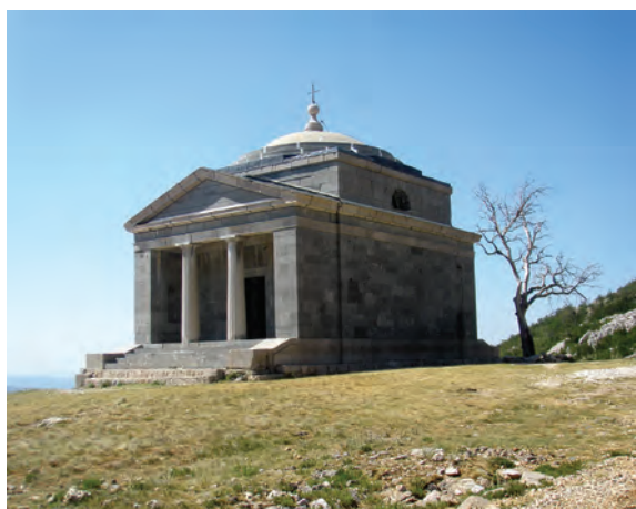
Sl. 18 Podprag, kapela sv. Franje na Majstorskoj cesti