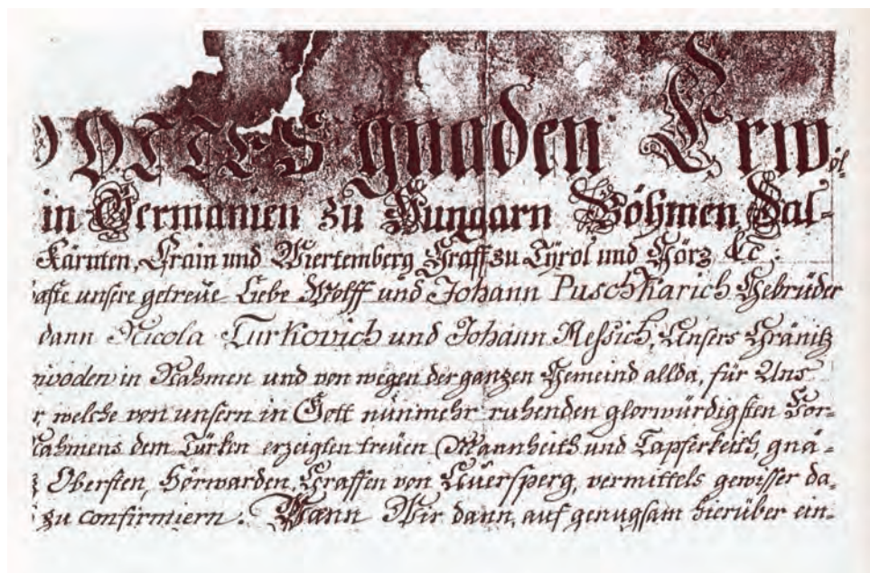
Sl. 3. Povelja kralja Leopolda I., kojom se utvrđuju granice ogulinske općine te potvrđuje plemićki naslov Vuku i Ivanu Puškariću, Nikoli (Mikuli) Turkoviću i Ivanu Mešiću.

Grbovno znakovlje plemića ogulinskoga kraja je agresivnije nego u nekim drugim dijelovima Hrvatske, uglavnom zbog stalne obrane vlastitoga ognjišta i državnih granica na prostoru cijele Vojne krajine uz granicu s Bosnom i Hercegovinom.