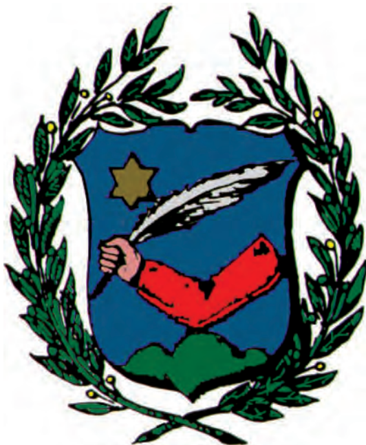
Sl. 10. Grb obitelji Mesić

Postoje dvije nesrodne rodovske zajednice ovoga prezimena: Magdići u Koprivničko–križevačkoj županiji (Križevci, Čazma, Đurđevac i Pitomača), te Magdići u ogulinskom kraju kao najveća rodovska zajednica koja je nastala u 15. st. 20