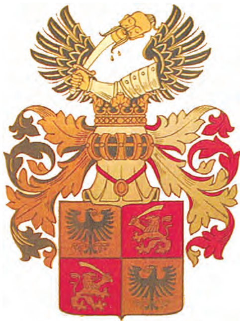
Sl.13 Grb obitelji Prebjeg–Prebeg