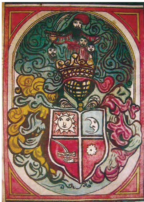
Sl. 15. Grb s grbovnice i grbovnica kralja Leopolda I. iz 1668. o dodjeli plemstva i grba Vuku i Ivanu Puškariću

U ogulinskom kraju Puškarići su najprije bili građani koji su živjeli u ogulinskom tvrđavnom naselju te zauzimali važne vojničke i upravne položaje u naselju. Kao pripadnici najstarijih hrvatskih plemićkih rodova bili su utjecajni te su obnašali visoke dužnosti u gradu Ogulinu.