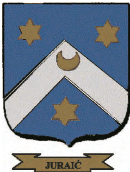
Sl. 7. Grb s pečata Ivana Juraića iz 1817.