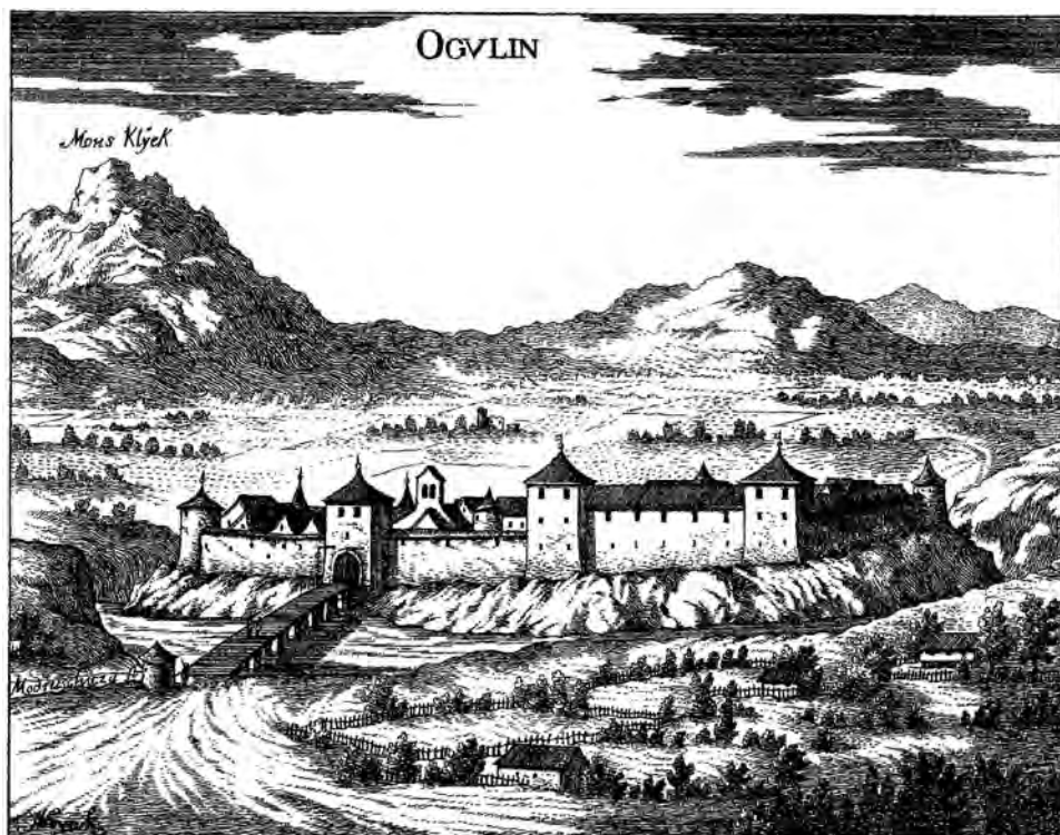
Sl. 2 Ogulin, Johann Weikhard Valvasor, Slava Vojvodine Kranjske, 1689.

Godine 1746. uspostavljen je novi ustroj Vojne krajine te je ogulinski kraj postao carskom zemljom i sjedištem pješačke graničarske pukovnije s obvezom muškaraca da kao carski podanici redovito služe austrijsku vojsku.