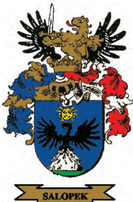
Sl. 16. Grb obitelji Salopek

ŠTIT: 34 U plavom štitu na srebrnoj stijeni crni orao raširenih krila, okrenut udesno, a iznad je sunce.