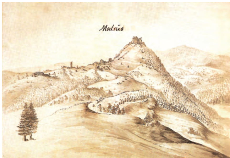
Sl. 4. Crtež Modruša iz 1729. godine Mattias Anton Weiss (Austrijska Nacionalna knjižnica)

Grbovno znakovlje plemića ogulinskoga kraja heraldički je agresivnije od nekih drugih dijelova Hrvatske upravo zbog stalne obrane vlastitoga ognjišta i državnih granica na prostoru cijele Vojne krajine. 9