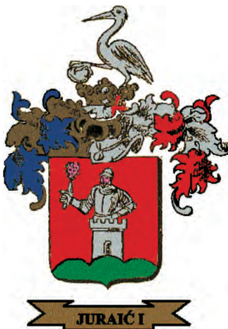
Sl. 6. Grb obitelji Juraić I