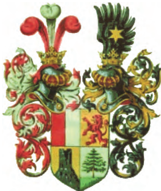
Sl. 5. Grb obitelji Kurelac–Kurelec