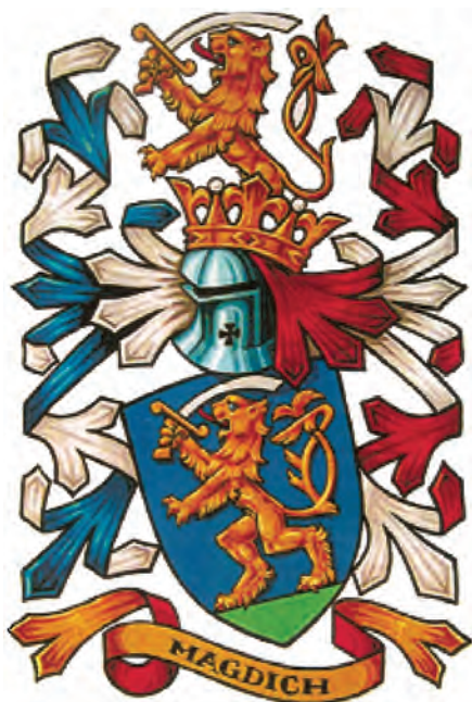
Sl. 9. Grb Magdića (dizajner Mladen Stojić)