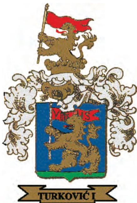
Sl. 17. Grb obitelji Turković