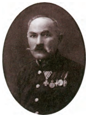
Sl.12. General Mihael Mihaljević iz Oštarija (1864.–1925.)

U Ogulinu se prvi put spominju u poznatom popisu ogulinskih vojnika iz 1699. godine, a ovaj popis bilježi vojvodu Pavu Mihaljevića iz Oštarija. Isti se spominje i 1715. godine kao svjedok izvješća iseljenja iz Oštarija. 26