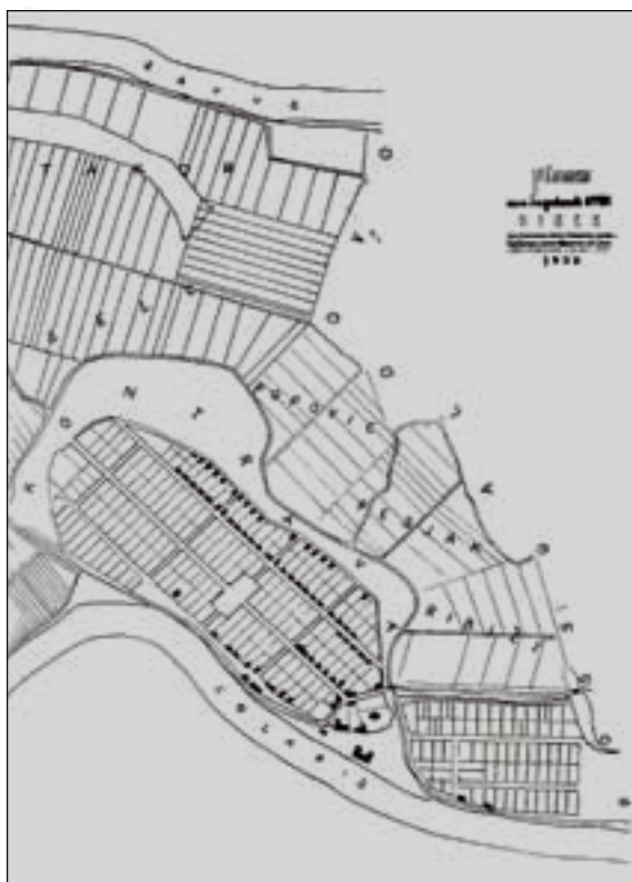
Slika 3. Mapa arheoloških lokaliteta u centru Siska (Domagoj VUKOVIĆ 1994: 22)

Broj 119 nalaz je rimskog hipokausta ispred „Rimske pivnice“. 39