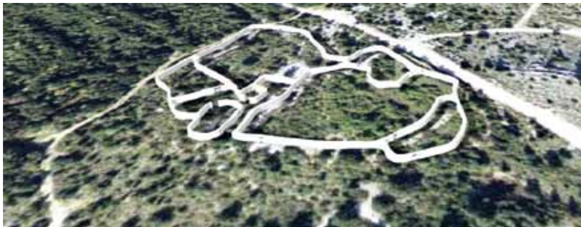
Sl.5. Pastirska nastamba na padinama Starog Raklja

Razlika se očituje tek u gradnji obodnih zidova