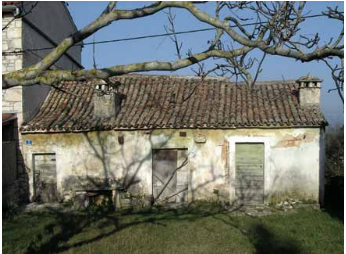
Sl.7. Nastambe na području današnjeg Raklja

od poluobrađenog i obrađenog kamena na uglovima građevine. Uporaba obrađenog kamena daje mogućnost izvedbe dimovodnog kanala istaknutim na vanjskom, uglavnom uzdužnom zidu, pa se dim s ognjišta više ne širi prostorom, a vrata nisu jedini otvor jer se na jednom od zidova koji nisu okrenuta hladnim vjetrovima pojavljuje okno.