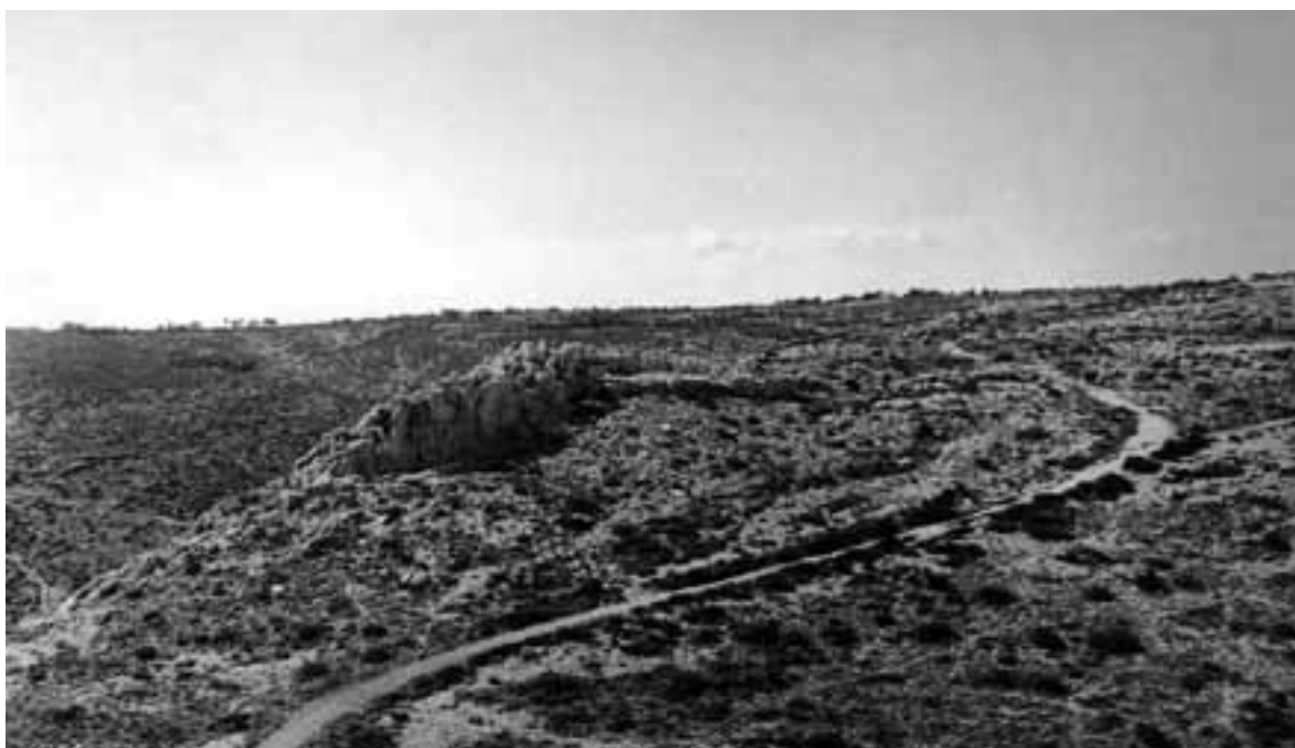
Sl.2a. Područje Starog Raklja sredinom 20.stoljeća