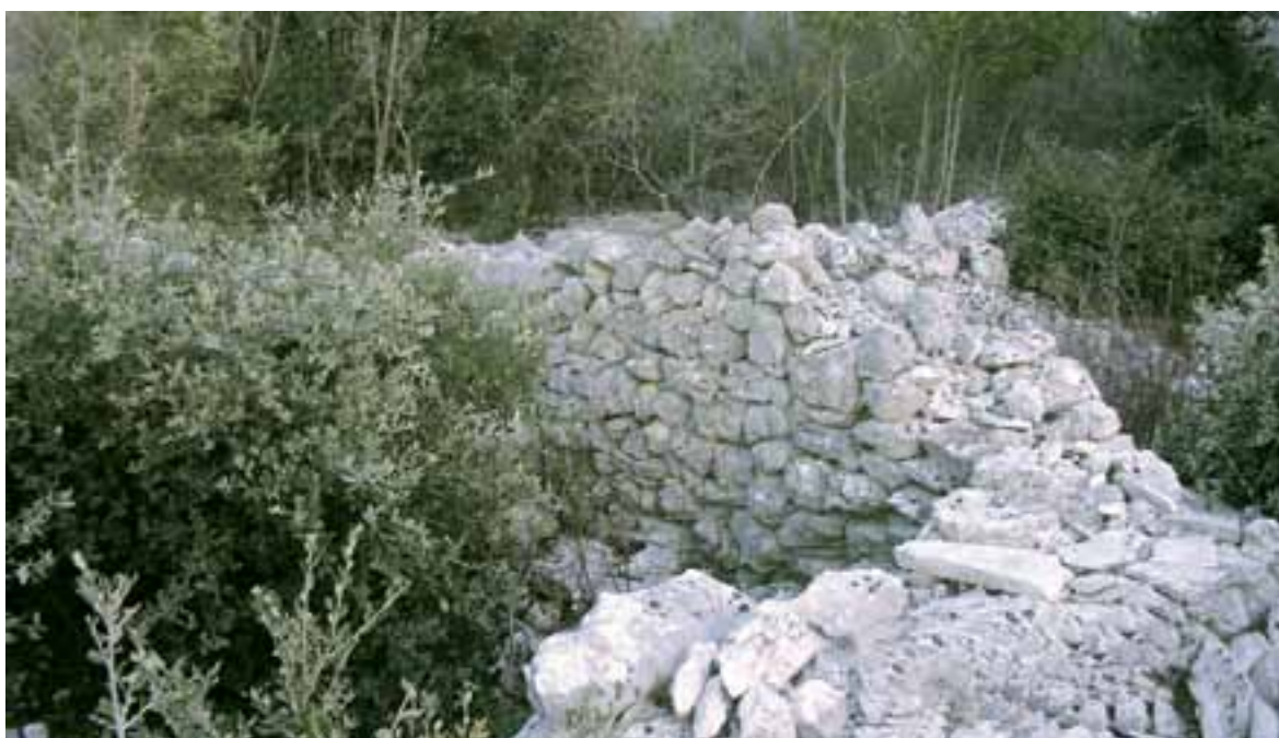
Sl.3. Ostaci nastambi na Starom Raklju

tivne izgradnje suhozida koji se odlikuje osobitom nepravilnošću i grubošću svoje izgradnje, gotovo se u potpunosti podudaraju s elementima pretpovijesnog prototipa.