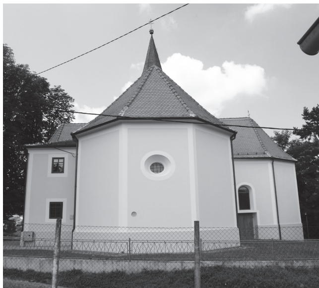
Slika 3. Pogled na svetište crkve, lijevo je sakristija, a desno sjeverna bočna kapela Tijela Kristova, pogled sa istoka.

crkve u dobrom je stanju. Njegova konstrukcija je dvostrešnog, tlocrtno pravilnog križnog oblika, nad svetištem i bočnim kapelama završava poligonalno, a dvostrešno se produžuje i nad sakristiju te u cijelosti oslanja na vanjske nosive zidove građevine. Svi dijelovi crkve, svetište, lađa i bočne kapele imaju krovšte iste visine.