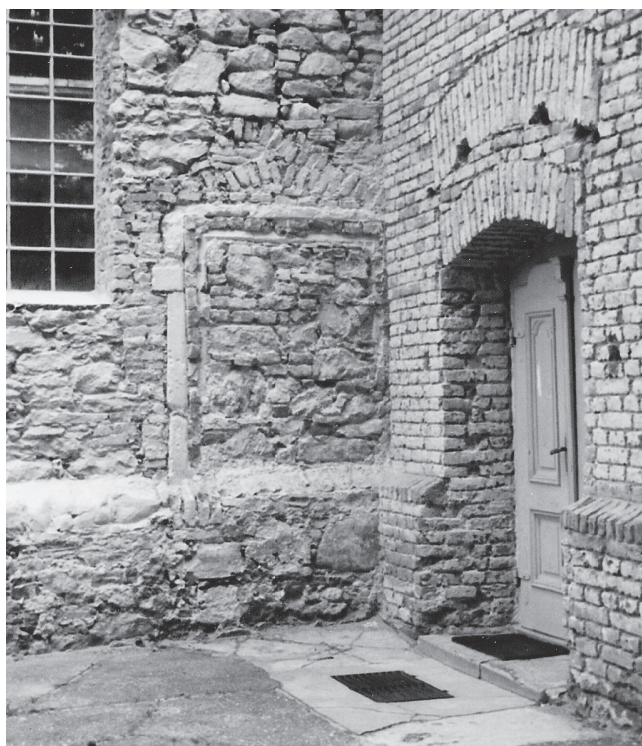
Slika 11. Zazidani kasnogotički portal na južnom zidu lađe snimljen 1991. g. (inv. br. 110, br. neg. 6/0).

provedene 2008. godine bez Službe zaštite kulturnih dobara. Naknadno je utvrđeno da su izvedeni unutarnji radovi, i to žbukanje i oslikavanje unutarnjih zidova ornamentalnim ukrasima, obnavljanje ili uvođenje električne, plinske i vodovodne instalacije, ugrađivanje novih prozora i rasvjetnih tijela te obnavljanje klupa i poda ispod njih. Pod u crkvi danas je u potpunosti pokriven tepihom, a prostor iza glavnog oltara opločen je keramičkim, mjestimice i kamenim pločama. Ako će se u crkvi u budućnosti mijenjati podne ploče, neka one budu od nepoliranog kamena koji svojom neutralnošću neće dominirati crkvenom unutrašnjošću.