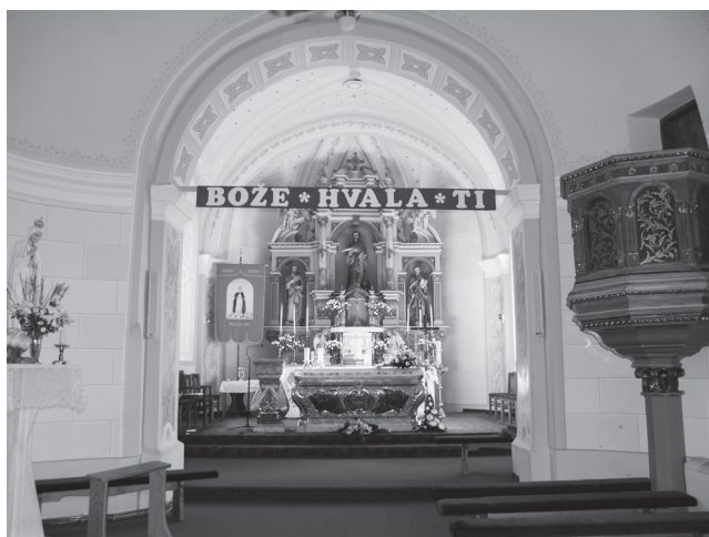
Slika 13. Unutrašnjost crkve, pogled prema svetištu.

prema crkvi sa zapadne strane izgrađene su 1958. godine. Nova drvena i žičana ograda oko crkve podignuta je 1961. godine, a izvršena je i odvodnja krovnih voda betonskim cijevima koje su dotad oštećivale zidove crkve i erodirale teren dvorišta. U proljeće 1973. godine krenulo se s uređenjem crkvenog dvorišta, betonirane su prilazne staze crkvi, a dvorište je ograđeno s istočne i južne strane betonsko-željeznom ogradom. Pristupne staze crkvi ponovo su betonirane 1977., a 1980. godine izgrađena je i ograda nešto niže od crkve. Stube koje sa zapadne strane vode do crkve i staze oko crkve betonirane su ponovo 1983., a iste godine asfaltiran je i prilaz crkvi. Tijekom 2009. godine parterna zona dvorišta uz crkvu obložena je betonskim opločnjacima koji su na dijelovima postavljeni u obliku velikih crveno-žutih rozeta, što djeluje prilično »napadno« i narušava vizualni sklad crkve i njenog okoliša. Crkva danas ima neadekvatnu ogradu pa je potrebno projektirati novu koja neće narušavati izgled čitavog kompleksa. Tim projektom bilo bi dobro obuhvatiti i opločnje dvorišta neposredno uz crkvu i pristupne stube na zapadnoj strani koje je potrebno izmijeniti ili obložiti kamenom ili nekim drugim prihvatljivim materijalom.