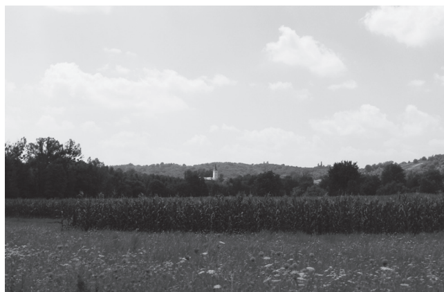
Slika 1. Pogled na današnju župnu crkvu Sv. Marka u Selnici sa sjeveroistoka.

radi o usamljenom nalazu, bilo bi smjelo samo na temelju njega ubicirati postojanje rimskog lokaliteta na ovom mjestu. O smještaju i izgledu srednjovjekovnog naselja nemamo nikakvih podataka, a jedina arheološka istraživanja s kojih nam se očuvalo tek nekoliko fotografija provedena su prilikom izvođenja vanjskog drenažnog sustava župne crkve 1991. godine. U njima je potvrđeno postojanje kosturnog groblja, ali ono tada nije vremenski pobliže datirano zbog potpunog izostanka pokretnih nalaza.