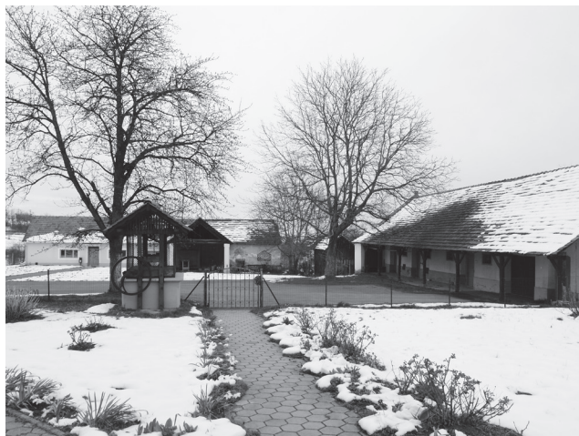
Slika 16. Pogled na zdenac i gospodarske građevine selničkog župnog kompleksa.

odlike tradicijskog graditeljstva (sl. 16). Svojom opstojnošću daju naročitu vrijednost cijelom ambijentu u kojem dominira župna crkva.