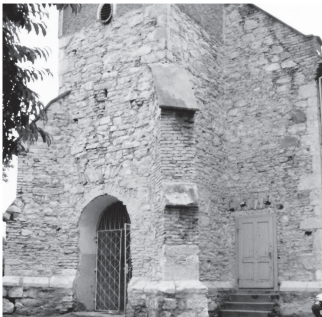
Slika 8. Zvonik i lađa snimljeni 1991. g. kad je sva žbuka bila uklonjena (inv. br. 114, br. neg. 6/5).

sjevernog zida lađe. 29 Južna bočna kapela nastaje kasnije, ali nemamo pouzdanih podataka o vremenu njene izgradnje. Obje kapele imaju poligonalni zaključak, kao i svetište. Lučne prozore identične onima na lađi i svetištu nalazimo i na bočnim kapelama. Na sjevernoj kapeli prozori se nalaze na zapadnoj i istočnoj stijeni (onaj na istočnoj je nešto kraći jer se ispod njega nalaze vrata), a na južnoj kapeli na istočnoj i zapadnoj stijeni poligonalnog zaključka. Posebno je zanimljiv barokni portal s uklesanom 1766. godinom na zaglavnom kamenu koji se nalazi na zapadnom zidu južne kapele. On je naknadno ugrađen, što možemo zaključiti po njegovom današnjem položaju. Naime, portal je danas okrenut tako da se vanjska strana s uklesanom godinom nalazi u unutrašnjosti kapele, a ne izvana gdje je izvorno stajala. Ovaj barokni portal, iako sličan onome koji se danas nalazi ispod zvonika na glavnom ulazu u crkvu, ipak je nešto bogatije izvedbe.