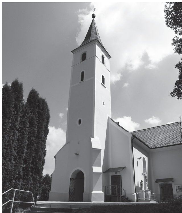
Slika 9. Pogled na zapadni dio crkve sa zvonikom.

ne opisuje kao malenu, zidanu i nadsvođenu. 31 Ta sakristija srušena je u periodu od 1743. 32 do 1747. godine 33 i izgrađena je nova, prislonjena uz južnu stranu svetišta, djelomično i lađe. Riječ je o današnjoj sakristiji četvrtastog tlocrta na dva kata građenoj od opeke (sl. 3, 6). Na fotografijama crkve iz 1991. godine kad je skinuta sva žbuka s vanjskih pročelja vidljivo je da se raspored prozora na sakristiji više puta mijenjao. Daljnjom analizom tih fotografija može se uočiti veza između načina izgradnje svetišta (sl. 4) i sakristije (sl. 6). I svetište i sakristija građeni su od opeke i imaju relativno pravilno postavljene nizove obrađenog kamenja do visine sokla, a mjestimice i iznad njega. Navedeno dovodi do zaključka da nastaju istovremeno, a budući da znamo vrijeme izgradnje sakristije, poznato nam je i vrijeme nastanka svetišta. Sakristija ima po jedan četvrtasti prozor na svakom katu istočnog zida (sl. 3, 6). Svi navedeni prozori na lađi, svetištu, bočnim kapelama i sakristiji jednostavni su i bez klesanih kamenih elemenata.