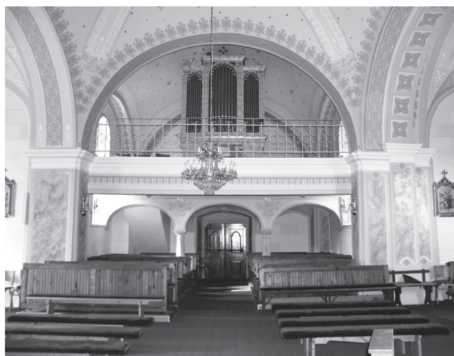
Slika 14. Unutrašnjost crkve, pogled prema pjevalištu (foto: M. Korunek).

mlje da bi se proširio plato oko crkve, a sljedeće godine »blokiran« je brijeg kao obrana od pomicanja terena, odnosno erozije. Godine 1961. dodatno je navožena zemlja i šljunak, a sve s ciljem niveliranja i proširivanja crkvenog dvorišta.