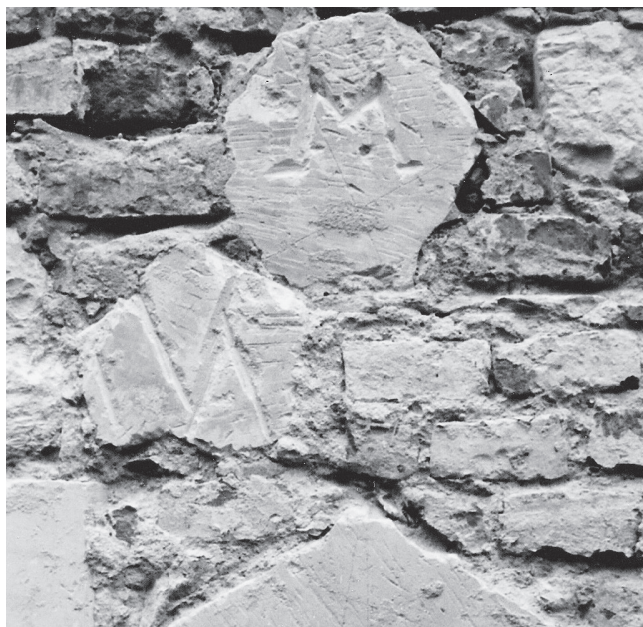
Slika 5. Fragmenti gotičke arhitektonske plastike uzidani u zid svetišta kao spolije, snimljeno 1991. g..

izmijenjen je zid na gornjem dijelu lađe (sl. 9). Gledano sa zapada, lađa ima po jedan veliki lučni prozor na sjevernom i južnom zidu, i to u prvom traveju. Tijekom obnove crkve 2008. godine drvena stolarija zamijenjena je novom koja je potpuno neprihvatljiva za objekt ove vrste. Naime, riječ je o PVC stolariji koja imitira drvo, ali njene staklene plohe su predimenzionirane i narušavaju izgled crkve. Stolarija je osobito neprimjerena prozorima sjevernog i južnog zida lađe koji su iznutra »presječeni« pjevalištem, što djeluje konfuzno i nedorečeno. Svu PVC stolariju na crkvi trebalo bi zamijeniti drvenom koja bi oblikom oponašala stariju, i to tako da se velike staklene površine podijele na manje plohe. Na zapadnom zidu lađe ispod zvonika nalazi se glavni ulaz u crkvu naglašen jednostavno oblikovanim baroknim portalom.