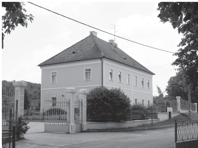
Slika 15. Pogled na kuriju župnog dvora.

uz napomenu da se u njima više nitko ne pokapa. 54 Što se tiče zidanih grobnica, najprije treba sanirati ulegnuti svod grobnice u sjevernoj bočnoj kapeli čiji pod pokazuje deformaciju. Na prvi pogled nije bilo moguće utvrditi realnu opasnost od urušenja, ali treba napomenuti da se na tom mjestu nalaze klupe kojima se svod neprestano opterećuje i dodatno oslabljuje.