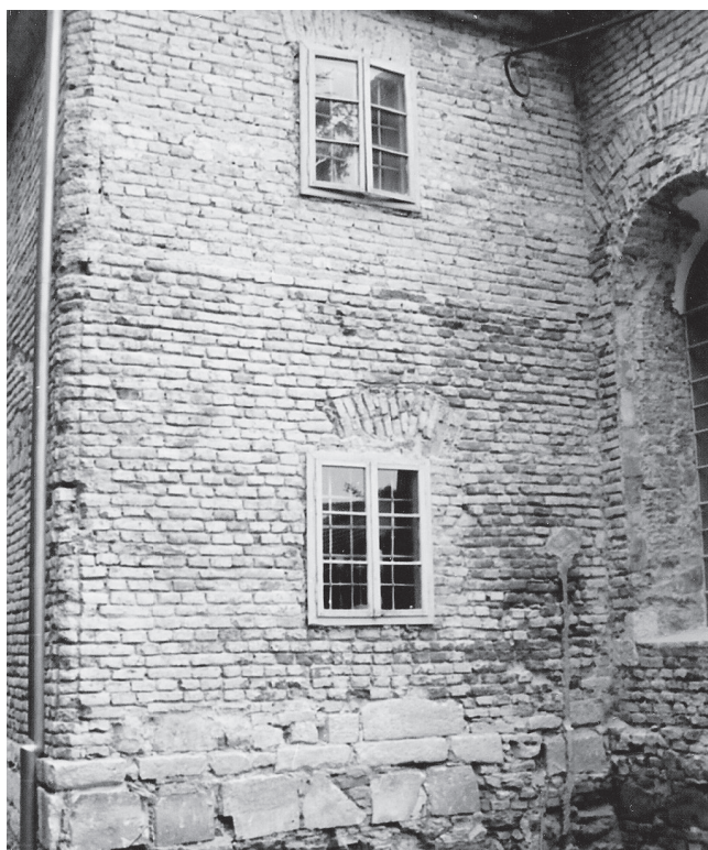
Slika 6. Vanjski zidovi sakristije snimljeni 1991. g. kad je sva žbuka bila uklonjena.

podataka u radu će se pokušati dokazati da zahvati na ovoj građevini nakon potresa 1738. godine ipak nisu bili toliko temeljiti i da crkva nije srušena do temelja. To je lako zaključiti pregledom same građevine i sačuvanih fotografija iz 1991. godine kad su na crkvi izvršeni građevinski radovi u kojima je s vanjskih pročelja skinuta sva žbuka.