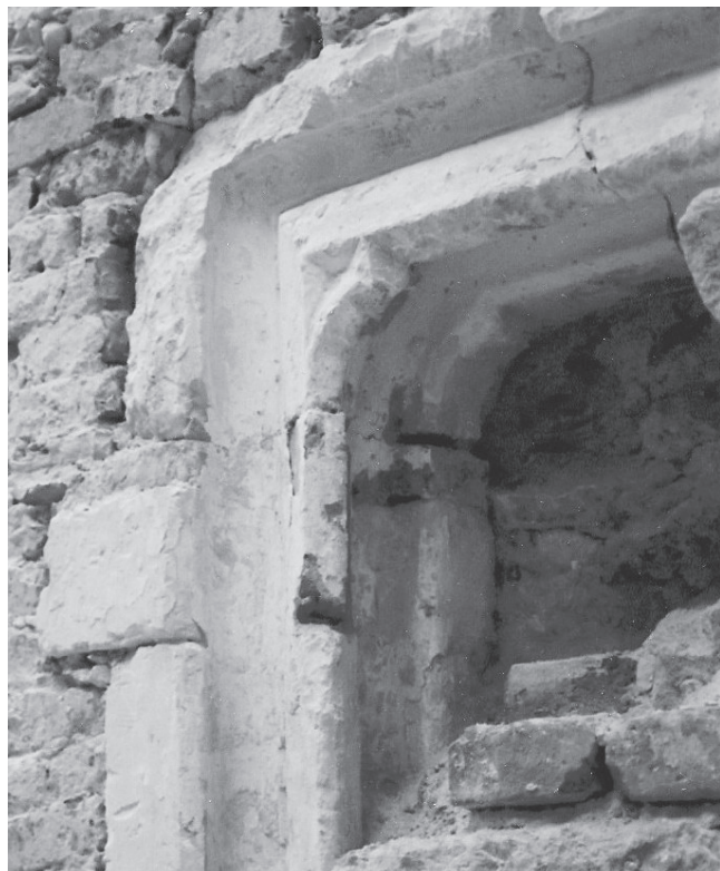
Slika 12. Djelomično otvoreni kasnogotički portal na južnom zidu lađe snimljen 1991. g. (inv. br. P/248).

pjevalište. 42 Dakle, zidano pjevalište izgrađeno je u baroknom stilu u 18. stoljeću (sl. 14). Ono je danas samo djelomično očuvano jer je u jednom od nedavnih zahvata pjevalište prošireno tako da je uklonjena izvorna ograda pa je ono svojim volumenom ušlo u lađu i prislonilo se na pilastre između prvog i drugog traveja (sl. 14). Spomenutim zahvatom izgubljeni su sklad i ravnoteža barokne unutrašnjosti pa je pjevalištu potrebno vratiti izvorni oblik. Da bi se mogao pravilno izvesti faksimil ograde baroknog pjevališta, potrebno je istražiti koliko elemenata imamo te sukladno tome odrediti završno oblikovanje. Ova dogradnja pjevališta, osim što narušava sklad unutrašnjeg prostora, narušava i vanjštinu crkve jer je vidljiva kroz prozore u lađi.