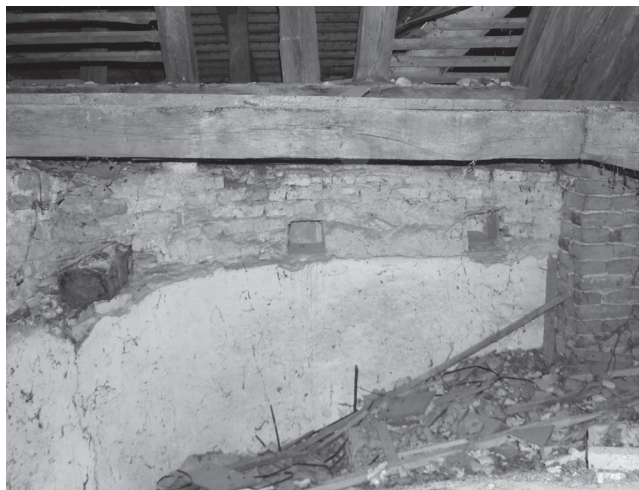
Slika 7. Polukružna prigradnja unutar lađe na spoju sa svetištem i ostaci tabulata, pogled sa sjevera na tavanu crkve.

spolije 27 (sl. 5), dolazimo do zaključka da je današnje svetište izgrađeno nakon rušenja gotičkog koje je najvjerojatnije postojalo do potresa 1738. godine. Da li je novo svetište tlocrtno pratilo oblik starijeg ili je prošireno, u ovoj fazi istraženosti teško je reći. Budući da su danas i lađa i svetište iste širine, starije svetište moglo je biti današnje širine ili uže, što je učestalije kod međimurskih kasno-srednjovjekovnih crkava. 28 Ovo nagađanje trebaju potvrditi buduća arheološka istraživanja u unutrašnjosti crkve. U prilog ovoj tezi ide i činjenica da na svetištu nisu pronađeni ostaci prozorskih otvora koji bi asocijali na gotički stil. Pronađeni su samo tragovi zazidanih većih četvrtastih prozora na sjevernom i južnom zidu poligona (sl. 4), a tjemeni zid ne pokazuje nikakve zazide ili promjene. Današnji prozori na svetištu istog su oblika kao i oni na lađi, a nalaze se na sjevernoj i južnoj stijeni (sl. 3). Na tjemenu zidu nalazi se samo jedan mali okrugli prozor (sl. 3).