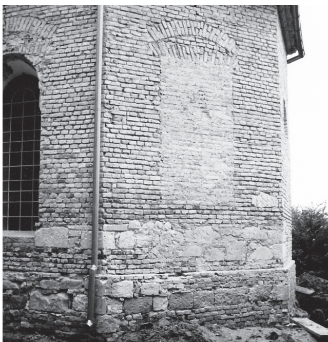
Slika 4. Vanjski zidovi svetišta snimljeni 1991. g. kad je sva žbuka bila uklonjena (inv. br. 82, br. neg. 4/23).