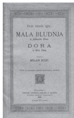
Slika 5. Dvije vesele igre. Mala bludnja-Dora, 1891.