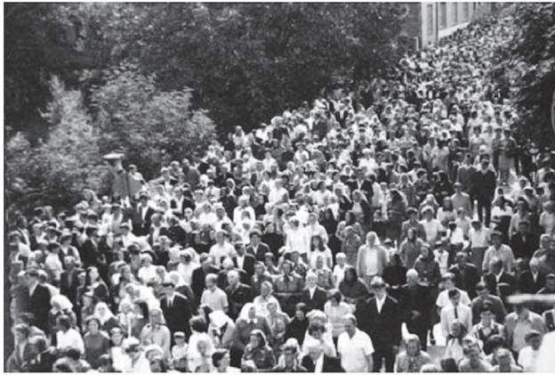
Slika 1. Proslava 350. obljetnice mučeništva Blaženog Marka Križevčanina, Križevci 7. rujna 1969. godine.

Cipriš je bio poznat u crkvenim krugovima te se na sve strane obraćao za svekoliku potporu u oragnizaciji proslave. Tome je uvelike doprinijela njegova propovjednička i govornička vještina kojom se služio u svim prigodama.