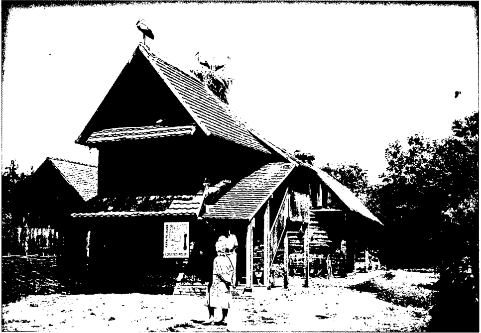
Kuća u edukativnoj i turističkoj funkciji. Na obnovljenom krovu ponovo gnijezde rode. Foto: A. Mlinar, 1999. g.