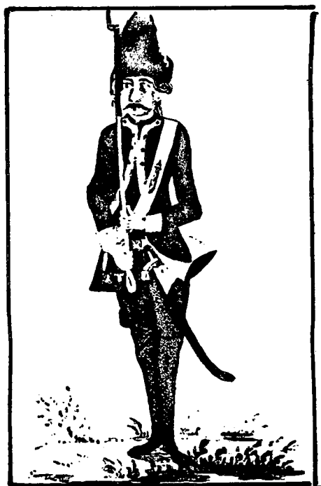
Odjeća slavonskih graničarskih vojnika i časnika iz XVIII. st.