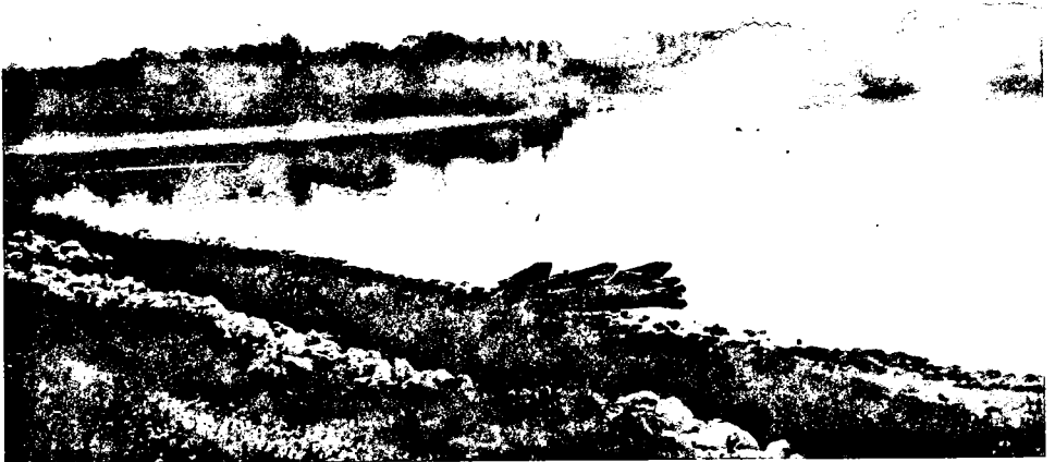
Utok Vrbasa u Savu u selu Davor