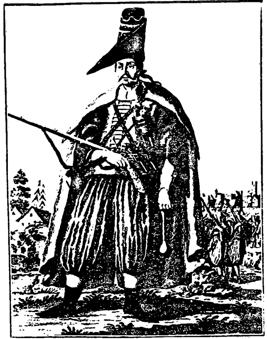
Odjeća slavonskih graničarskih vojnika i časnika iz XVIII. st.