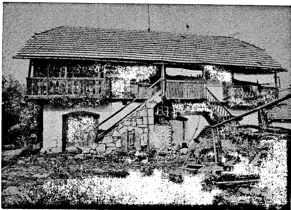
Stambeni objekt, Brlog ozaljski br. 29 i 31.