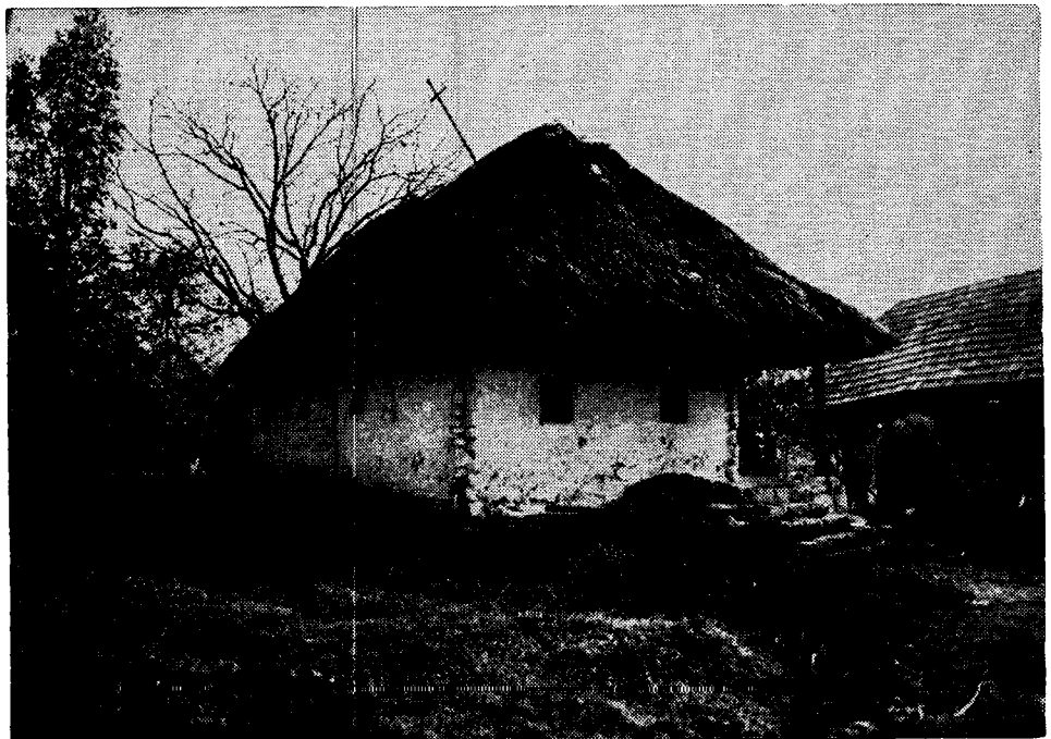
Stambeni objekt, Jasenovica br. 7