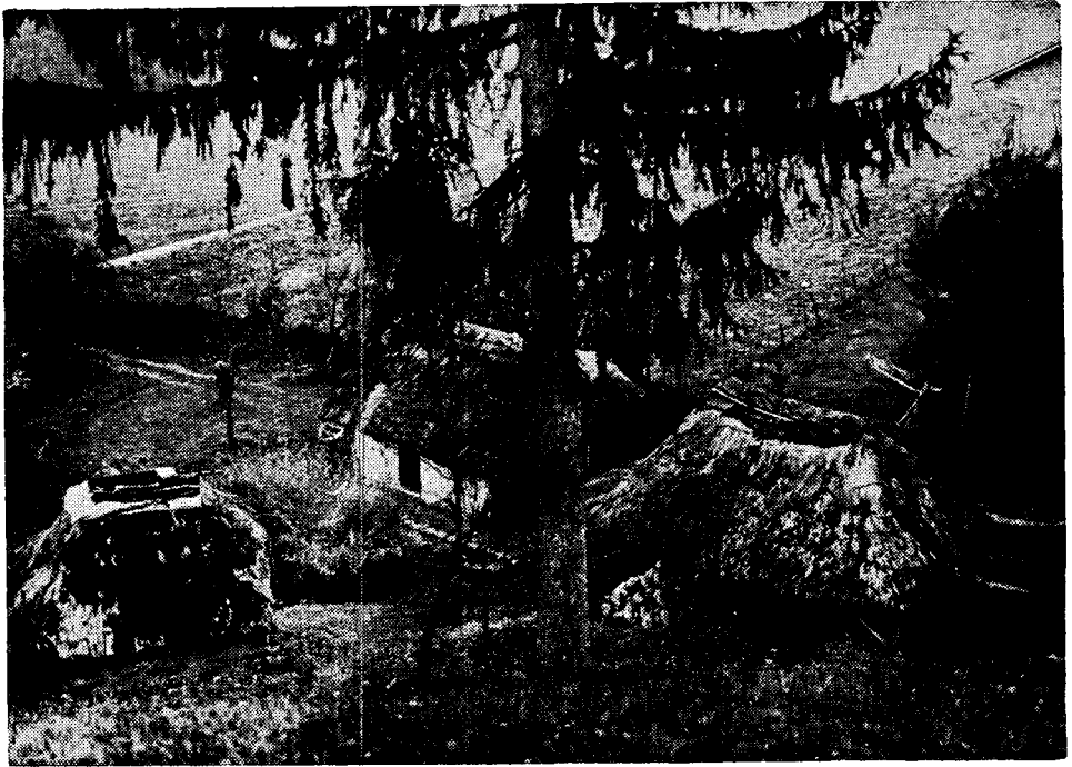
Okućnica kuće u Tomašnici, Potočko Selo 4