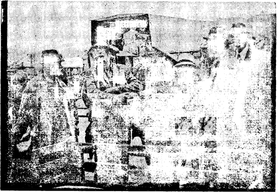
Pogađanje »po junački« na stočnom sajmu u Jastrebarskom.