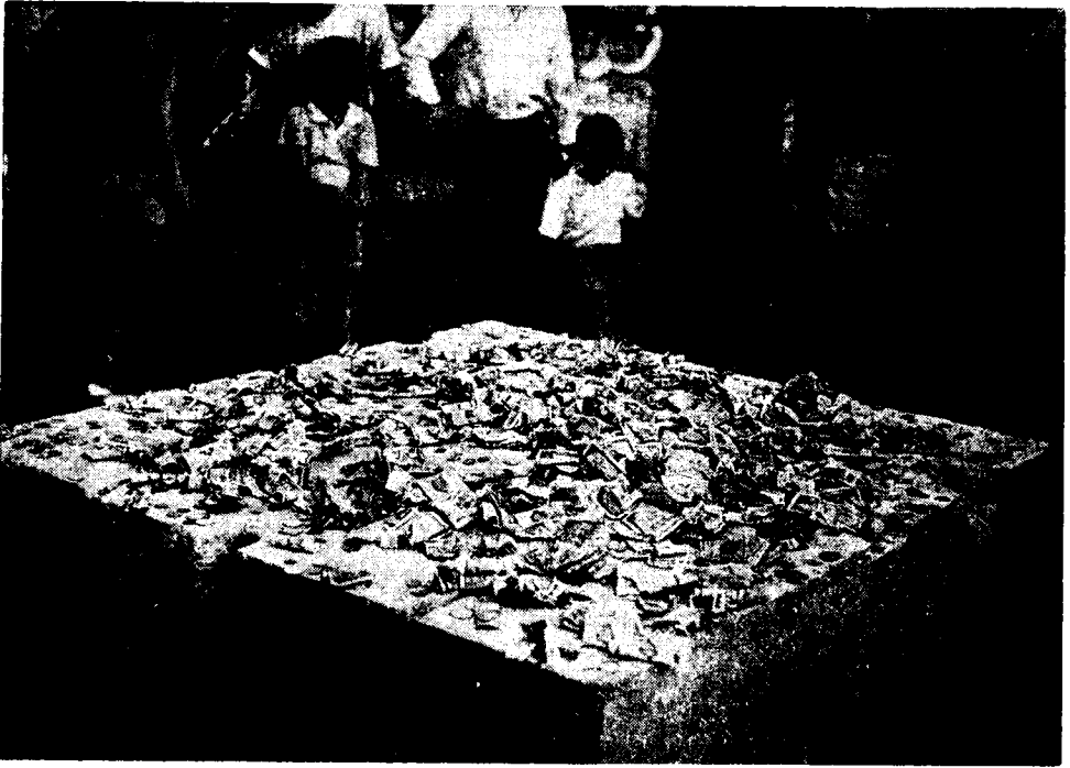
Oko vrela Manduševac na Trgu Republike, Zagreb 1987.