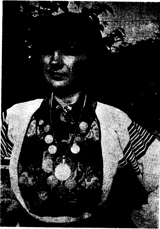
Cvancige na jedan križ, Rečica.

Pravoslavke na Kordunu također su nosile zlatnike- dukate . Nasljeđivale su ih po ženskoj liniji, a nosile su uvijek neparan broj.