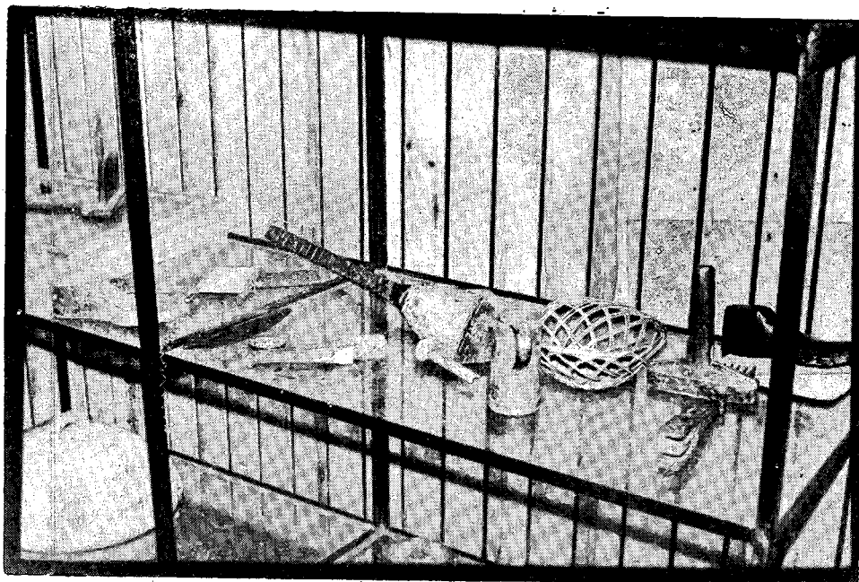
Dio etnografske zbirke u osnovnoj školi »Nada Dragosavljević« u Okučanima

Proteklih godina Zavičajni muzej iz Nove Gradiške nekoliko je puta pokušavao uputiti škole u način vođenja dokumentacije 3) predmeta, ali se do sada ništa od tih pokušaja nije ostvarilo i provelo u život. Nastojanje da se izradi dokumentacija predmeta, i da se po jedan primjerak pohrani u matičnoj evidenciji Zavičajnog muzeja, zaustavljeno je uvijek na pitanju odvajanja vremena za vođenje ovakvih poslova. U anketi koju sam provela po školama na pitanje, da li je škola voljna nastavniku odvojiti sate za vođenje zbirke, sve su škole odgovorile da nisu na to spremne, jer te sate ne priznaje SIZ i nemaju taj posao ugrađen u normative.