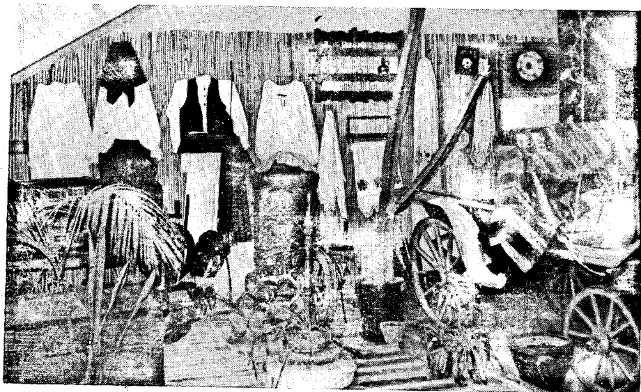
Dio etnografske zbirke u Osnovnoj školi »Milan Tomić Slobodan« u Novoj Gradiški