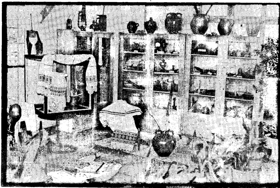
Dio etnografske zbirke u osnovnoj školi »Zlata Dupko« u Novoj Kapeli