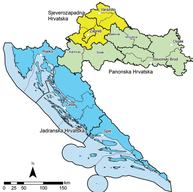
Slika 3. Predloženi teritorijalni ustroj Hrvatske na 10 regija Figure 3 The proposed territorial structure of Croatia in 10 regions

The optimal number is obviously between 8 and 12, bearing in mind the application of these criteria, especially the decentralization of appropriate sustainable region. Specifically, it should be stressed that the model of potential administrative scheme with 5-7 regions resembling the former communities of municipalities or connected only to cities with over 100,000 inhabitants, would be in accordance with the concept of centralized Croatia. But now (and again, as in the previous system on the level of "macro-regions"), as was the case until 1991, that model would leave considerable Croatian areas without their functional centres. They would end up on the periphery of the macro-regional influence, and could not develop natural and logical relations to the centre – regional complex. The concept of traditional regions (Istria, Lika, Dalmatia, Slavonia, etc.) is also unacceptable since it does not correspond to modern network of cities and the needs of Croatian regional development, and gives primacy