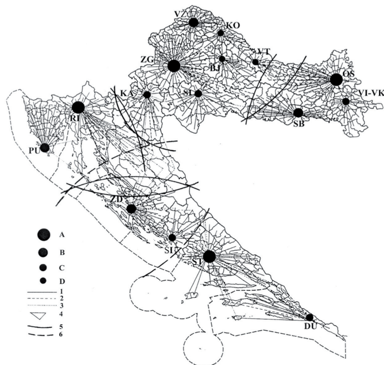
Slika 4. Najznačajnija nodalno-funkcionalna središta Hrvatske s gravitacijskom shemom

Realization of this concept would enable Croatian regions, with regard to the administrative authorities and functions of the area, and according to the size of the territory, population and other parameters, to correspond closely to regions of neighbouring and close countries of Europe (Hungary, Slovakia and the Czech Republic) and of the majority of other European countries with similar level of development and administrative-territorial organisation. It certainly does not mean abolishing some counties at all, but could signify, for the purpose of the NUTS regionalization, some kind of cooperation among them.