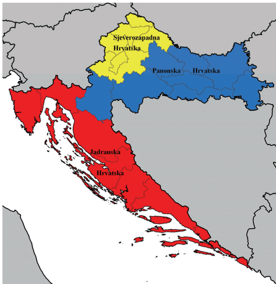
Slika 1. Tri hrvatske NUTS II regije, 2007.

Adriatic Croatia, as well as Eastern (Pannonian) and Northwestern Croatia, is one of the three defined (forthcoming) Euroregion NUTS II in the Republic of Croatia. The process of defining these regions lasted several years and a large number of proposals that Croatia was officially forwarding to Eurostat has been explored. Proposals considered three to five regions of order 2 and several theoretical, scientific and professional papers on this topic have been written (ČAVRAK, 2002.; MAGAŠ, 2003, 2005.; LOVRINČEVIĆ ET AL., 2005; ŠANTIĆ, 2006; DOBRIĆ, 2008). After negotiations with Eurostat, in March 2007, the European Commission approved the compliance of division proposals of Croatia at three NUTS II regions (Northwestern Croatia, Central and Eastern /Pannonian/ Croatia and Adriatic Croatia) (NN, 35/07) (Fig. 1).