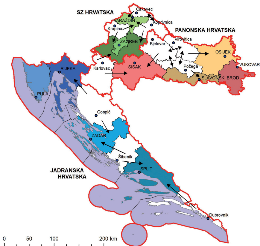
Slika 2. Karta mogućeg grupiranja županija oko onih koje zadovoljavaju kriterij 150 000 – 800 000 stanovnika

If such new decentralization and regionalization of Croatia occurs, it would primarily mark differentiation in a number of demographic, geographic, economic, financial, administrative uniformed (as much as possible) and, for the future development, optimal regions of NUTS III (Fig. 2 and Fig. 3). Most certainly, the number is defined between the maximum of (existing) 21 counties