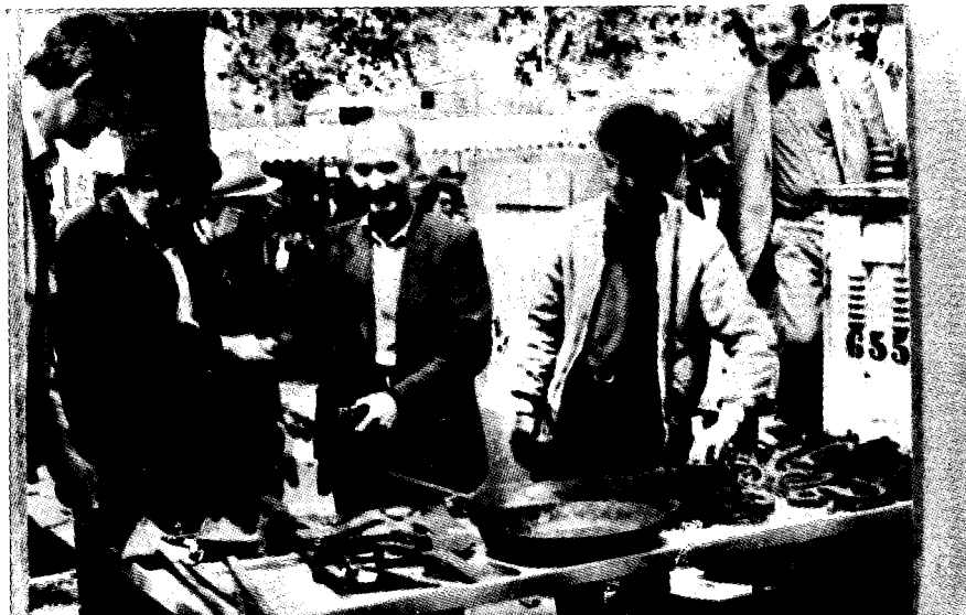
Kovački proizvodi iz Bosne 1983. g.