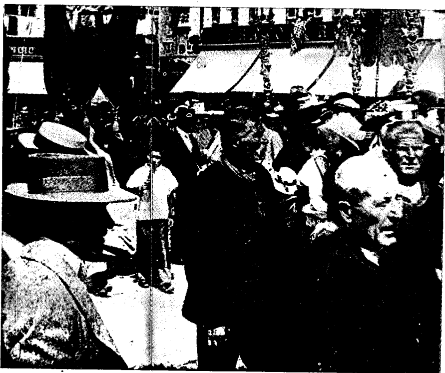
Procesija na Pjaci 1911. g.