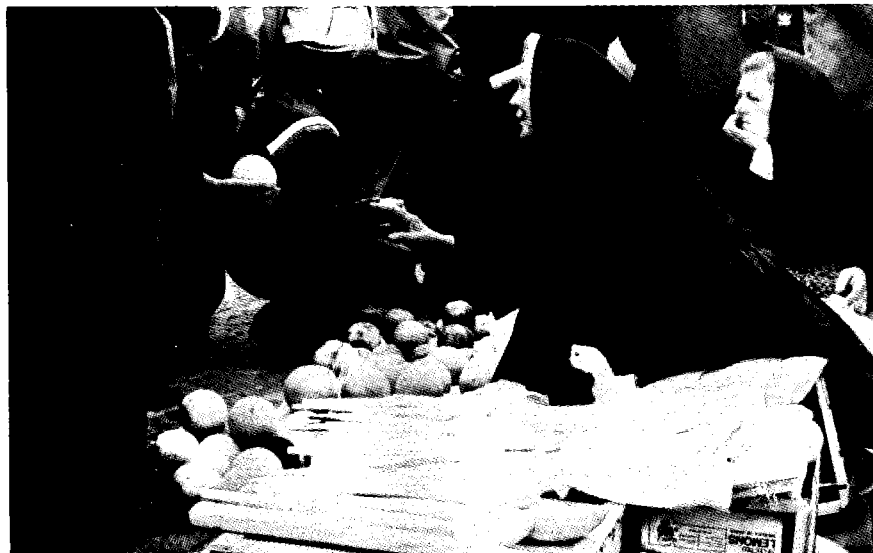
Drvene žlice i balote 1983. g.